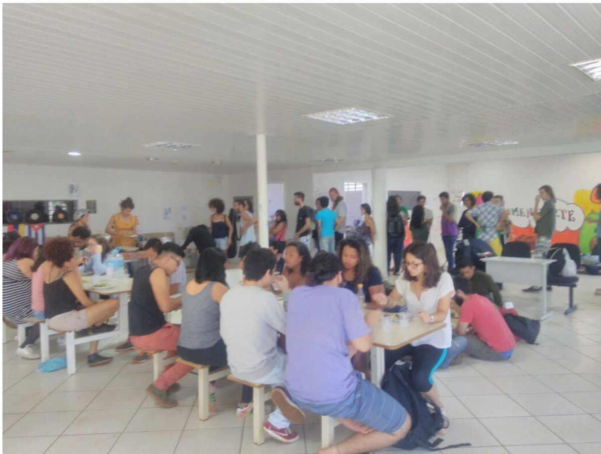
Fotografía 9 RAE en funcionamiento 2017.