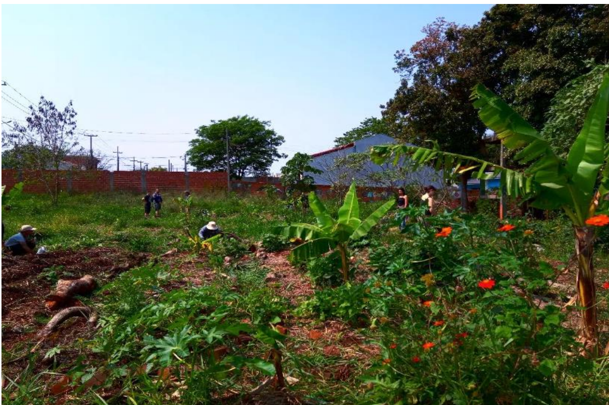
Fotografía 10 Horta comunitaria