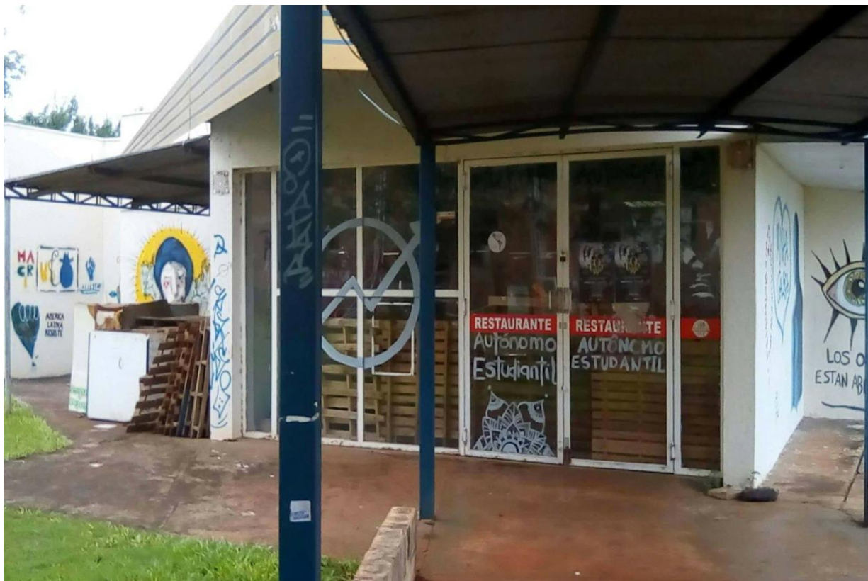
Fotografía 8 EAE durante el funcionamiento del RAE.

alimentación, nutrición y soberanía alimentaria, que se enfocara en una política alimentaria para la comunidad.