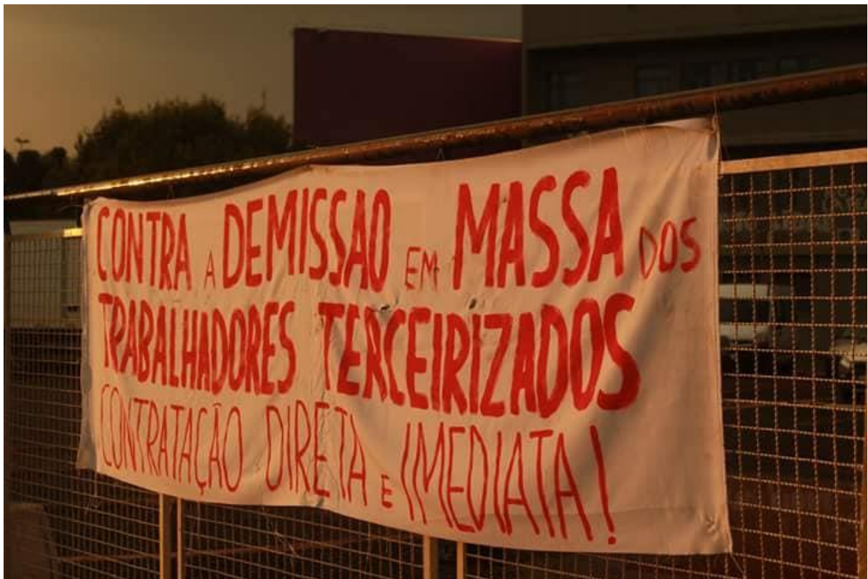
Fotografía 6 cartel colgado en la puerta de la UNILA.

Este es uno de los 5 carteles que fueron colocados para señalar las razones de dicha paralización. Tiempo en que las actividades académicas fueron interrumpidas. Siendo la paralización y la okupa, que es una acción directa utilizada por el movimiento estudiantil para la reivindicación de un espacio como protesta política y social tomando estos espacios sea como lugares de residencias permanentes o espacios de encuentro donde hacen talleres, ollas comunitarias, eventos, encuentros de charla y apoyo mutuo. Estas tácticas son utilizadas por los estudiantes para generar respuesta a la precarización de las políticas de educación superior o alguna situación de conflicto, inseguridad o violencia dentro de la universidad.