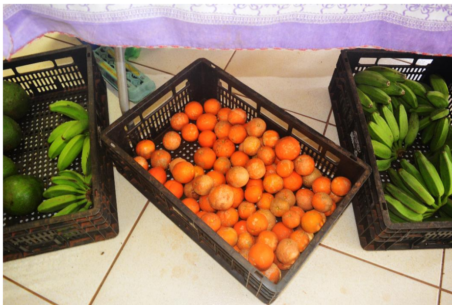
Fotografía 1 Alimento de productores locales

sus propios espacios de comercio a través de múltiples formas de organización que resultan en iniciativas para espacios culturales, algunas con apoyo y financiamiento municipal y otras de manera autónoma que desencadenan en proyectos de extensión. Un ejemplo es el espacio conocido como la Feirinha Agroecológica da UNILA , que se celebra semanalmente en el Campus Jardim Universitario. Este es un espacio de gran importancia dentro de la cotidianidad de la comunidad estudiantil, ya que permite que las personas que tienen productos, alimentos, artes, artesanías y servicios puedan ofrecerlos. Es un espacio que nace desde el 2015 a partir de la interacción entre la comunidad estudiantil y campesina local, con el intuito de promover una economía solidaria. Esta iniciativa nace de la necesidad de tener un lugar de intercambio, convivencia, cultura, educación popular y comunitaria sobre la reforma agraria y la soberanía alimentaria.