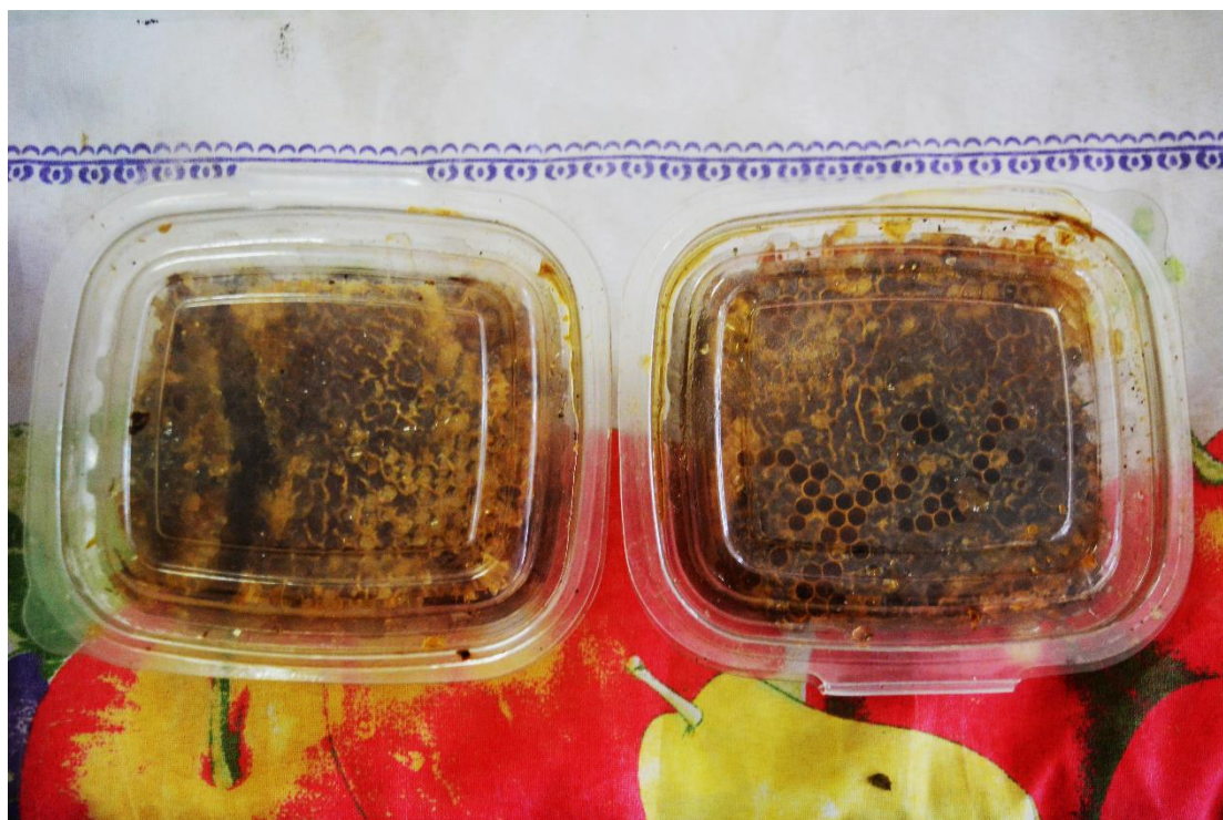
Fotografia 3 Alimento de produtores locais