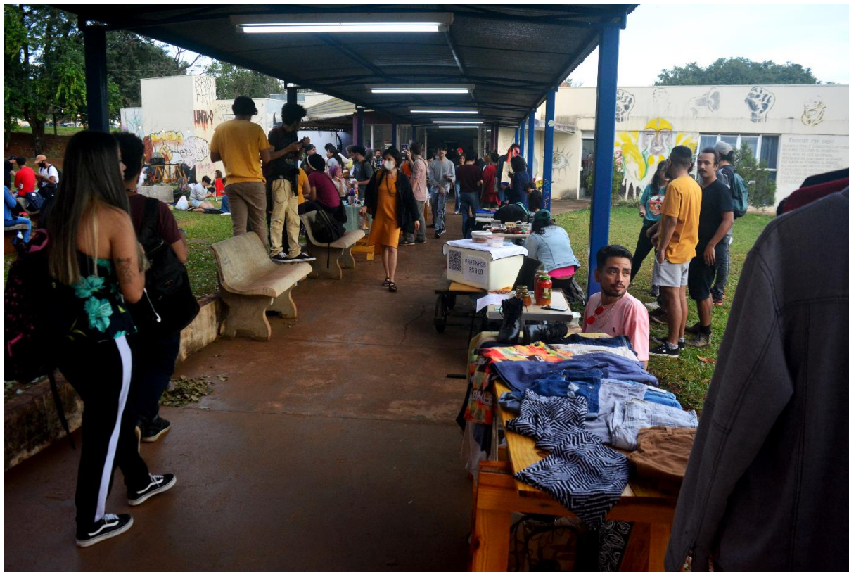
Fotografía 4 Ferinha Agroecologica na UNILA