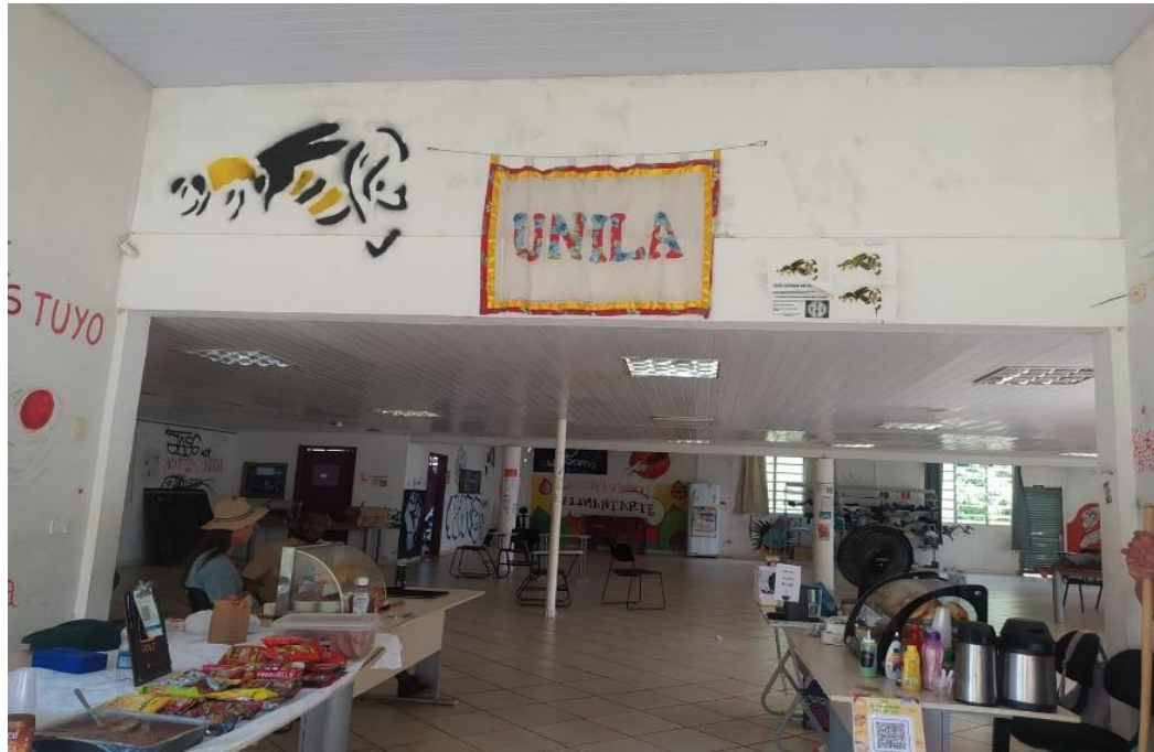
Fotografía 5 Cantinho do sabor, Funcionando en el EAE

Jardín universitario donde se instalaría el Espacio Autónomo Estudiantil, el cual para el año 2018 ya estaba siendo usado como el “Cantinho del Sabor”.