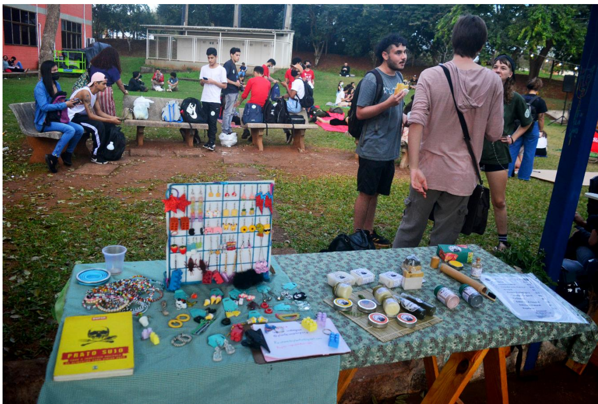
Fotografia 2 Ferinha Agroecologica na UNILA