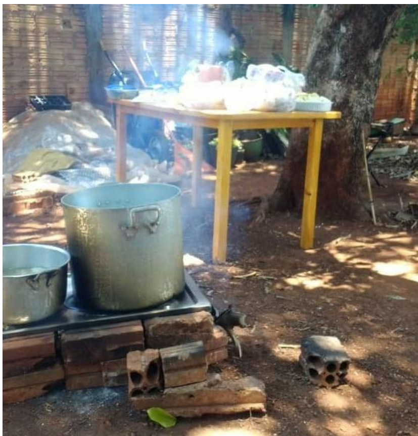
Fotografía 7 Fotografia del evento.