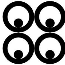
Figura 4 - Mate Masie: sabedoria, conhecimento e prudência Cultura Ashanti