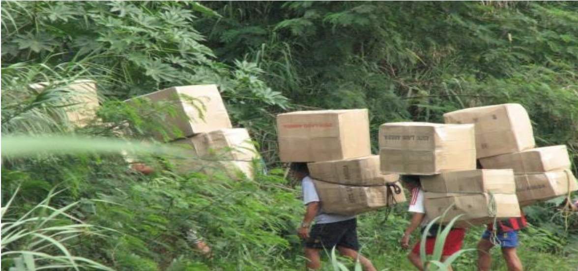
FOTOGRAFIA 1 - TROCHAS ILEGALES.

clandestinos por las trochas o como también conocemos como caminos verdes. Por donde tienen la frecuencia de sacar los productos de Venezuela hacia Colombia.