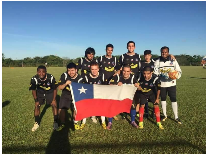
Equipo Colo-Colo sin frontera.