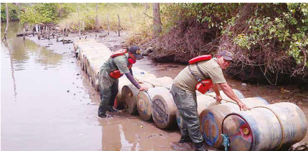
Foto 3. Contrabando para Colombia por barriles.

En los ataque políticos podemos ver que los problemas sociales que está sucediendo en la frontera colombo-venezolana son problemas sociales de las malas políticas sociales de parte de ambos Gobiernos. Ya que los problemas sociales que en ese lugar se encuentran hacen que el venezolano como el colombiano, vivan en lugares precarios donde no tengan derecho a la salud como una buena educación.