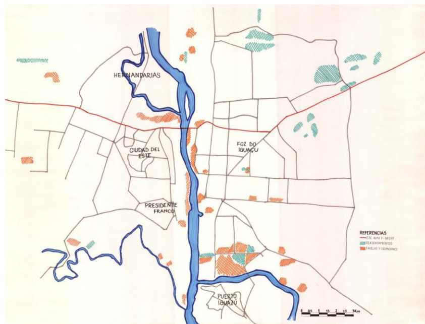
Figura 2 Asentamientos en la región fronteriza

trabajos académicos locales/periferias debido a la escasez de los mismas.