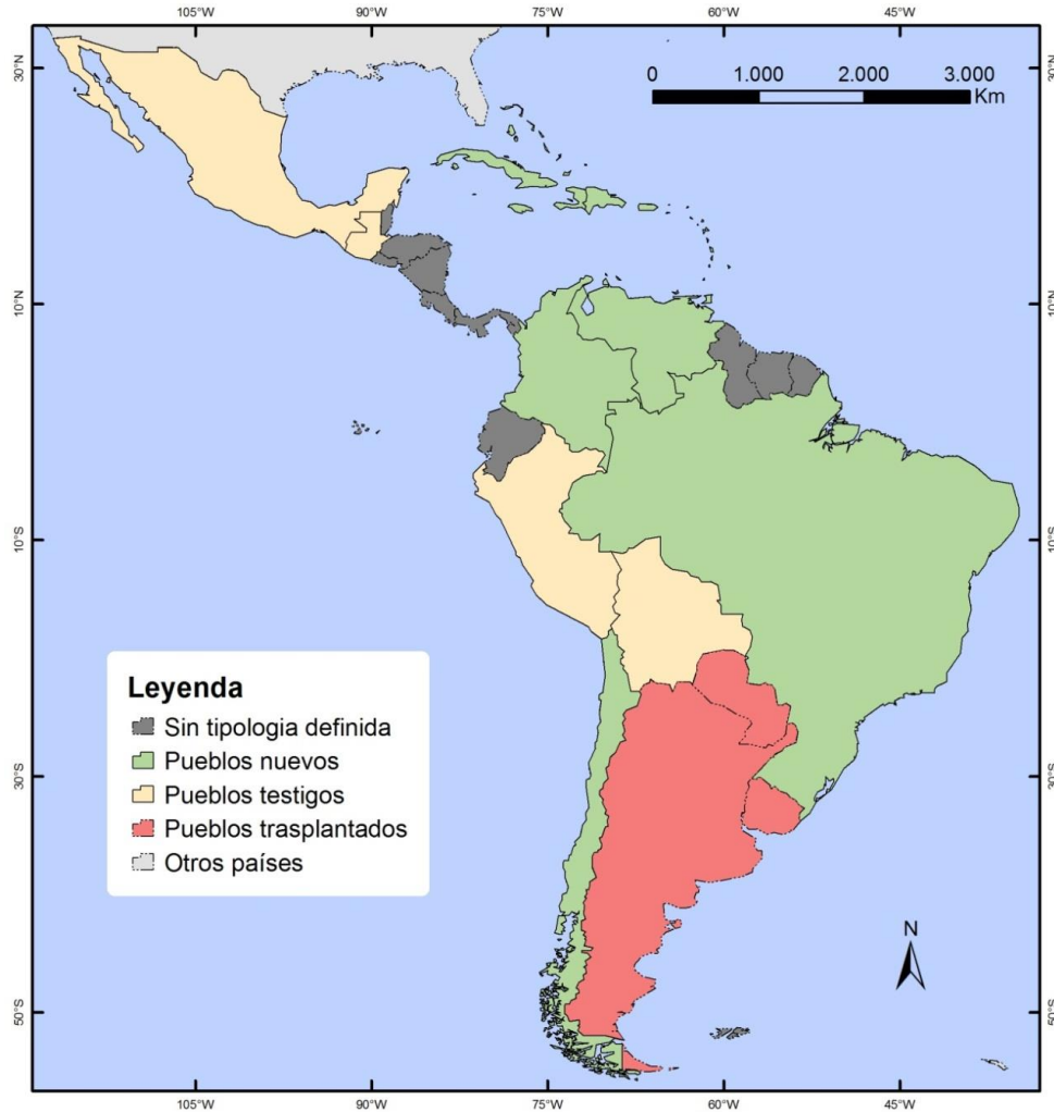
Mapa 1: Tipología Etno-cultural