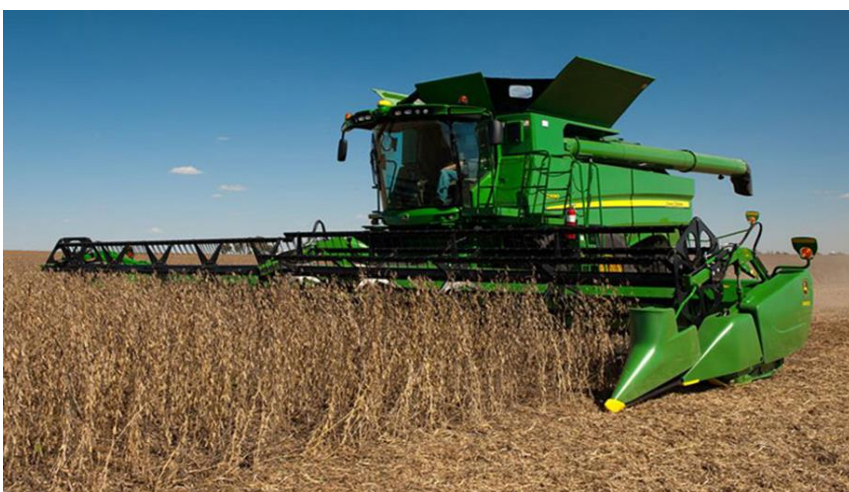
Figura 3.