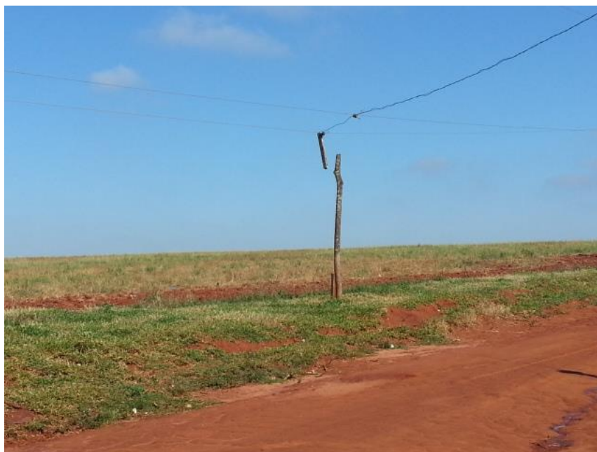
Ilustración 4. Camino desértico. Itakyry (2015)