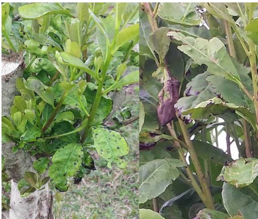
Ilustración 6. Yerba mate quemado por presumibles fumigaciones de agrotóxicos. Itakyry (2015)