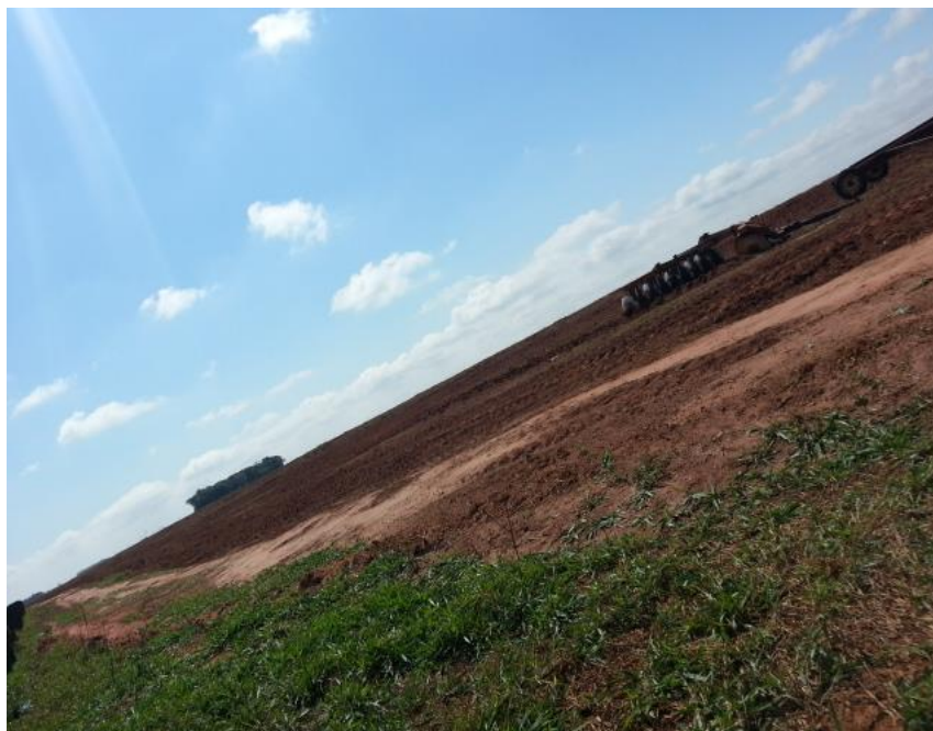
Ilustración 3. Terreno arado. Itakyry (2015)