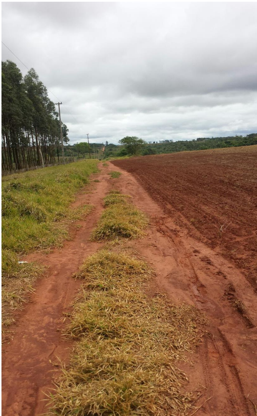
Ilustración 7. Futura plantación a cm del camino. Itakyry (2015)