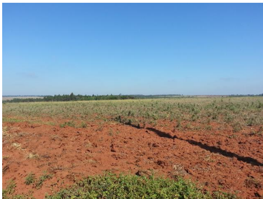
Ilustración 2. Preparación del terreno para plantación de soja. Itakyry (2015)