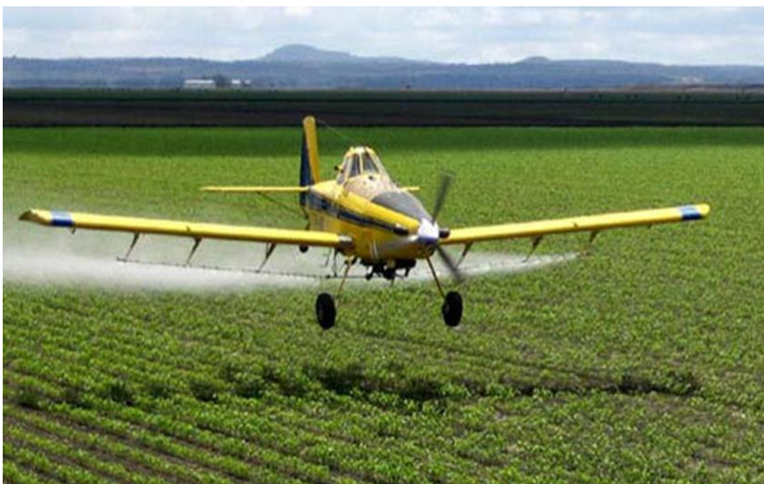
Figura 2- Avión pulverizador en plantación de soja en zona de Alto Paraná.