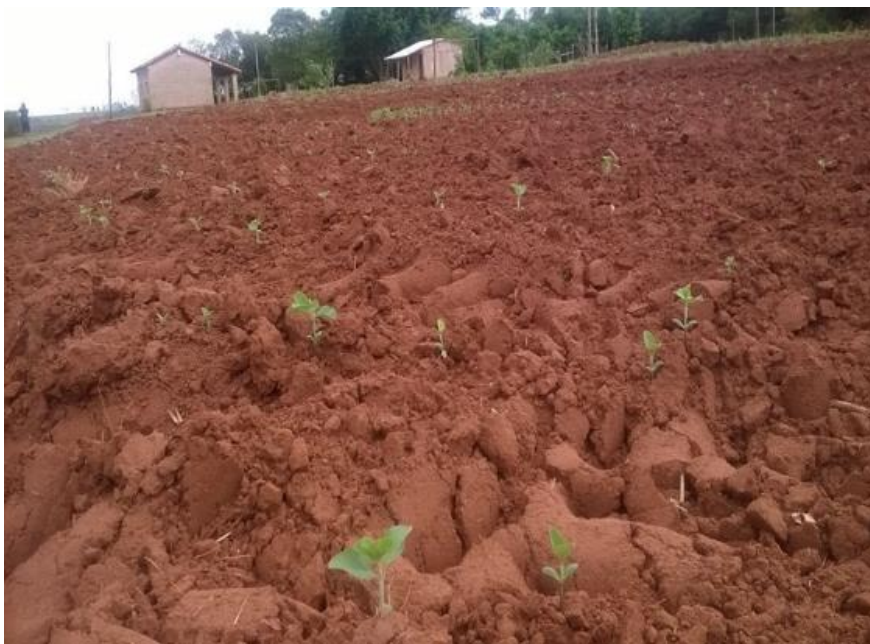
Ilustración 5. Plantación de soja en predio de escuela. Itakyry (2015)