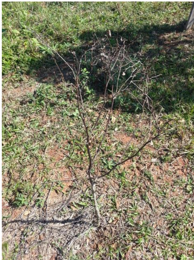
Ilustración 1. Planta de yerba mate en estado deteriorado. Itakyry (2015)