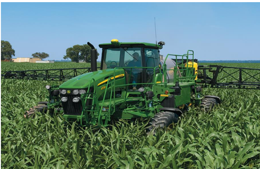
Figura 4.