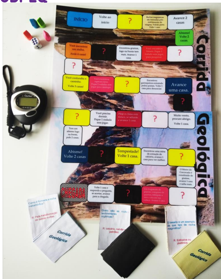
Figura 1: Tabuleiro com as cartas, peças, dado e cronômetro.

Para a aplicação do jogo didático em sala aula, sugere-se que a turma seja dividida em 4 equipes e cada equipe deve escolher um representante para lançar o dado e definir a ordem de participação; o professor atua como mediador, responsável por fazer as perguntas, marcar o tempo das respostas e conferi-las. Depois de definida a ordem, cada representante escolhe seu peão. O representante da primeira equipe lança o dado e percorre o número de casas correspondentes, seguindo as instruções contidas na casa onde parou; caso caia em uma “casa pergunta”, indicada no tabuleiro pelo símbolo [?], deve responder a uma pergunta de uma carta (de mesma cor da casa: banca, amarela ou preta), que será lida pelo mediador. Se errar a resposta, permanece no mesmo lugar, e a vez passa para a equipe seguinte. Se acertar, a equipe tem o direito de lançar o dado novamente e avançar o número de casas sorteado no dado sem a necessidade de cumprir a instrução nela descrita, e a vez passa para a equipe seguinte. É declarada vencedora da partida a equipe que obtiver no lançamento do dado, o número exato de casas necessárias para alcançar à chegada. Vale ressaltar que a cada rodada, um membro diferente de cada equipe deve responder à pergunta da vez, assegurando assim que todos participem ativamente e tenham a possibilidade de ampliar seus conhecimentos.