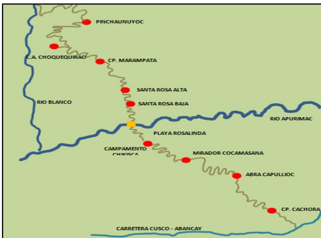
Diseño 1 – Parte del croquis de Equipo Técnico COPESCO en base a trabajo de campo Setiembre 2012

La existencia del sitio arqueológico se mantiene suposiciones de lo que hubiera podido ser utilizado como un centro religioso, o militar o también una casa de retiro del Inca. Se ha convertido en un elemento en que podría dar respuestas a incógnitas del espacio andino que está dada por la relación entre la naturaleza y su medio social que relaciona la herencia de intermediarios que constituyen los ciclos míticos del imperio inca. La siguiente foto (octubre de 2014), destaca algunos de los sectores principales de Choquequirao.