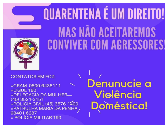
Imagem: campanha Coletivo Mulheres Sem Fronteira