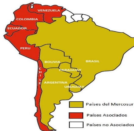
GRAFICO 3: Mapa de los países miembros del Mercosur ampliado