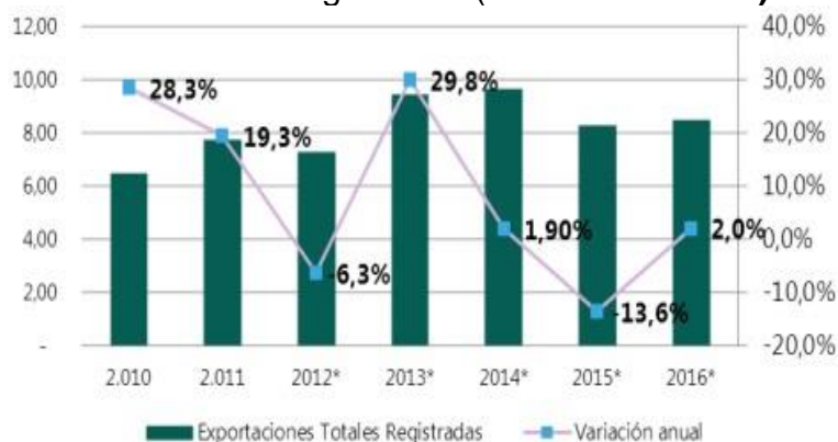
GRAFICO 1: Exportaciones totales registradas (Millones. de USD)