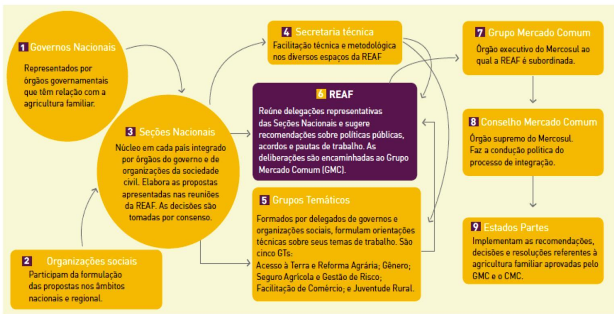
GRAFICO 5: Estructura funcional de la REAF