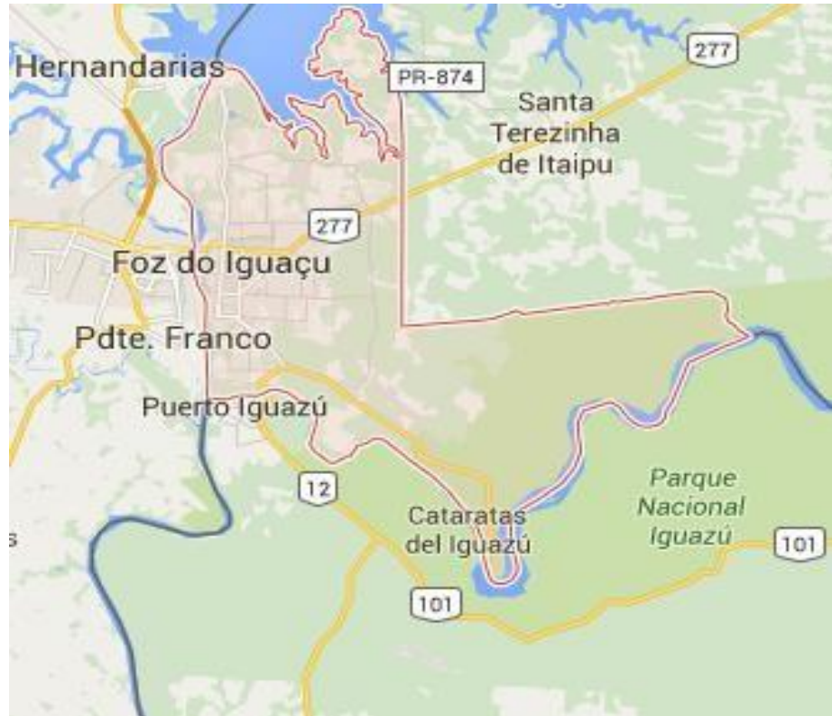
Figura 1: Mapa de ubicación del Municipio de Foz do Iguaçu