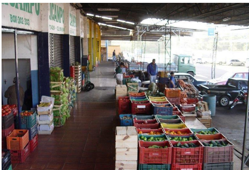
Figura 3: “Box” de la Central de Abastecimiento de Foz do Iguaçu