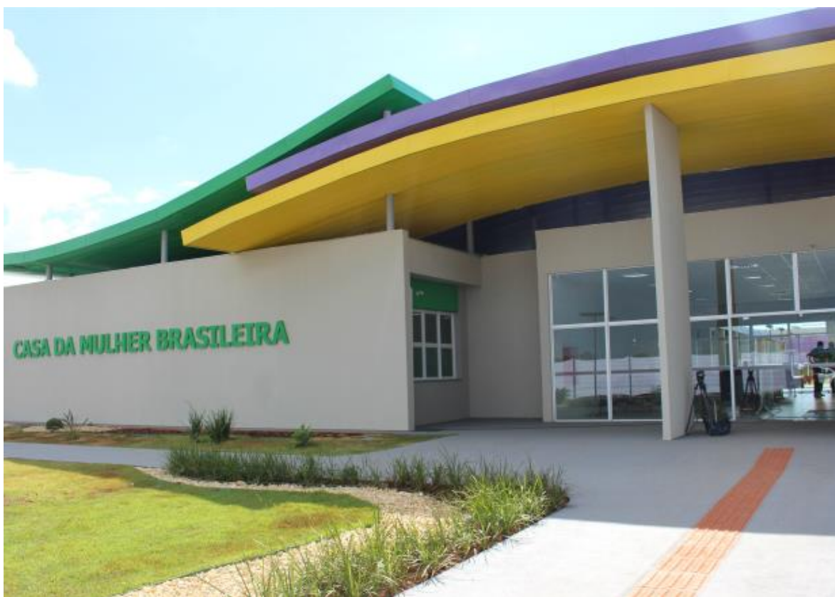
Imagen 1. Fachada de la Casa de la Mujer Brasileña. Campo Grande – Mato Grosso Del Sur.

Fuente: Foto tomada por la autora visita de campo (CMB-CG) Abril 2019.