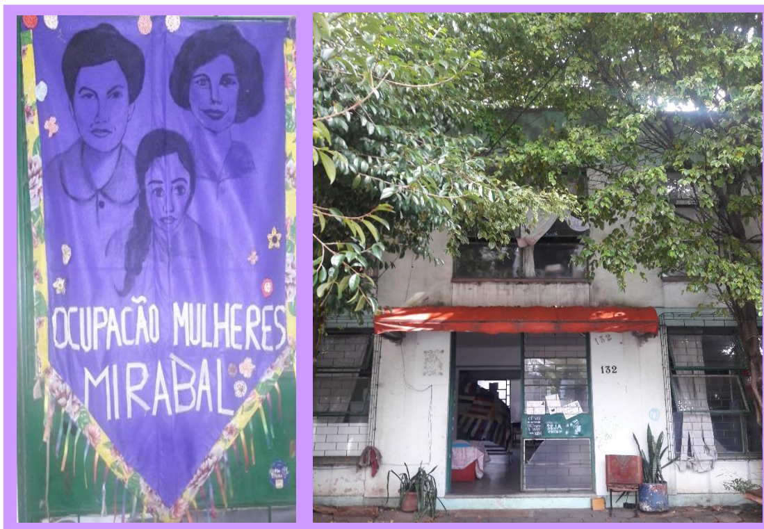
Ilustración 5. Casa de Referencia de la Mujer-Mujeres Mirabal. (Calle Souza Reis 132, Antigua Escuela Benjamin Constant. Porto Alegre)