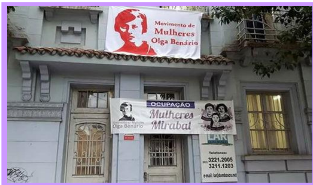
Imagen 2. Casa de Referencia de la Mujer – Mujeres Mirabal. (Calle Duque de Caxias 380, Centro de Porto Alegre)

FUENTE: Fotos tomadas por la autora, visita de campo Julio, 2018