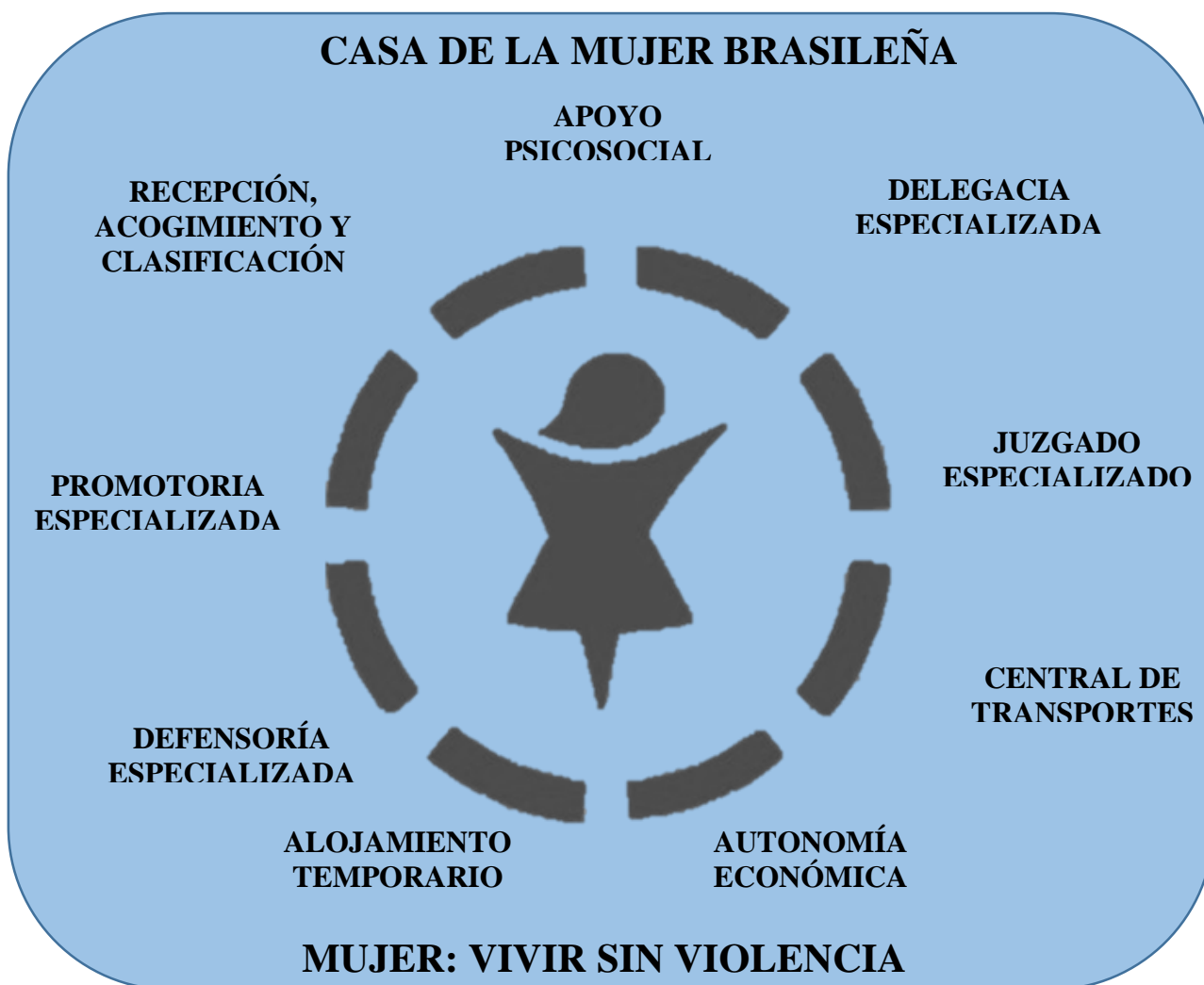
Ilustración 2. Servicios de la Casa de la Mujer Brasileña