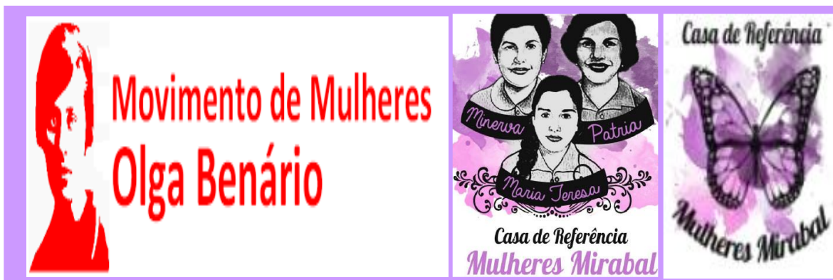
Ilustración 4. Logos Movimiento de Mujeres Olga Benário y Casa de Referencia de la Mujer-Mujeres Mirabal