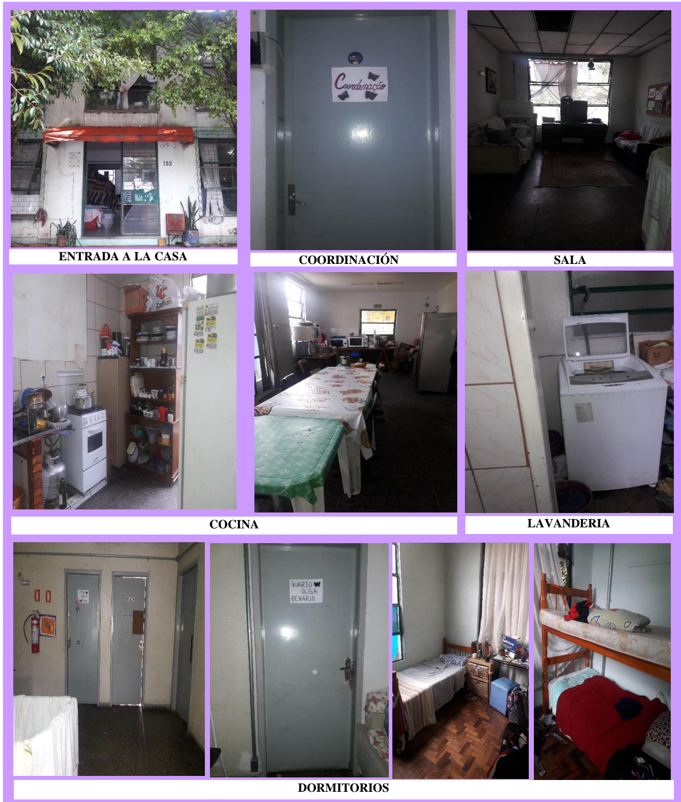
Imagen 3. Casa de Referencia de la Mujer – Mujeres Mirabal

FUENTE: Elaboración propia, a partir de las fotos tomadas durante la visita de campo: mayo 2019. Casa de Referencia de la Mujer- Mujeres Mirabal. Porto Alegre, Río Grande del Sur.