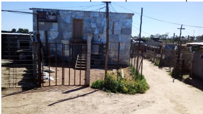
Foto 1 - Modelo de casa en la que viven las personas en los Eucaliptus