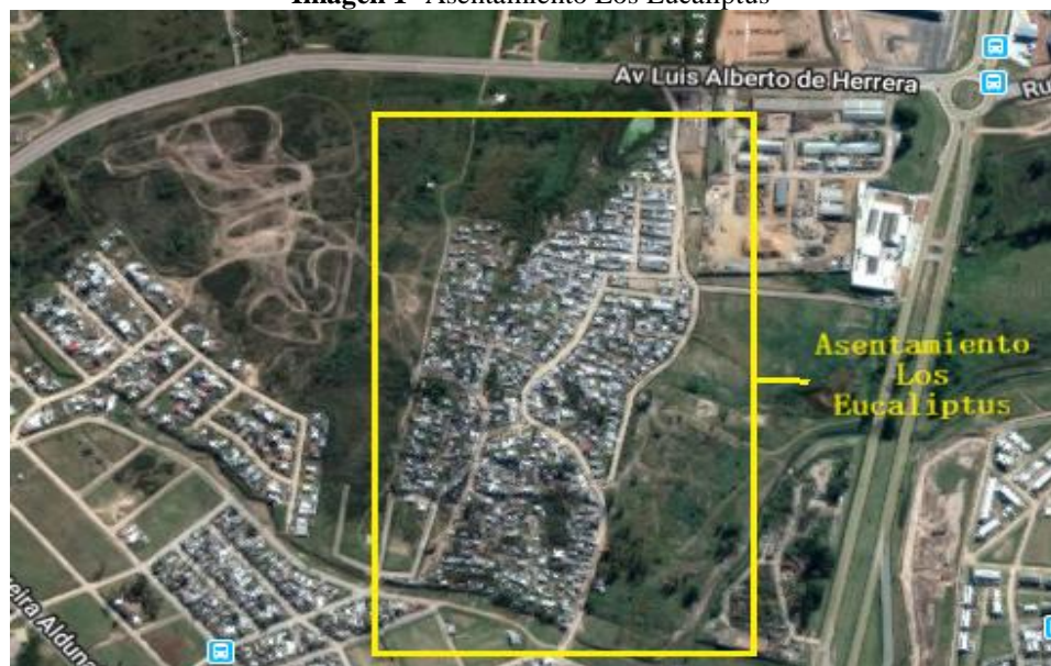
Imagen 1- Asentamiento Los Eucaliptus