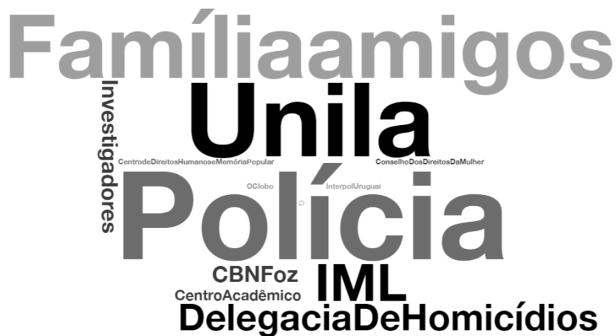
Gráfico 3: Nuvem de aparições de fontes nas matérias analisadas sobre o caso Martina

O Globo. O que a nuvem demonstra é que as fontes mais ouvidas são oficiais e auxiliaram no processo de compreender e resolver o caso.