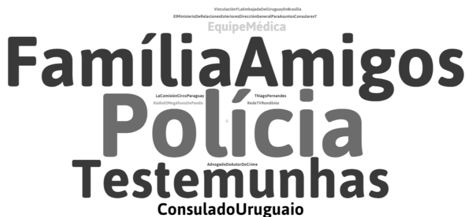
Gráfico 2: Nuvem de aparições de fontes nas matérias analisadas sobre o caso Matías

Outra variável que merece destaque nesta análise é a natureza das fontes entrevistadas nas matérias de ambos os casos. Tanto para a análise de Martina quanto de Matías, a classificação de fonte foi a mesma: Unila; Polícia Militar/Civil; Família/amigos; Representante de Movimentos/Associações; Organizações Internacionais. A partir da classificação desses dados, abaixo se apresentam tais informações indicando a incidência de ocorrências.