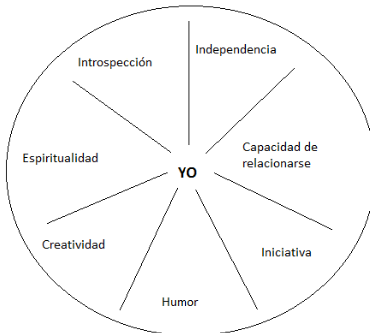
Mandala de la resiliencia. Modelo tomado (MORENO GONZÁLEZ, 2016, p. 45)

aquellos que envuelven a la comunidad con la que se trabaja, en la mediación artística, los conflictos a los cuales se ve expuesta una comunidad, no son abordados directamente, sino que el arte es una vía mediante la cual el grupo se enfrenta al conflicto de forma no consciente. En este sentido el facilitador del taller se encarga de proponer determinadas actividades a partir de las cuales las personas participantes puedan expresar sus emociones de forma indirecta, sin hacer mención al problema en cuestión. Como siempre hay una carga emotiva en cualquier tipo de conflicto, se considera que la oportunidad de tener un espacio de expresión libre y sin prejuicios por parte de quien facilita el taller, es fundamental para que las personas puedan proyectar mediante el arte, los sentimientos que surgen en relación al hecho. La posibilidad de simbolización del mundo subjetivo, permite que las personas liberen tensiones y generen posibles reflexiones que sirven como herramientas para enfrentar el conflicto. De esta forma se van generando formas de resiliencia: