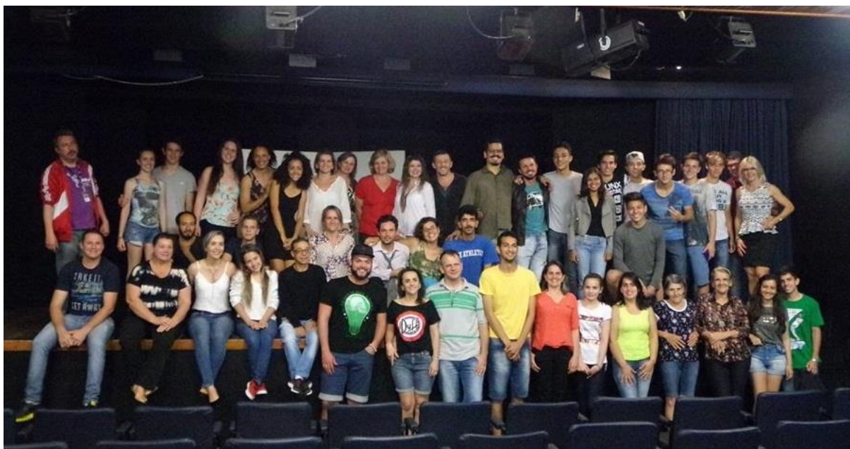
Foto: Colectivo de teatro junto con platea, presentación de “Caricias” en São Miguel, 2016.

educación, salud y cultura realizadas por el gobierno ilegítimo de Michel Temer, pieza que presentamos en escuelas de Foz de Iguazú como el colegio estadual Ipê Roxo (Cidade Nova) y el colegio particular CAESP (centro). El colectivo de teatro ha presentado varias veces en la ciudad, a través de iniciativas de la misma universidad, así como en parceria con la Fundación Cultural de la ciudad, teniendo una alta concurrencia. Hemos tenido la oportunidad también de trabajar en conjunto con la Escuela Nacional de Bellas Artes de Ciudad del Este a partir de los talleres de actuación en cámara que nos facilitó el profesor de teatro de la misma, Juan Bartolomé Ortega. La experiencia dentro del colectivo ha sido muy rica debido a su pluralidad, en concordancia con el proyecto de la Universidad, un grupo bilingüe que alberga personas de diferentes regiones de Brasil, así como de diferentes nacionalidades. En un comienzo el proyecto de extensión estaba volcado principalmente a estudiantes de la Universidad, pero hoy en día se han ampliado las políticas de difusión dentro de la ciudad para que también la comunidad externa pueda aproximarse.