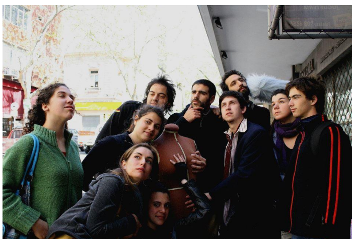
Foto: Equipo de Luna Nueva durante un rodaje. Montevideo, 2011.

En América Latina, la violencia social tiene un alto índice que dificulta el desarrollo humano y la vida en comunidad. La violencia parece crecer o disminuir en relación a factores tales como la desigualdad social, el acceso a la educación y a otros servicios como salud y cultura. Por otro lado, el hecho de vivir en una sociedad patriarcal siempre dejó en evidencia el ataque constante a niñas y mujeres en general, que acaba en agresiones físicas, violaciones y muertes. Entiendo que el arte y sus espacios de intercambio simbólico son un bien cultural, y que puede ayudar en el camino a esta reducción de la violencia. En el 2010 tuve la oportunidad de ser parte de un proyecto en una ONG de mi ciudad, 14 que se llamaba Luna Nueva y acogía a diferentes adolescentes en situación de vulnerabilidad social, brindando diferentes talleres, tales como radio, cine, fotografía e incluso cocina. En aquella época yo también era adolescente y participé en un taller de cine en el que nosotros mismos actuábamos, filmábamos y editábamos nuestros videos. Pude vivir en carne propia el hecho de participar de un proyecto que le dio sentido a mi vida y a la de otros y otras jóvenes en momentos de dificultad económica y familiar.