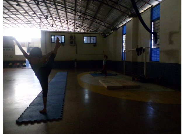
Fotos: Entrenamiento en el Conselho Comunitário da Vila C

Todo ese sacrificio comienza a cobrar sentido cuando un nuevo truco o una nueva postura es alcanzada, lo que da una gran satisfacción. La exigencia física nos lleva a replantearnos también nuestros hábitos y estilo de vida, entendiendo que la mejora en nuestros hábitos de consumo mejora también nuestro rendimiento.