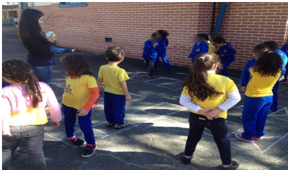
Figura 1: Jogo do Ludo

Jogamos duas vezes, trocando a posição das duplas, para que todos pudessem jogar como “peão” e como “dado” (Figuras 1 e 2).