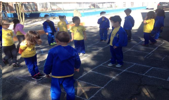
Figura 2: Jogo do Ludo