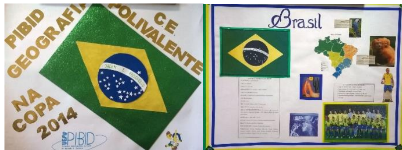
Figura 1. Cartazes produzidos pelos alunos do PIBID – Sub-projeto de Geografia da UEPG.

Em todos os colégios a dinâmica inicial foi a mesma. Os discentes foram divididos em grupos, e cada a cada um foi designado um país participante da Copa do Mundo de Futebol 2014. A partir disso, os alunos deveriam pesquisar as principais características de cada país e produzir cartazes com as principais características geográficas. O PIBID Geografia representaria o Brasil e construiu cartazes que serviram de modelo para os alunos, como demonstra a figura 1.