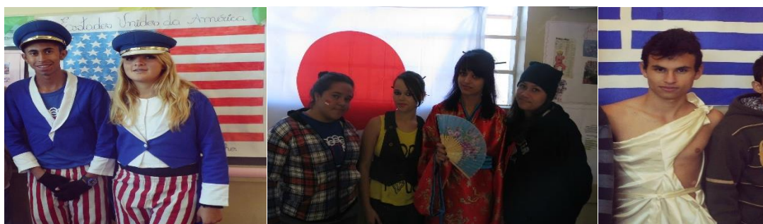
Figura 3. Alunos do Ensino Médio do Colégio Estadual José Elias da Rocha – Ponta Grossa – PR, representando alguns países participantes da Copa do Mundo em uma Feira das Nações.

Após finalizadas as atividades deste projeto nos colégios, foi organizada uma Mostra de Trabalhos do Programa Institucional de Bolsa de Iniciação à Docência – PIBID, da Universidade Estadual de Ponta Grossa (UEPG), contemplando todas as licenciaturas que desenvolvem ações do PIBID na UEPG. Mais de 1,5 mil alunos de 30 escolas estaduais e municipais participaram da Mostra de Trabalhos, que foi realizada com objetivo de promover a visitação, troca de experiências e conhecimentos adquiridos na vivência escolar (ver figura 4).