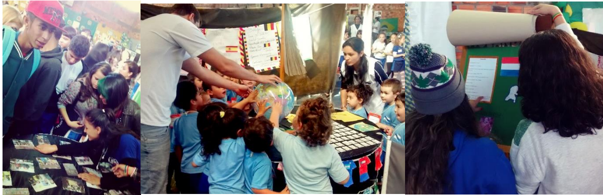
Figura 4. Alunos visitando a exposição de trabalhos da Mostra do PIBID/UEPG.

dentro da Mostra onde eram expostos os trabalhos que foram concretizados com os alunos durante o projeto “Ação Interdisciplinar Copa do Mundo PIBID UEPG”. Os alunos ficaram muito contentes ao se depararem com seus trabalhos sendo expostos para as outras pessoas. Em suma, o evento foi um sucesso.