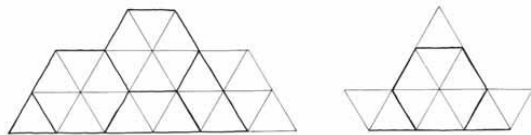
RECORTE DA ESTRUTURA NA MALHA MÓDULO HEXAGONAL