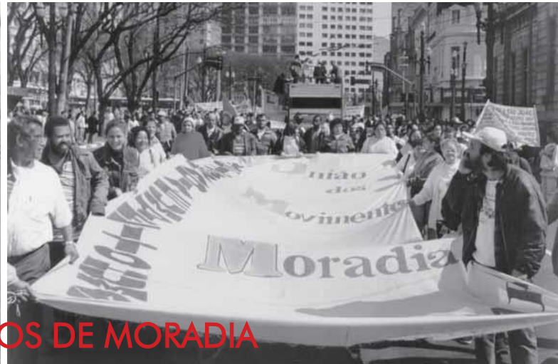
MOVIMIENTOS DE MORADIA