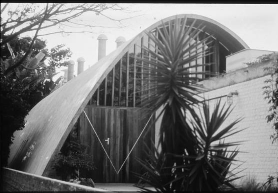
casa pery campos, são paulo, brasil rodrigo lefèvre, 1970. [koury,2003]