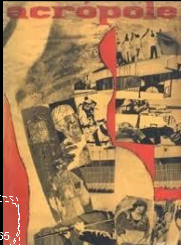
acrópole, nº 319. são paulo, jul. 1965