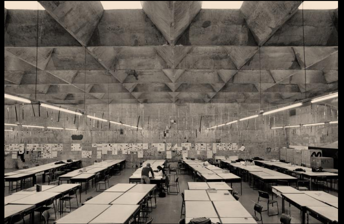
FAU USP Vilanova Artigas 1961