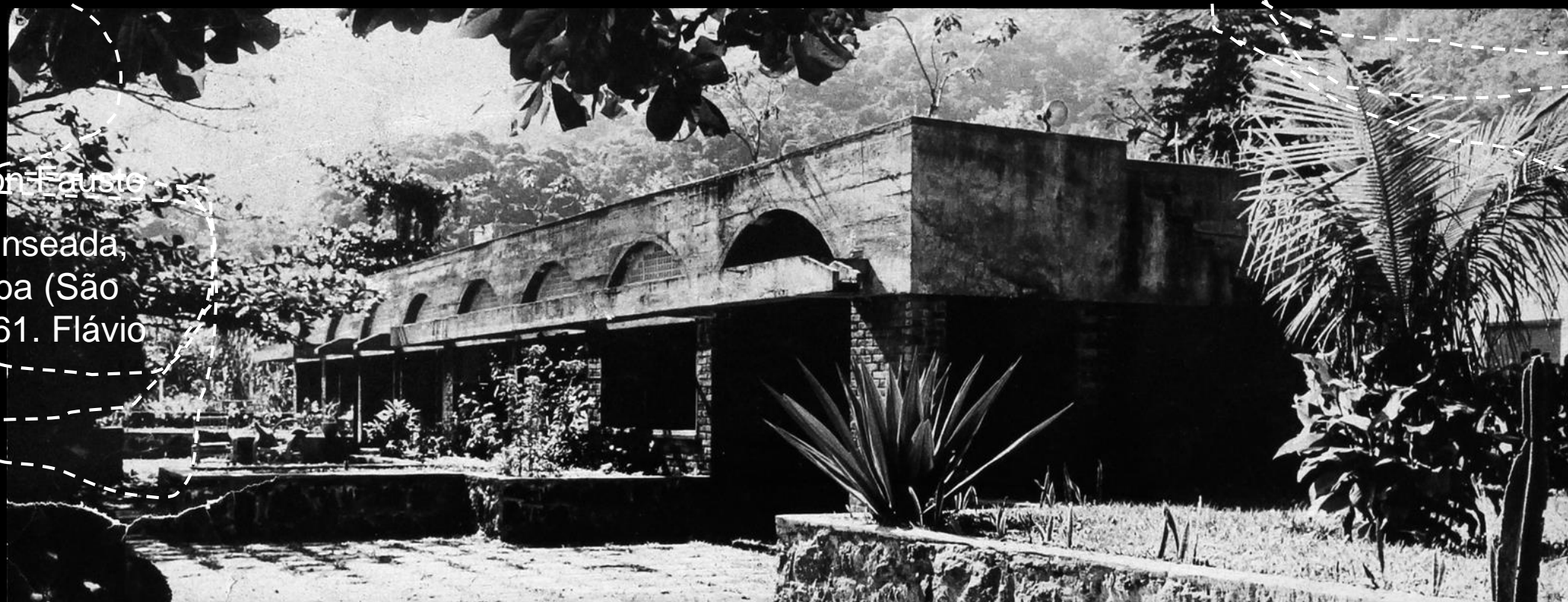
casa Simon Fausto praia da Enseada, em Ubatuba (São Paulo) 1961. Flávio Império.