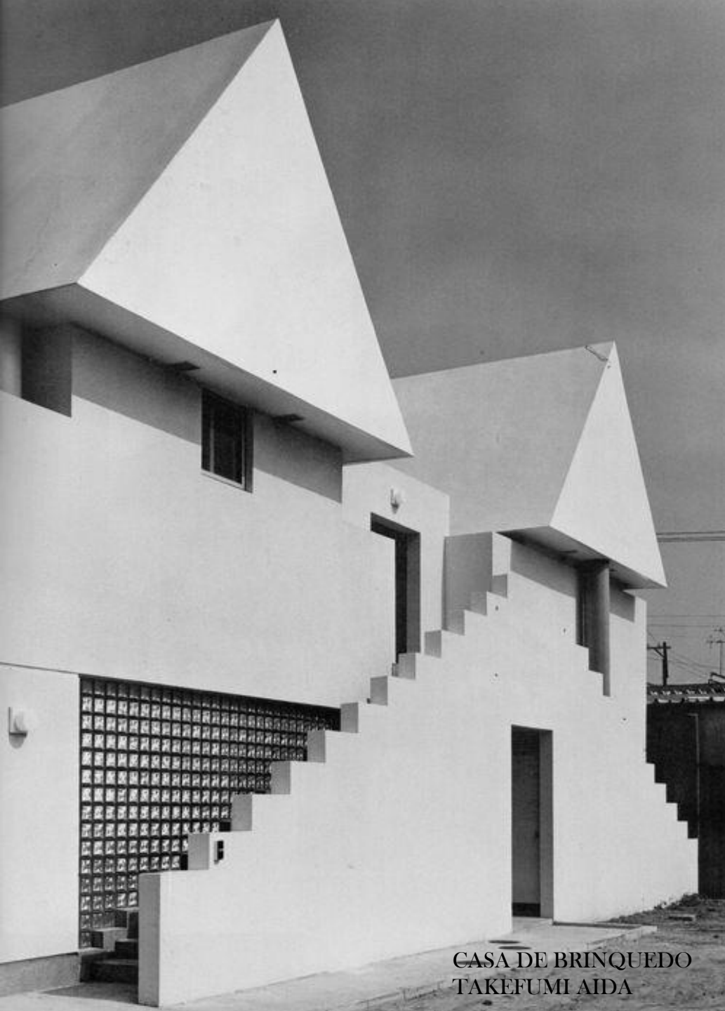
CASA DE BRINQUEDO TAKEFUMI AIDA

UNIVERSIDADE FEDERAL DA INTEGRAÇÃO LATINO- AMERICANA