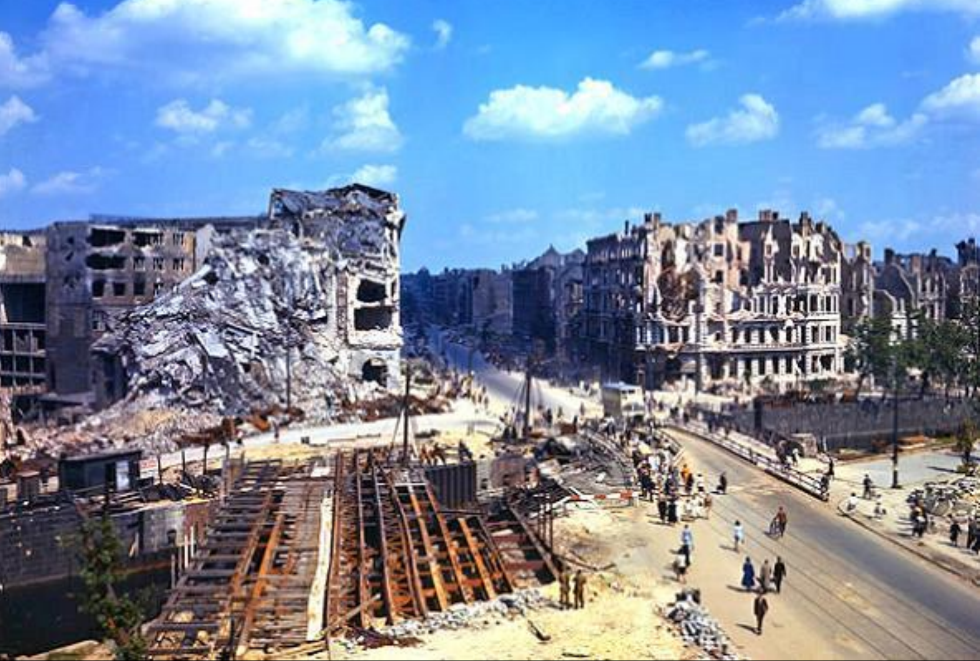
CIDADE DE BERLIM PÓS 2ª GUERRA MUNDIAL