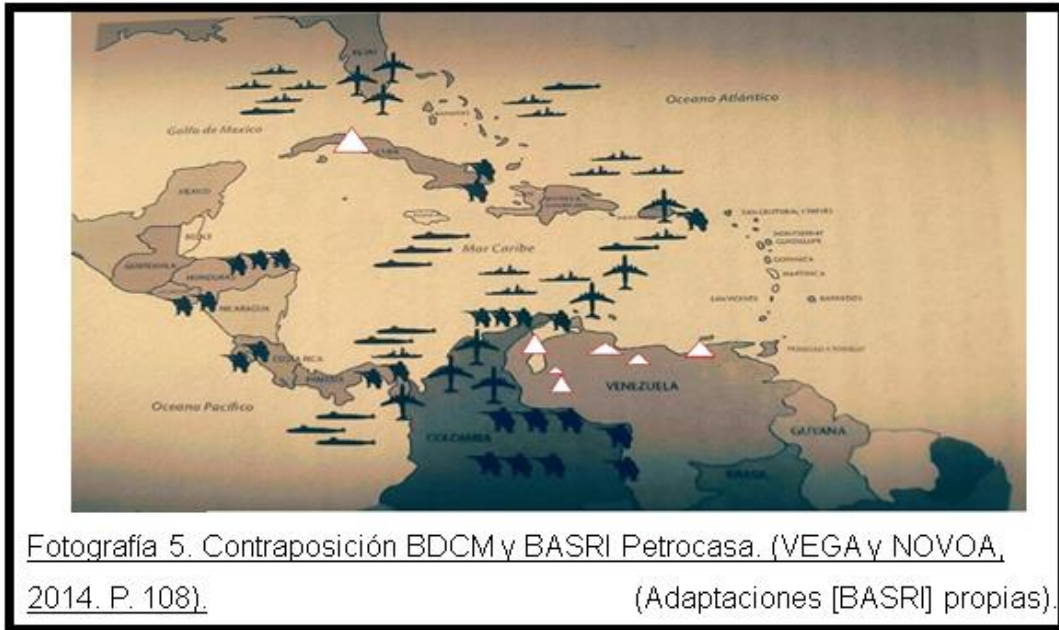
Fotografía 5. Contraposición BDCM y BASRI Petrocasa. (VEGA y NOVOA, 2014. P. 108). (Adaptaciones [BASRI] propias).