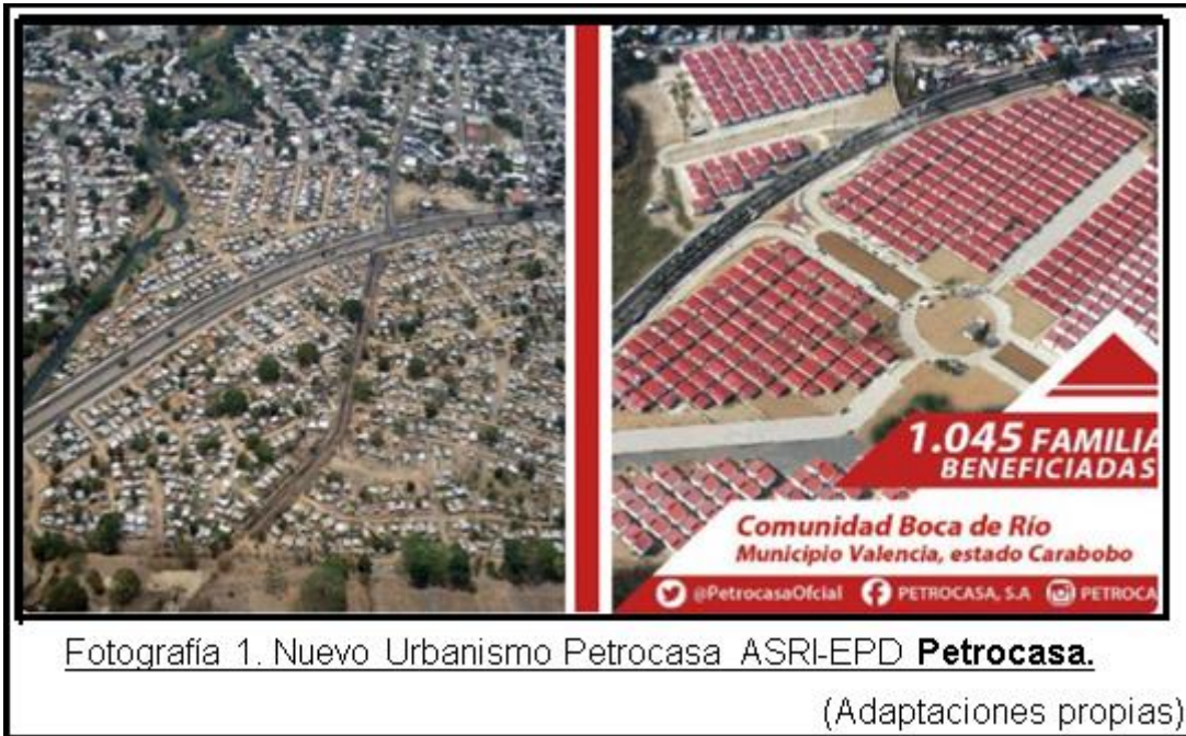
Fotografía 1. Nuevo Urbanismo Petrocasa ASRI-EPD Petrocasa. (Adaptaciones propias)