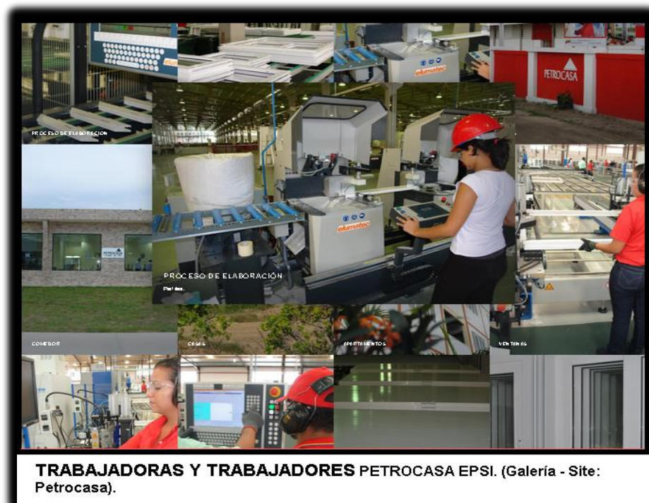
Fotografía 2. Trabajadoras y Trabajadores ASRI-EPSI Petrocasa.