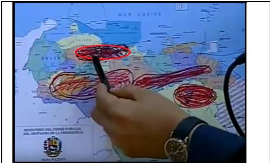
Circulo Rojo GPCT - Gran potencial Petrocaca (SUCRERANDA, 2012. Min. 6:23). Fotografía 7. Presidente Hugo Chávez desde la fábrica de ventanas para viviendas Guacara III, Carabobo. (SUCRERANDA, 2012. Min. 6:23).