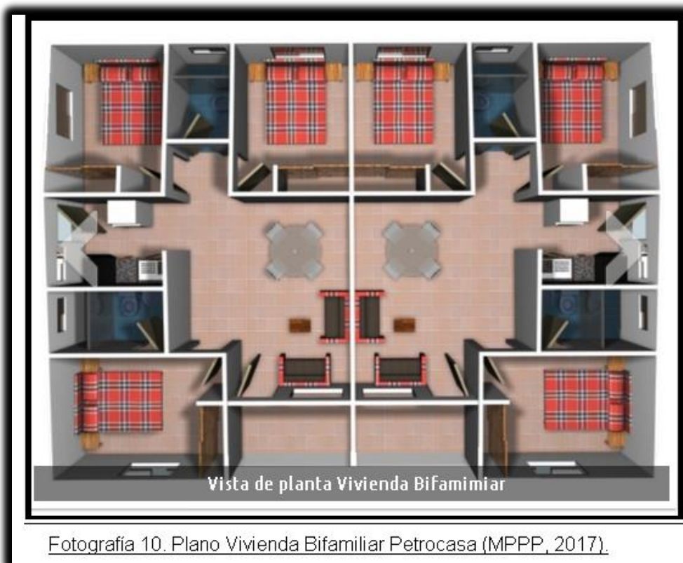
Fotografía 10. Plano Vivienda Bifamiliar Petrocasa (MPPP, 2017).