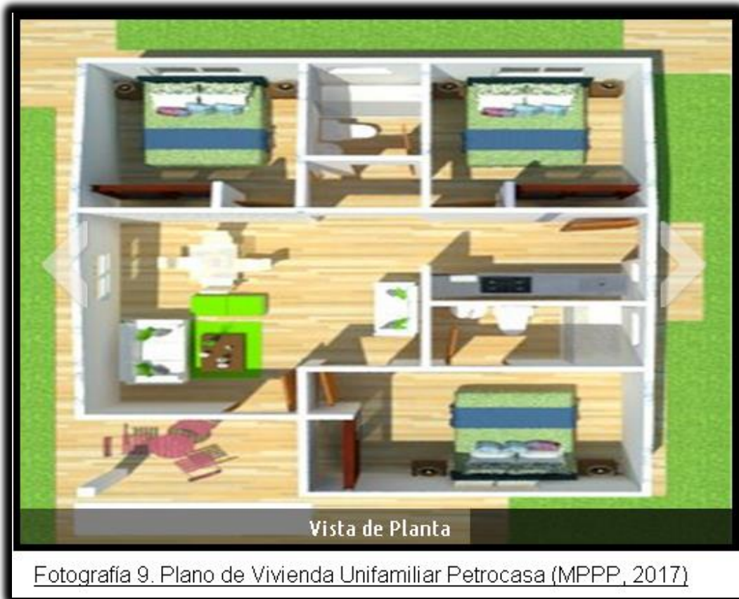
Fotografía 9. Plano de Vivienda Unifamiliar Petrocasa (MPPP, 2017)