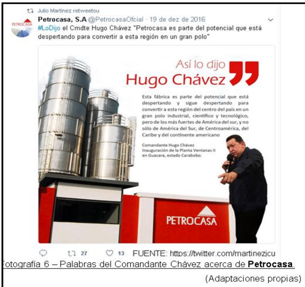
Fotografía 6 – Palabras del Comandante Chávez acerca de Petrocasa . (Adaptaciones propias)