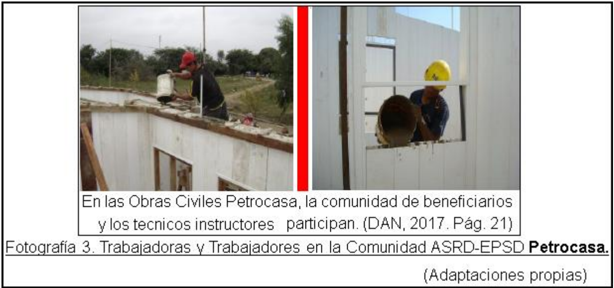
Fotografía 3. Trabajadoras y Trabajadores en la Comunidad ASRD-EPD Petrocasa . (Adaptaciones propias)