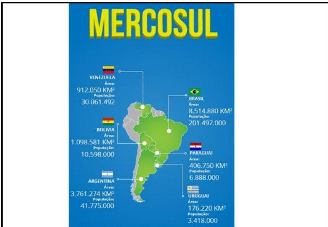
Fotografía 8. Mapa de estimativa poblacional Mercosur. (PORTAL BRASIL, 2015).