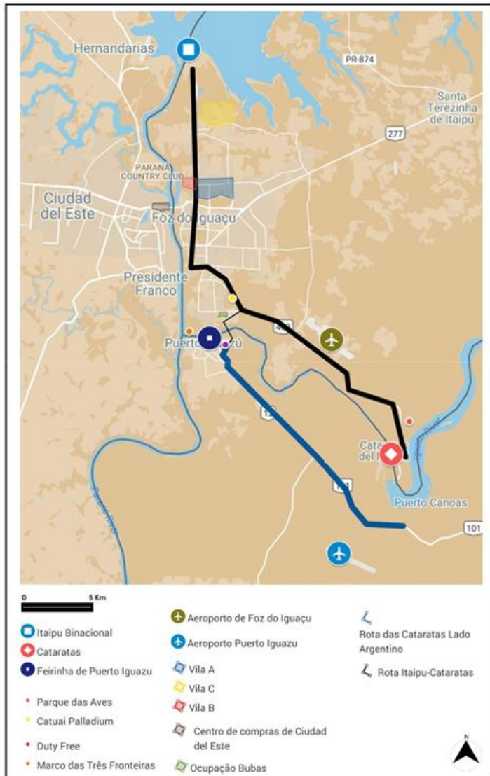
Mapa 1 – Globalização e Fragmentação na Tríplice Fronteira