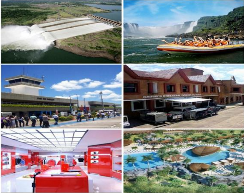
Galeria de Imagens na sequência: Hidrelétrica Binacional de Itaipu; Turista nas Cataratas do Iguaçu; Aeroporto Internacional de Foz do Iguaçu; Aeroporto Internacional de Puerto Iguazú; Boutique da Ferrari em Ciudad del Este; Vista aérea do Hotel Resort Mabu.

Os lugares da globalização da tríplice fronteira impõem uma problemática de difícil resolução e em consonância com o atual processo de mercantilização do espaço, do território, dos lugares. Os locais organizados para atender aos fluxos e negócios globalizados,