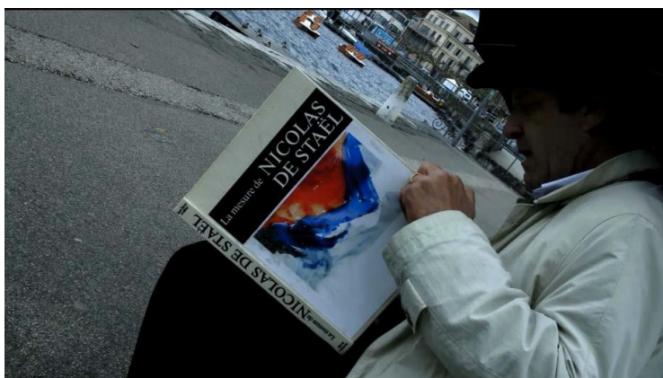
Adeus a Linguagem (2014), Jean-Luc Godard – Fig. 2

Partindo da ideia de que é nos Estados Unidos que se consolidam os pilares universais da linguagem de massa – o starsystem , o cinema de gênero e o primeiro plano, como propostos por Barbero (1987), Godard, nessa nova sequência, ironiza a ida de dois personagens - podendo ser compreendidos como uma alusão a própria linguagem - para as Américas. Em quadro, temos um senhor lendo um livro sobre Nicolas de Stael (Fig. 2). Dois jovens chegam apressados, no enquadramento não conseguimos ver rostos. O rapaz diz para o homem: “Viemos lhe dizer adeus”. O homem, sem tirar o olhar do livro responde: “Irão as Américas?” A câmera se move e agora vemos as faces felizes dos dois. O jovem responde: “Sim. Sr. Davison”. O homem então pergunta: “Vocês tem gibis?” O jovem com um olhar confiante responde: “Tenho um pouco de filosofia”. Sr Davison então retruca: “Explicará a filosofia”. E o jovem responde de pronto: “A filosofia”. Então temos um corte brusco para a cena seguinte.