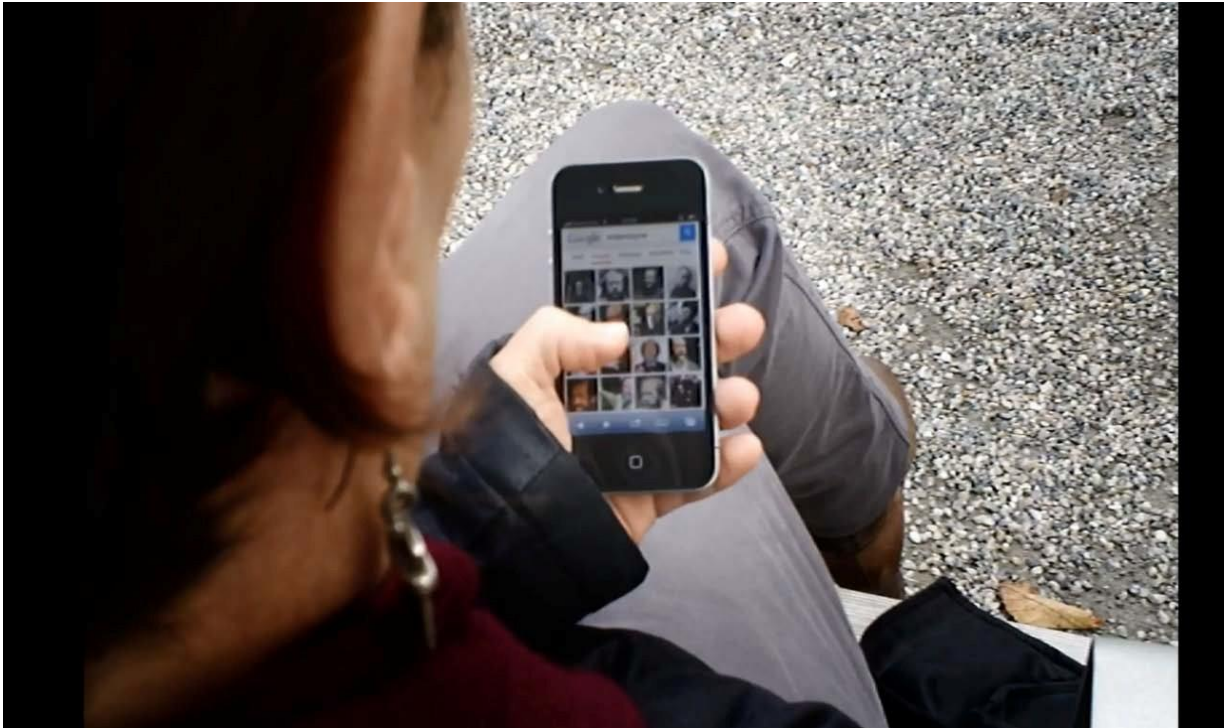
Adeus a Linguagem (2014), Jean-Luc Godard – Fig. 1

Na sequência descrita acima, já nos deparamos com algumas questões que serão trabalhadas ao longo do filme; mídias digitais, literatura – a base de todo trabalho de Godard, progresso tecnológico dos meios, entre outras problemáticas que vamos relacionar a seguir no texto.