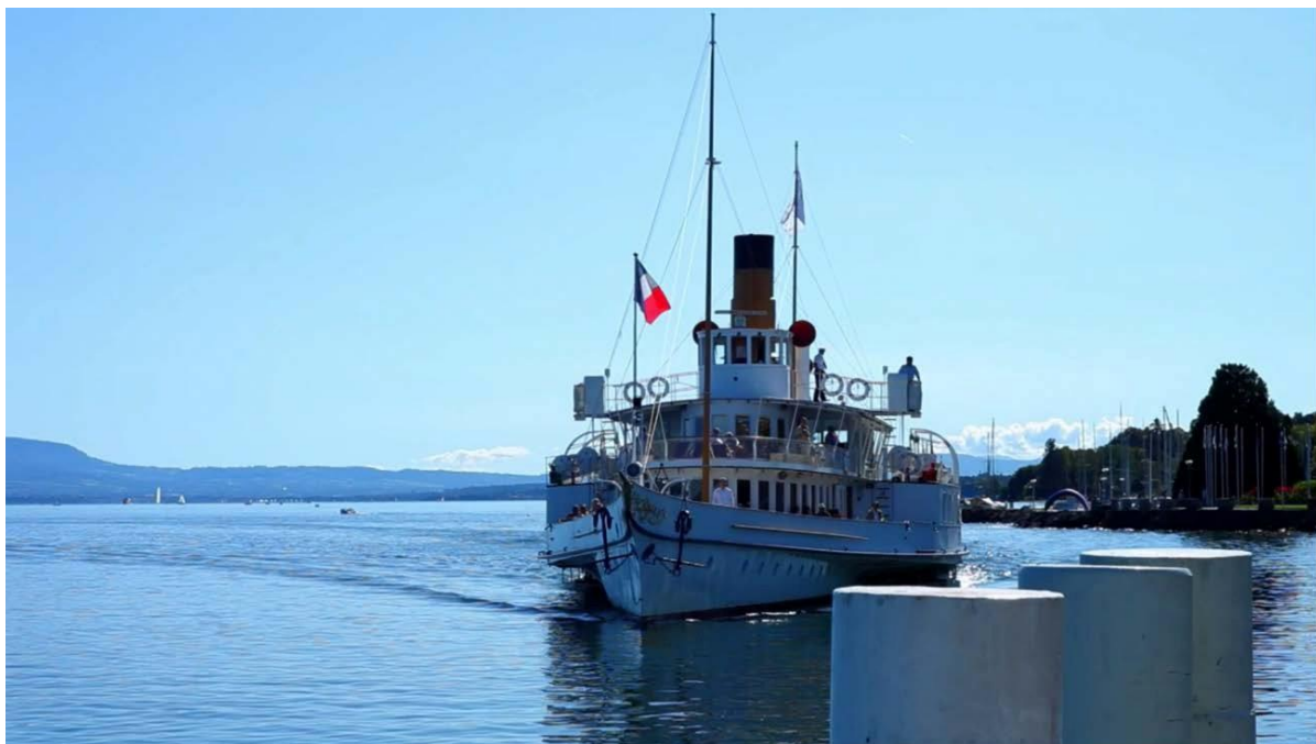
Adeus a Linguagem (2014), Jean-Luc Godard (Fig.4)

Entretanto, podemos constatar que o filme dialoga somente com um grupo seleto de pessoas que parecem já compreendê-la, ficando a crítica restrita a uma "norma culta" onde um modelo que não alcança a cultura popular, e de acordo com Babero não pode ser "absorvido" e torna-se de massa, está criticando tais modelos de linguagem e suas culturas vigentes. Esse é um embate travado em outros momentos históricos, inclusive dentro das escolas cinematográficas como a nouvelle vague - onde o próprio expoente é Godard. No entanto, podemos ampliar o cosmos de visão para os estudos culturais em geral e pensar na amplitude das discussões acerca da linguagem cinematográfica, das comunicações, das mídias e do digital, e como propõe Godard, do assassinato da linguagem, ou como podemos colocar, do nascimento de uma nova linguagem.