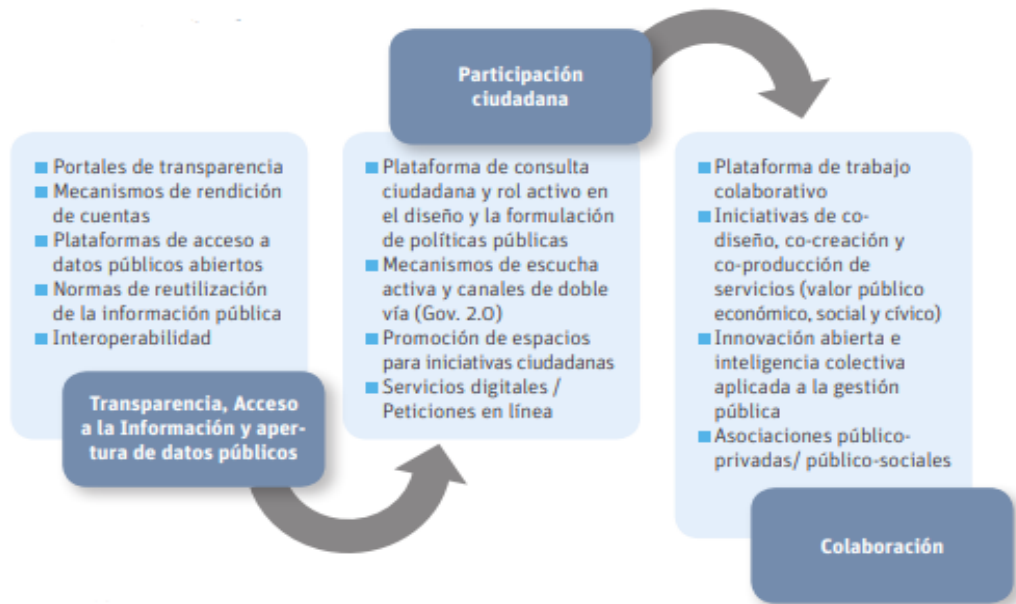
Figura 1 - Los principios del gobierno abierto en acción