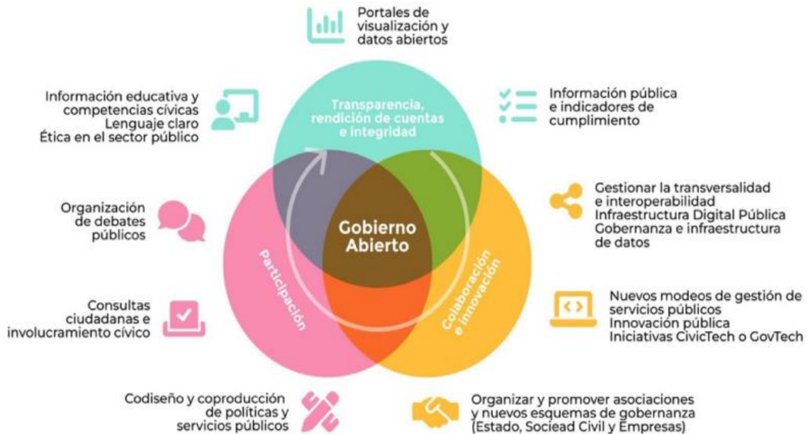
Figura 2 - Enfoque de Gobierno Abierto