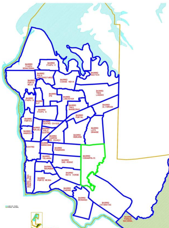
Figura 1. MAPA GERAL ESPACIALIZAÇÃO DOS LIMITES DE BAIRROS DE FOZ DO IGUAÇU.