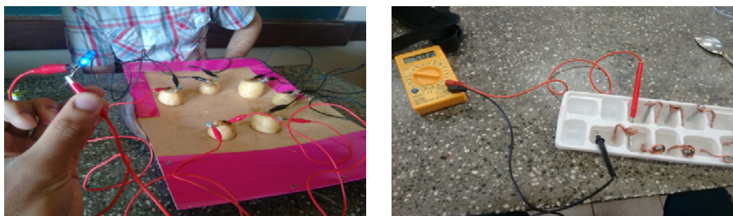
Figura 2: Experimentos: pilha de batatas e pilha de forminha de gelo.

prática os princípios que regem a eletroquímica, tais como os elementos, compostos e as reações químicas presentes ali, os conceitos de cátodo, ânodo, eletrólito, condutor e diferença de potencial. Dentre os experimentos realizados estão a pilha de batatas, a pilha de limões, a pilha de forminha de gelo, a pilha de latinha de alumínio, dentre outros.