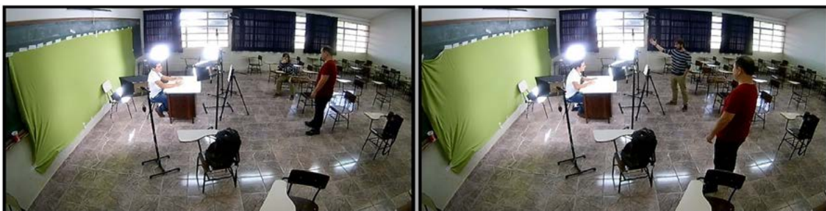
Figura 2: Disposição dos cinco refletores confeccionados a partir de materiais de baixo custo.

com animações em power-point , em flash , vídeos, entre outros. Nossa opção foi utilizar ilustrações e esquemas feitos em folhas de sulfite A4 e lápis coloridos, objetivando-se o mínimo de gastos. Nesse caso, o principal fator a ser considerado é que haja boa iluminação sobre a folha e que o papel seja colocado sempre na mesma posição. Para isso pode-se fazer marcações sobre a superfície, por exemplo. No presente projeto, pretendeu-se a criação de uma vídeo-aula sobre conceitos básicos de bioquímica e estrutura de átomos e moléculas. Na figura 4, são mostradas duas ilustrações feitas pelo próprio discente.