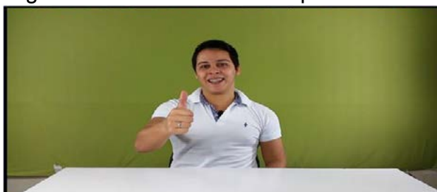
Figura 3: Posicionamento do pano de fundo.