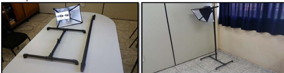
Figura 1: À esquerda, canos de PVC para confecção da base dos refletores. Refletores montados com papelão, papel alumínio e dois bocais. À direita, um refletor pronto.

refletores alternativos, com os seguintes materiais: papel alumínio, canos de PVC, papelão, cola quente, fio elétrico, bocais e lâmpadas. Os refletores têm aproximadamente 1,70m e contém espaço para até duas lâmpadas. A necessidade da iluminação deve ser verificada pelos participantes e depende do local a ser utilizado para as gravações. Abaixo seguem imagens dos refletores confeccionados.