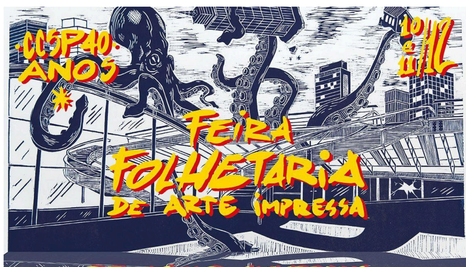
Cartaz da 5ª Feira Folhetaria de Arte Impressa, do ano de 2022

Essa problemática me faz lembrar de um lugar que conheci em São Paulo e que propiciava aquilo que eu acredito, que é o acesso livre aos meios de se produzir arte. Esse espaço é o Ateliê Folhetaria, localizado no Centro Cultural de São Paulo. Nele estão disponíveis de maneira pública e gratuita equipamentos para impressão gráfica artesanal, por meio das técnicas serigrafia, xilogravura e litogravura. Esse espaço é uma das maiores inspirações para o Ateliê Aberto de Arte Têxtil, já que nele diversos artistas visuais da cidade produzem suas criações, o que gera por exemplo eventos como a Feira Folhetaria de Arte Impressa 1 , que terá sua sexta edição agora no ano de 2025.