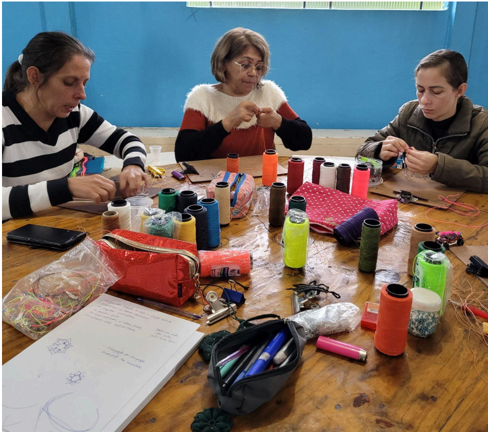
Oficina de Joalheria em Macramê realizada no Clube de Mães Estrela da Manhã - Maio de 2023

podem participar efetivamente para a conquista de direitos.” (Santiago, Oliveira e Andrade, 2009, p. 3). Eles funcionam até hoje gerenciado pelas mulheres dos bairros e com apoio das prefeituras ou outras instituições. Em Foz do Iguaçu os Clubes são coordenados pela Secretaria da Mulher (antes sendo pasta da recém extinta Secretaria de Direitos Humanos), onde a secretaria disponibiliza alguns materiais para a realização de oficinas de artesanato.