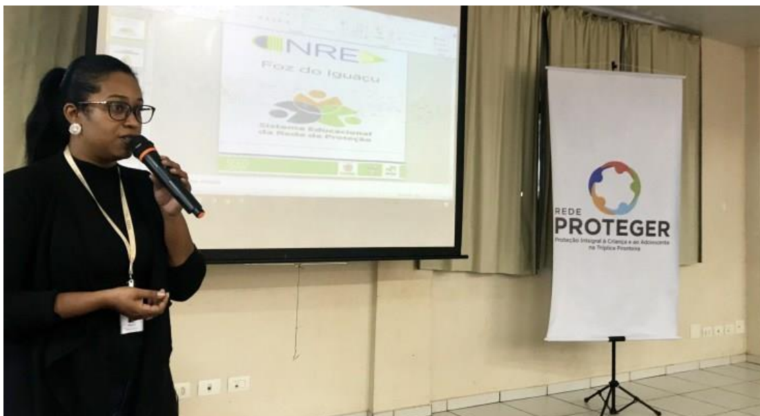
Figura 3: Rede PROTEGER entra na luta contra a evasão escolar em Foz do Iguaçu

Conforme o Protocolo de Atendimento à Criança e ao Adolescente Vítima de Violência do Município de Foz do Iguaçu (2016), a REDE PROTEGER destaca “a importância da construção e a execução de fluxogramas, um dos objetivos deste documento, demonstrando efetivamente um trabalho de rede.”