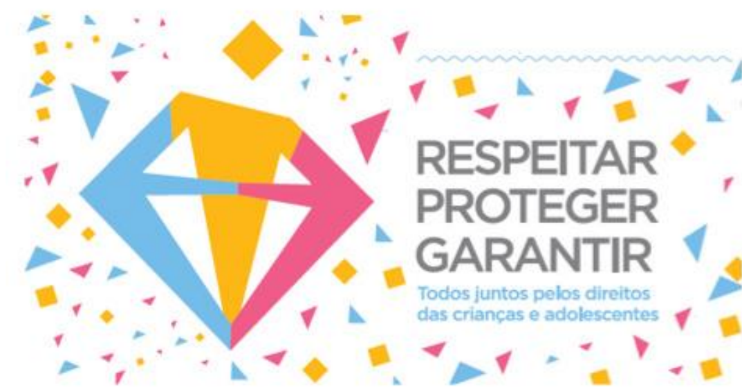
Figura 2: No carnaval, Itaipu integra Campanha de Proteção a Crianças e Adolescentes