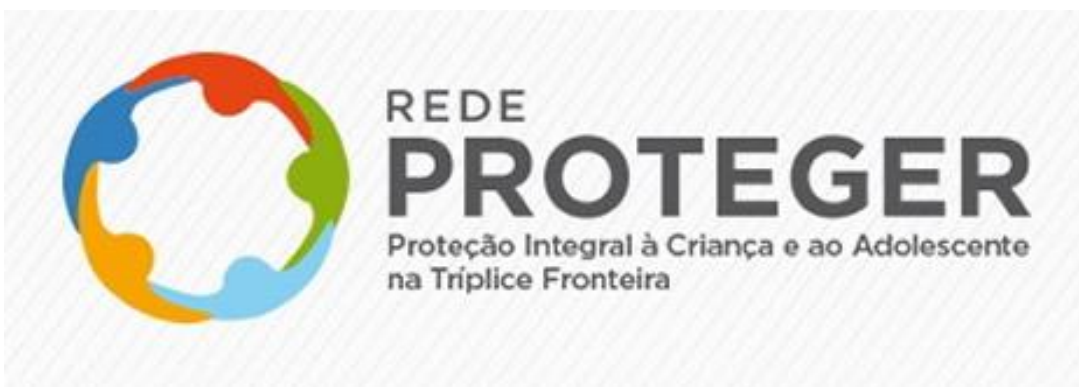
Figura 1: Logotipo da REDE PROTEGER