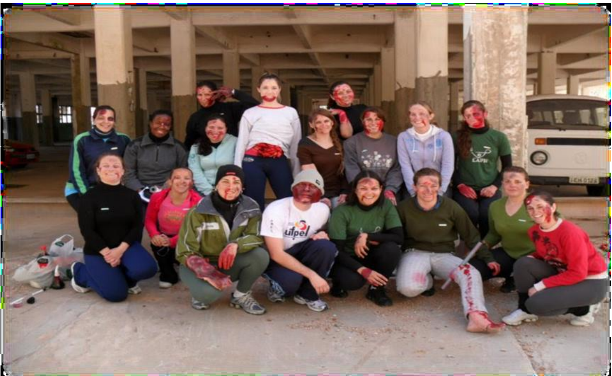
Figura 02 – Simulado Realizado pelo Projeto