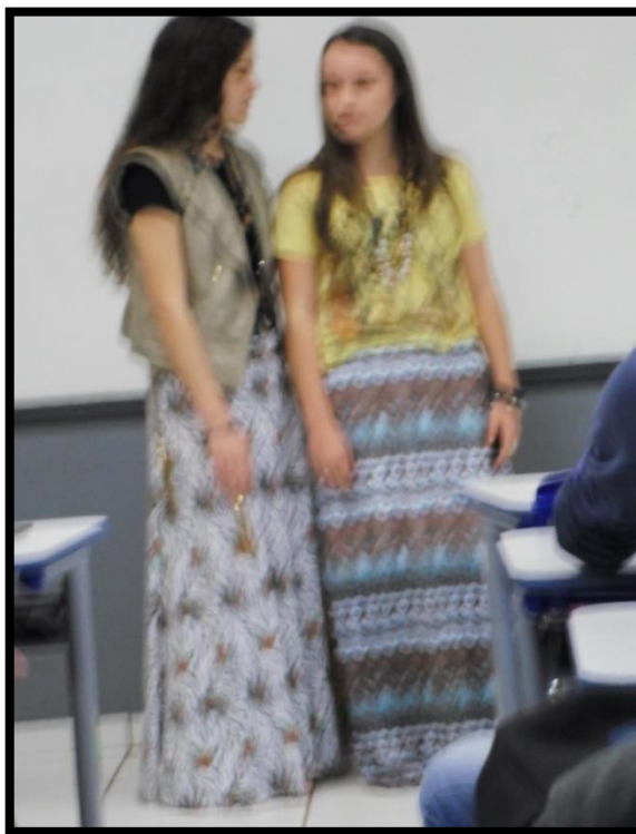
Figura 18- Apresentação das Tribos Urbanas – Híppies