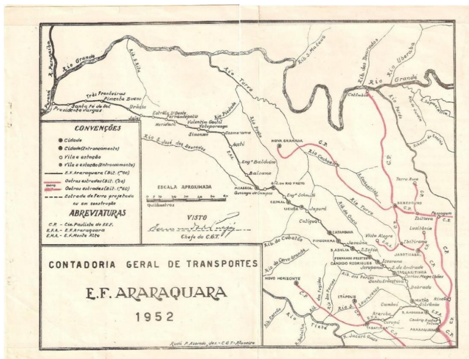
Figura 1 - Mapa da malha ferroviária do estado de São Paulo em 1952, destacando a linha tronco da EFA. 2

(...) povoamento e o domínio do território brasileiro, idealizadas a partir da comunicação entre o estado do Mato Grosso (divisa entre países como Paraguai e Bolívia e que atualmente representa o território pertencente ao estado do Mato Grosso do Sul) e o litoral brasileiro. Além das intenções presentes na defesa e prolongamento do território, essa região representava ao território sul-americano, importante área de acesso ao Oceano Atlântico, realizado a partir da navegação da Bacia Cisplatina. (SCHIAVON, 2016, p. 195)