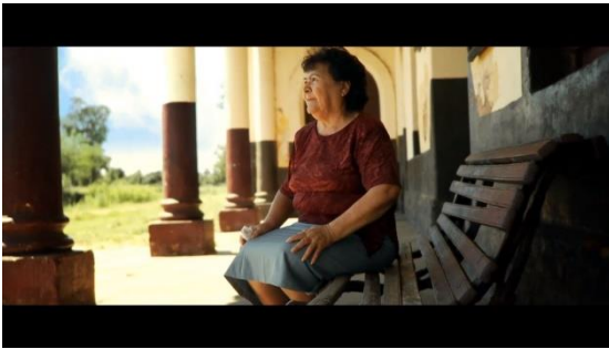
Figura 7 - Quadro com imagens capturadas da projeção de visionamento da obra "Tren Paraguay". 12