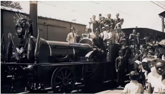
Figura 8 - Quadro de imagens capturadas a partir do visionamento da obra "Memórias da EFA". 13