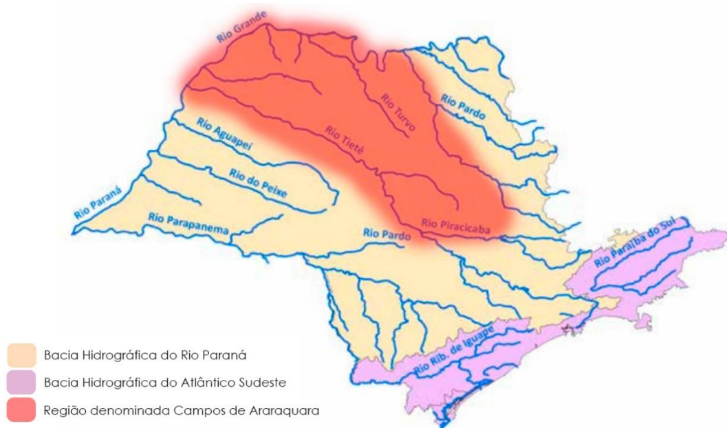
Figura 5 - Mapa adaptado pelo autor com informações retiradas de "Os campos de Araraquara: um estudo de história indígena no interior paulista" de Marcel Mano, p. 12, onde é destacada a região denominada "Campos de Araraquara". 6

Portanto, havia diversos interesses que permeavam os anseios de enveredar com ocupações, povoamento e infraestrutura essa região, sendo conveniente ao Império do Brasil, conectar a linha férrea da Companhia Rio-Clarensense de Estradas de Ferro a capital Mato-grossense, após o fim das batalhas contra o Paraguai, em 1870, pois ficou evidente a fragilidade quanto a logística, acesso e manutenção das fronteiras desse estado.