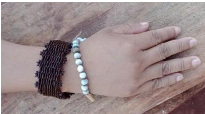
Fotografia 13: Jyvaregua

JYVAREGUA (pulseira) e a proteção de algo ruim podem ser pego através de toques nos objetos, nos animais entre outras. Também é usado como adereço de dependendo dos tipos de pulseiras feitas.