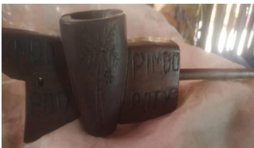
Fotografia 17: Petyngua

PETYNGUA (Cachimbo) extremamente sagrada como outros instrumentos, e utilizado principalmente pelos líderes espirituais, e também pelo yvyra'ira'ija , Takua jary , xondaro terã xondaria kuery . Essas são pessoas auxiliares, ou aprendiz dos rezadores que acompanha as passoaas do Chamõi kuera . No cachimbo é utilizado ervas medicinais secos com pequena quantidade de fumo dependendo de quem vai usar. Se for criança somente ervas. A fumaça afasta o espírito do mau ( jaecha yva ) que fica ao redor da pessoa, do espaço, ou da casa. Também diminui dores que as pessoas sentem fisicamente ou está atualmente.