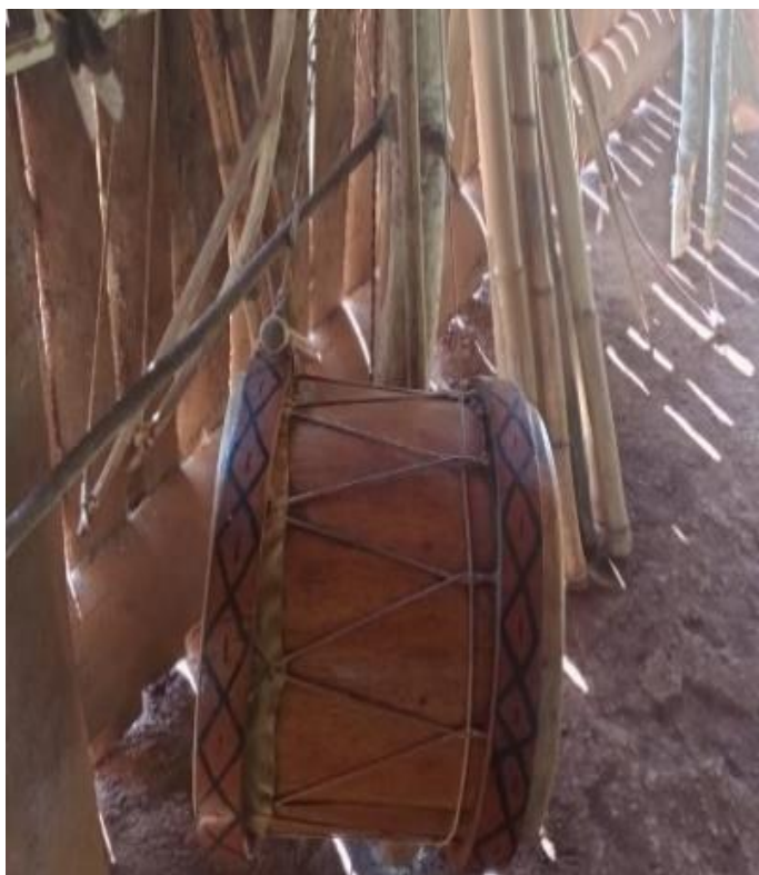
Fotografia 10: Angu'a Pu

ANGU'A PU (tambor) e conectado de som de chocalhos e takua pu acompanha os ritmos, dependendo do momento de cerimônias religiosas e como uma forma de chamar as pessoas para reunião, crianças na casa de reza. Pode ser usado pelos homens tanto pelas mulheres de dependendo das habilidades e seguir os ritmos do som de outros instrumentos.