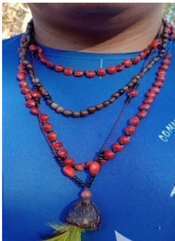
Fotografia 11: Akãnguaa

MBO'Y ÑANEMBA'EVA (colar de semente de árvores, de plantas, raiz de árvores, ossos de animais, ou dente de animais) e utilizada como forma identidade pelo guarani, como antigamente não existiam esse tal de registro que comprova quem é a pessoa se usada como identidade para atravessar as fronteiras por exemplos. Hoje em dia ainda é muito usado como identidade, acessório e para proteção de engasgamento de alimentação não saudáveis