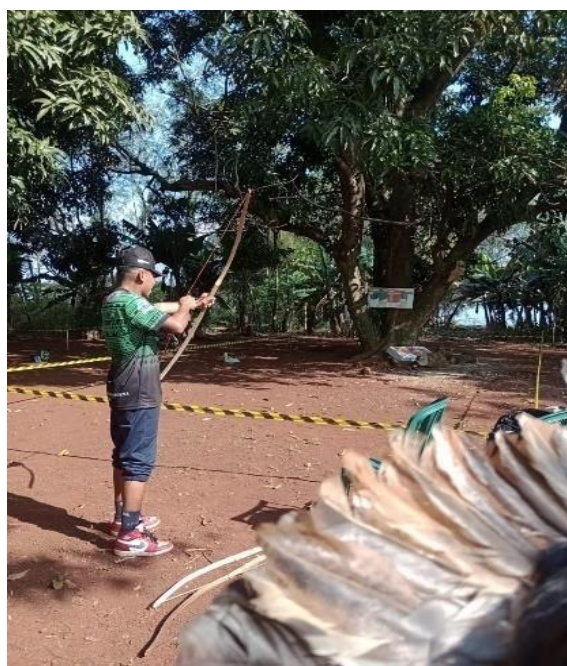
Fotografia 24: Jogo de arco e flecha.

O Arco e flecha ( hy'y guyrapa ) é um jogo individual, aberto somente para jovens e adultos, pois exige a prática, concentração e habilidade. A competição é por pontuação, o alvo é numerados por cores de corpo de desenho de animais capivara. O maior ponto é o olho da capivara com 100 pontos. Se houver empate, os jogadores competem por 1º e 2º lugar. O arco e flecha são confeitados pelos artesãos da comunidade.