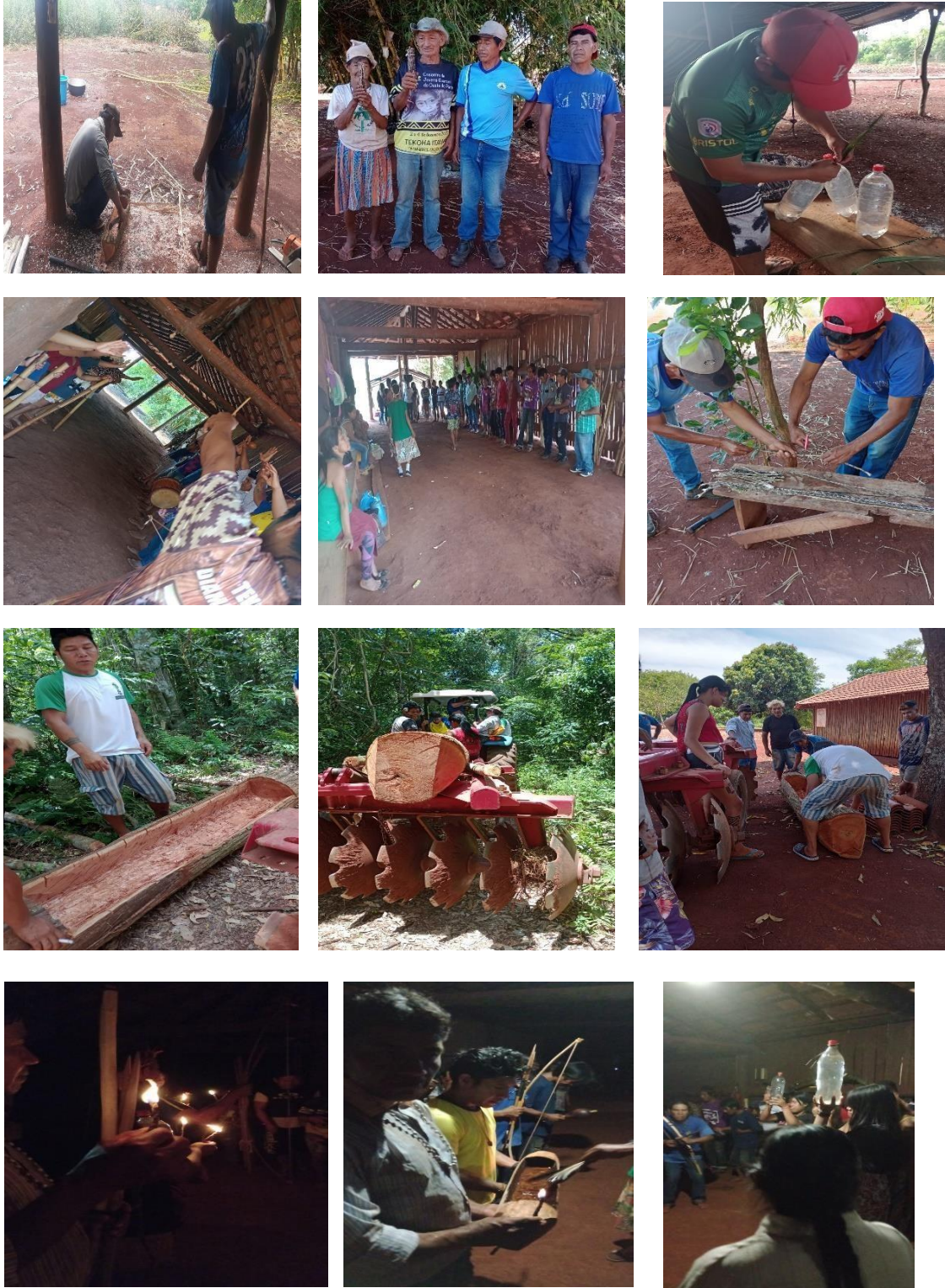
Fotografia 20: Algumas imagens registradas durante a preparação da cerimônia ( tata pyahu ).

Seguem algumas imagens registradas durante a preparação da cerimônia ( tata pyahu ).