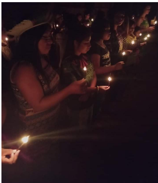
Fotografia 1: Ñemongarai , realizado no ano de 2023 na Tekohá Ocoy, em São Miguel do Iguaçu, Paraná.