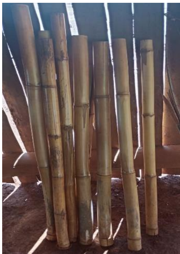
Fotografia 8: Takua Pu Fonte: a autora, 2024.

TAKUA PU (instrumento feito de bambu sagrado) somente as mulheres pode tocar nos momentos cerimoniais ( takua oguero porai reve oguerojapychaka kuñangue'i ). Através do canto e conexão som da takua pu entre som do chocalho e aumenta sua fé ao (Ñanderu) Deus. Durante a cerimônia espiritual as mulheres ficam totalmente conectadas entre elas através do ( Mborai ha takua pu rupive ) do som de takua pu e canto com mesmo ritmo de tocar.