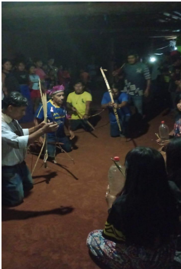
Fotografia 2: Ñhemongarai, realizado no ano de 2022 na Tekohá Ocoy, em São Miguel do Iguçu, Paraná.

no chão de forma reta ( takuapu ). Jerokyete'i jave- oguerojapysaka- durante a dança todos os participantes seguem o movimento e os passos ( mborai oupiva'e-ojeroky'iva'e ) do rezador que lidera a dança cerimonial.