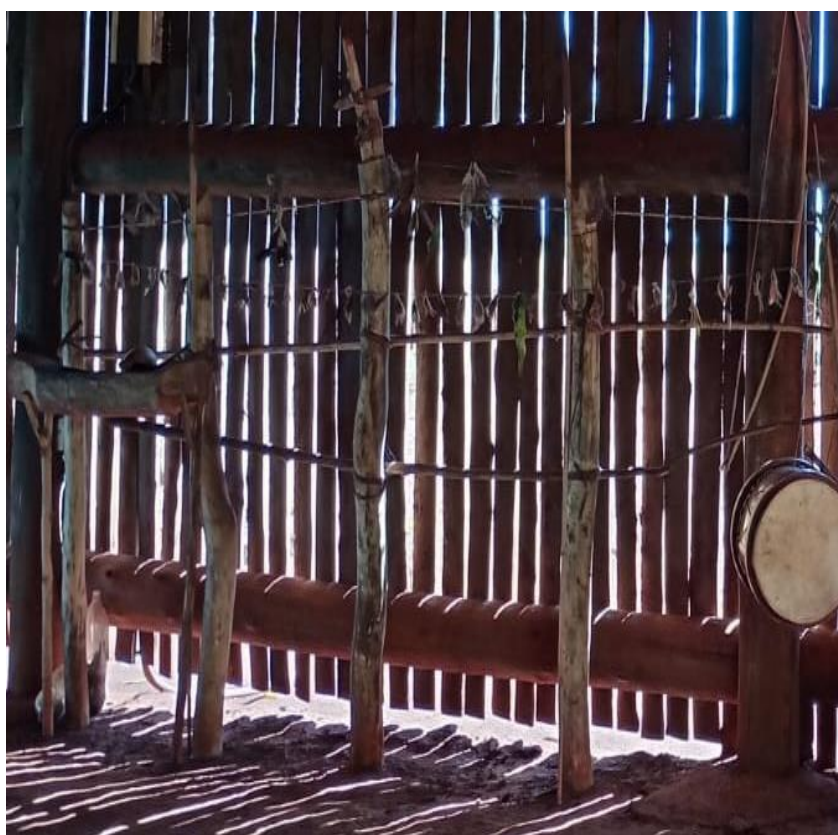
Fotografia 16: Amba'i