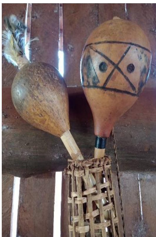
Fotografia 7: Mbaraka Miri

MBARAKA MIRÎ (chocalho) tem uma função poderoso de nos conectar entre os rezadores, e troca de informações espirituais entre rezador com Deus, através desses instrumentos ( chamõï ) recebe avisos de algo imprevisto que pode acontecer na comunidade, ou na comunidade vizinho, para isso todos os instrumentos precisam estejam conectados para que o rezador consiga obter informações através do seu sonho ( oguerojapychaka rire ). Na cultura Ava guarani, o chocalho somente homem pode utilizar.