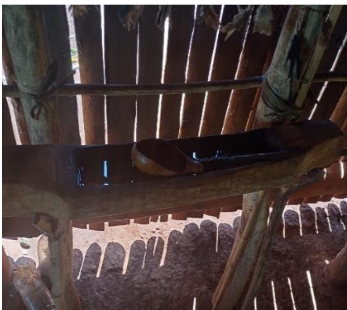
Fotografia 14: YVYRA ÑA'Ë'I Fonte: a autora, 2024.

YVYRA ÑA'Ë'I (objetos de colocar líquidos de cedros) esse objeto e feito de cerne de cedro com buraco retangular o suficiente para caber um litro de água benta de cedro. Esse líquido e passado na pessoa que está doente, nas participantes das cerimoniaas sagradas, nas sementes batizadas, nas colheitas, tantos nas bebidas sagradas como uma forma de abençoar. ( ombo'y sapy omboykeavã opamba'e vai ).