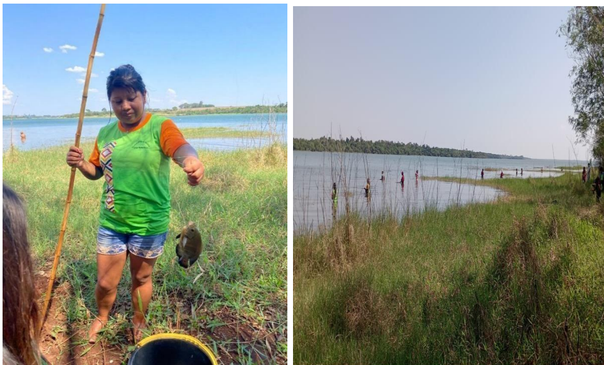
Fotografia 22: Pescaria nos jogos indígenas.

A modalidade de pescaria ( pira jekutu ) é um jogo competitivo realizado em grupo ou individual, se for em grupo ganha com a maior quantidade de peixe, e individual por tamanhos.