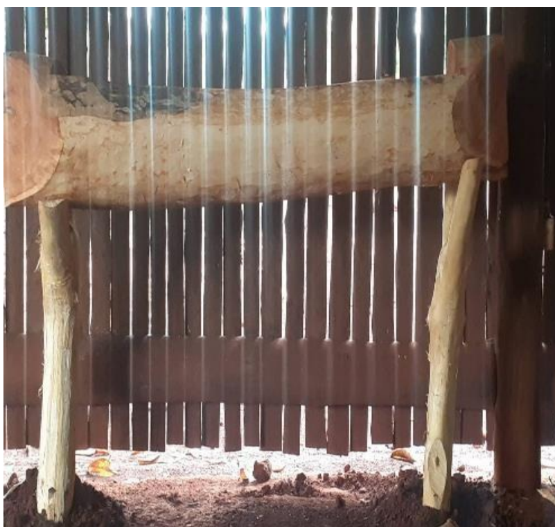
Fotografía 15: YVYRA ÑA'Ë GUASU

YVYRA ÑA'Ë GUASU (Objeto de colocar a bebidas sagradas) ( kavi ) esse objeto é feita de madeira de cedro mais antigo da comunidade, também possui um buraco retangular o suficiente para caber dez a quinze litros de bebida sagradas. Para retirada dessa madeira os rezadores ( oguerojapychaka mboapygue jasygue ) pedem licença espiritualmente durante três meses para mãe natureza para que essa árvore seja derrubado no dia cerimônia ( amba'i ñembopyahu ) renovação de altar sagrados da casa de reza, ou seja, todos os instrumentos sagrados serão renovados, nessa data também é renovado o espírito da comunidade