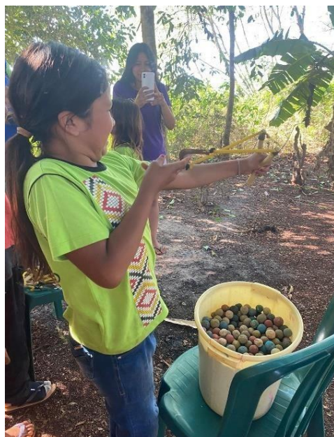
Fotografia 23: Estilingue nos jogos indígenas.