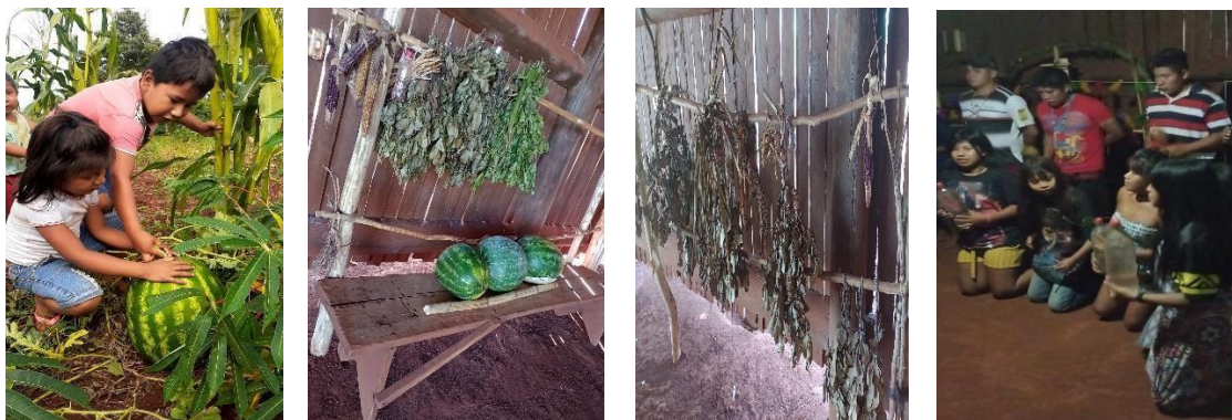
Fotografia 18: Fotos da vivência na comunidade. Durante a noite a comunidade fica rezando com muitas danças tomando suas bebidas sagradas.