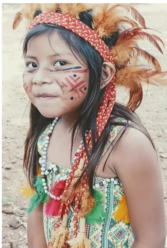
Fotografia 9: Akānguaa

AKĀNGUAA (cocar) na cultura indígena apresenta da identidade de cada etnia. Especial na cultura Ava guarani os líderes espirituais utilizam para se proteger dos ( jaecha"ỹ va'e ) espíritos malignos, também quando está no momento de verificar o corpo de paciente espiritualmente através da conexão do cocar localizar, ou identificar mais rápido o que está sentindo, ou onde está sentindo a dor, dependendo de forma de cocar as lideranças também pode usar como identidade, e como proteção. Na hora da cerimônia religiosa qualquer um pode usar desde que respeita a cerimônia.