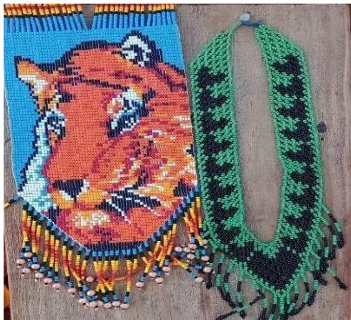
Fotografia 12: Mbo'y Opaichagua

MBO'Y OPAICHAGUA (colar de missanga artificiais) geralmente é feita pela artesã da comunidade como adereços, a também como identidade. Através de sua criatividade muitas representam os animais que já estão em extinção, ou animais presente em sua região, também de expor o seu grafismo. Hoje em dia também é uma fonte de renda da comunidade.