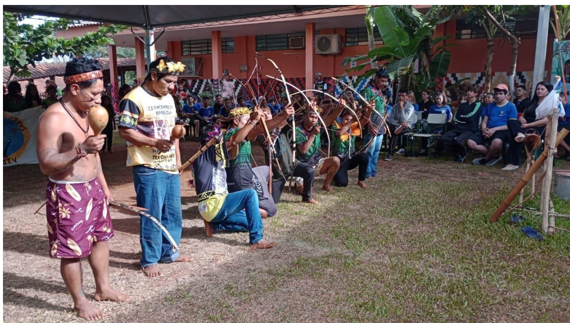
Fotografia 3: Ñemoinchi , realizado na semana cultural em abril de 2023 na Tekohá Ocoy, em São Miguel do Iguazu, Paraná.

Ñemoinchi é uma dança praticada na casa de reza para preparação do corpo físico e mental. Os participantes são de todas as idades, porém devem ter as práticas e a preparação na dança; se for a primeira vez, participam de dança mais leve. A dança segue a melodia e ritmos do yvyra'ija com obstáculos de equilíbrios trabalhando noções lógicas, concentração e habilidades. A prática de dança traz os benefícios ñande rete piro'y , corpo leve e saudável com harmonia da espiritualidade. Pois através do suor saem todos os problemas trazidos pelos alimentos não saudáveis, bem como tranquiliza a mente e purifica o corpo.