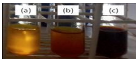
Figura 1 – Representação das preparações do indicador ácido-base contendo açafrão em solução. O indicador foi adicionado as soluções de pH 3, 11 e 13.

De acordo com a estrutura da curcumina (I, princípio ativo do açafrão), três prótons podem ser removidos com a adição de íons hidroxila. A adição de um equivalente de íons OH - provoca a mudança de cor da curcumina de amarelo para laranja (II) devido à abstração do próton da hidroxila ligada ao carbono β à carbonila (pH próximo de 11). Com a abstração deste próton forma-se um íon enolato (de cor laranja), relativamente estável, devido à ressonância das ligações π da estrutura. A adição de mais dois equivalentes de íons OH - provocam a abstração dos dois prótons fenólicos originando a estrutura III altamente conjugada e de coloração vermelha. Conseqüentemente, para aplicações em experimentos, aconselha-se o uso de apenas uma solução ácida e uma fortemente básica (pH acima de 12).