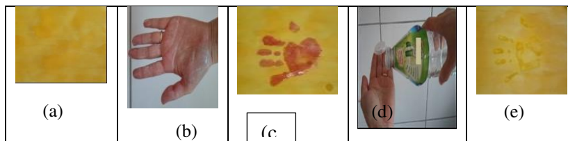
Figura 3 – Problematização do experimento com indicadores ácidos-bases, sendo: (a) folha de papel pintada com solução de açafrão em álcool etílico; (b) presença de sabão (íons hidróxido) em pedra sobre uma das mãos; (c) resultado da sobreposição da mão, contendo sabão, sobre o papel com o indicador de açafrão; (d) presença de