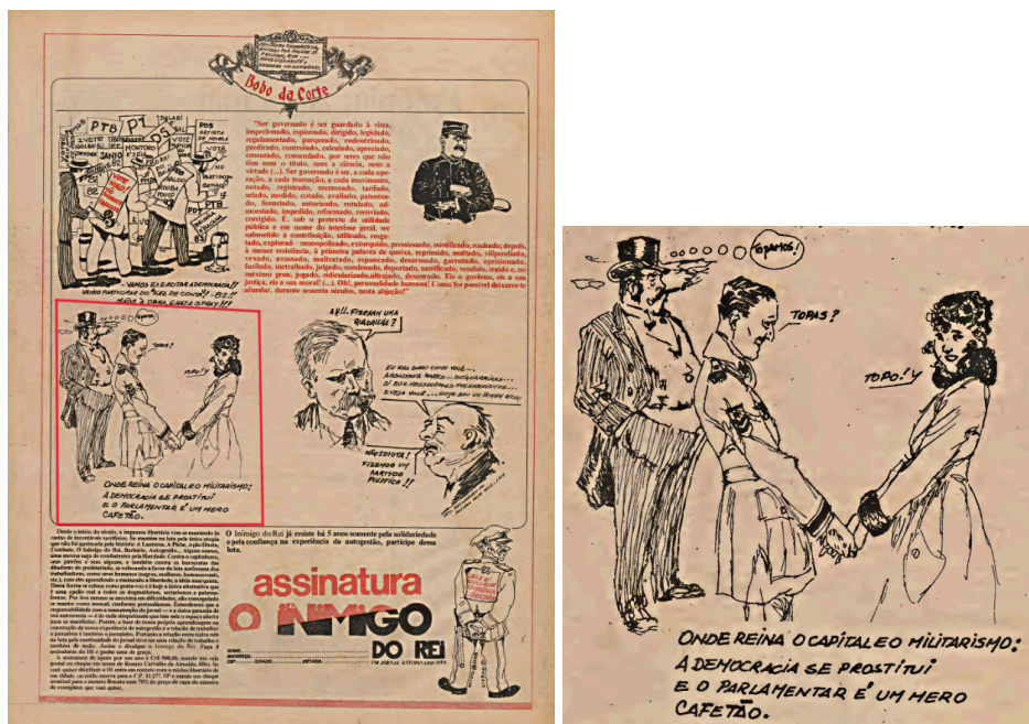
Imagem 3: O Inimigo do Rei, N.15, contracapa.

Assim, o jornal afirmava que o indígena não era apenas vítima de violência direta, mas sim de um processo de apagamento. Ao colocar lado a lado o latifúndio, o bóia-fria e o indígena, o jornal desmascarava a máquina de exclusão operada pelo capitalismo em território brasileiro, uma crítica profunda à política indigenista e à falsa neutralidade dos órgãos oficiais.