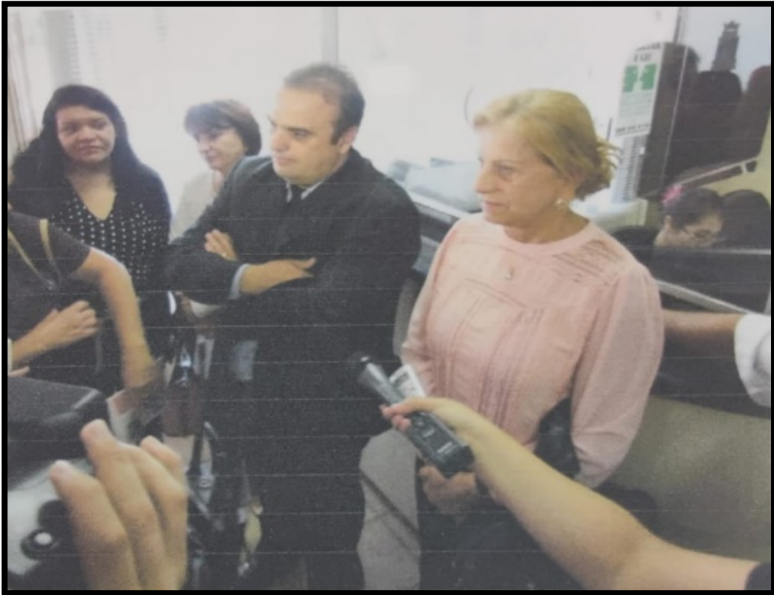
Figura 2: As tensões da tramitação do Projeto de Lei nº 38/2014 na Câmara Municipal de Foz do Iguaçu