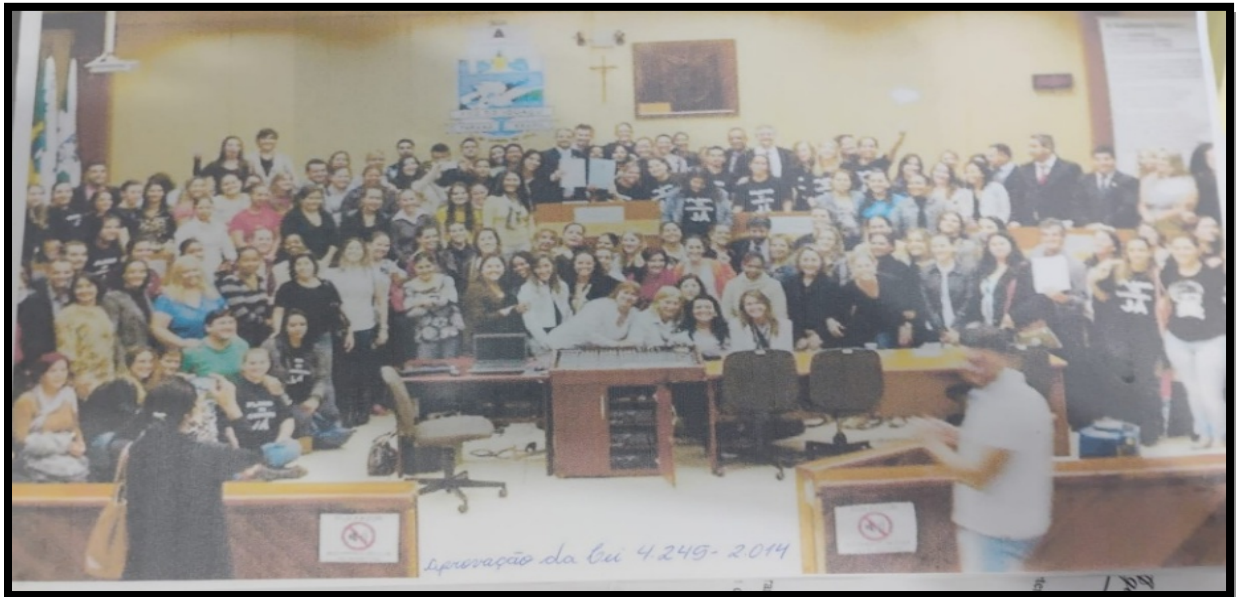
Figura 3: Vitória no templo: Câmara Municipal aprova o PL nº 38

essa vitória institucional: ao ocuparem o próprio “templo” do Poder Legislativo, as professoras simbolizam a culminação de uma mobilização que forçou a legalização formal da valorização. Esse registro coletivo atua como um testemunho visual do poder da luta organizada sobre o processo decisório municipal, transformando a letra da lei em uma conquista inscrita na memória do Sinprefi (2014):