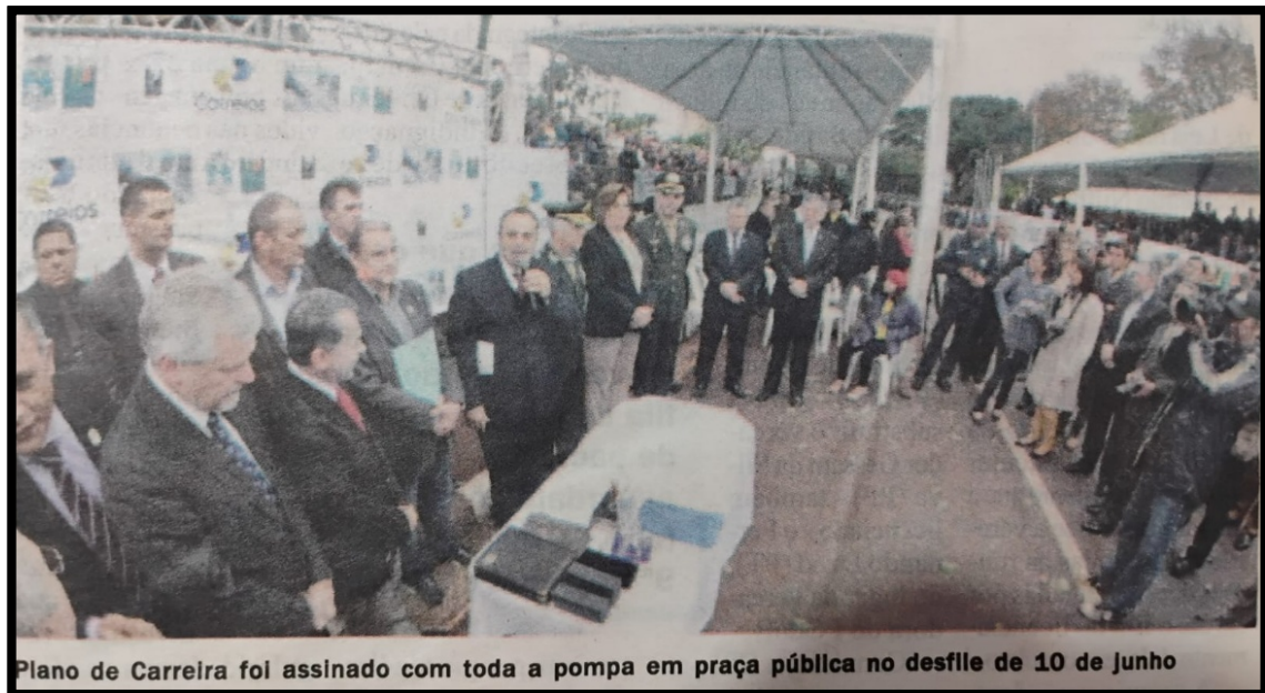
Figura 4: Entre o rito e a realidade: a mise-en-scène política na sanção da Lei nº 4245/2014