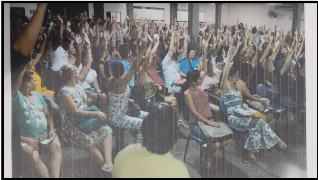
Figura 8: Assembleia Sinprefi: deliberação pela Greve