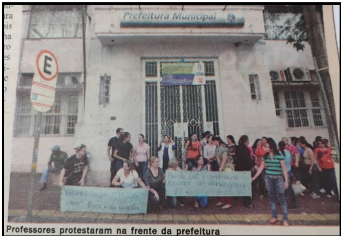
Figura 6: Cenário da disputa: Prefeitura municipal de Foz do Iguaçu

(Tribuna Popular) captura essa escalada. Esse registro fotográfico foi atribuído ao Sinprefi, ainda de setembro, captura as professoras posicionadas em frente ao prédio do poder executivo com suas faixas de protesto, reforçava a tática de confronto direto adotada pelo Sinprefi e pela categoria: