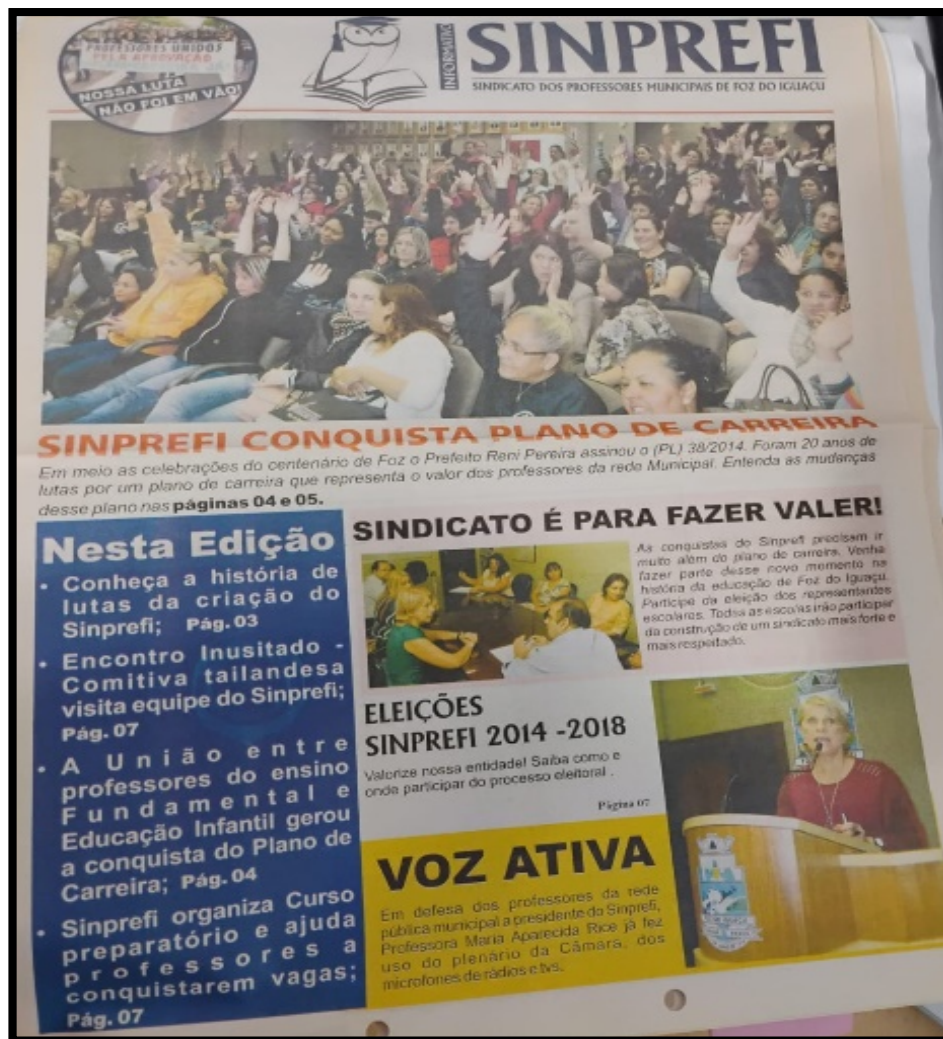
Figura 5: Jornal Sinprefi: “o triunfo vazio”