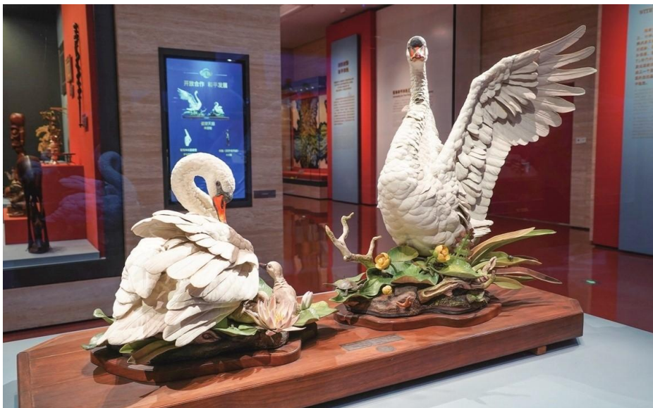
Figura 1: Cisnes de porcelana dados pelo ex-presidente dos EUA Richard Nixon ao presidente Mao Zedong, na Central Gifts and Cultural Relics Management em Pequim.

Os presentes funcionam como veículos de comunicação diplomática, permitindo que o doador transmita informações, emoções ou intenções ao destinatário. No âmbito das relações internacionais, os presentes nacionais, atuam como elos simbólicos entre diferentes países. A troca de presentes se configura como uma prática ritualística e simbólica, sendo um elemento fundamental da etiqueta diplomática.