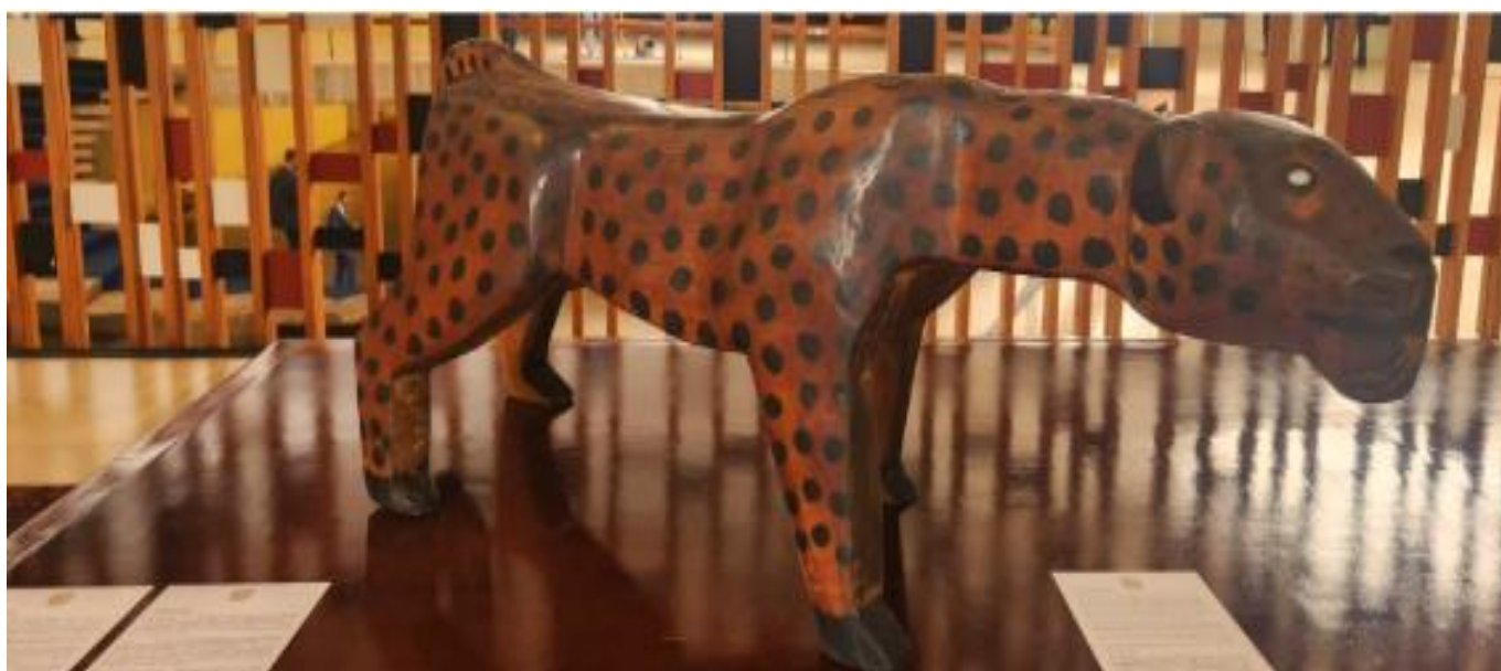
Figura 3: Banco Indígena Waurá

Nesse sentido os presentes trocados entre Brasil e China se encaixam na diplomacia de primeira ordem uma vez que são gestos diretos de autoridades governamentais e refletem o cuidado da China em força reforçar os laços estratégicos culturais com o Brasil utilizando disse inclusive ter fatos constrangimentos da diplomacia cultural. Um exemplo é a miniatura da sonda lunar, que remete ao programa de satélite sino-brasileiro de recursos terrestres iniciado em 1988, destacando a cooperação científica e tecnológica. Os artefatos de porcelana representaram a tradição milenar chinesa e simbolizaram bons votos, prosperidade e fortalecimento de laços sociais.