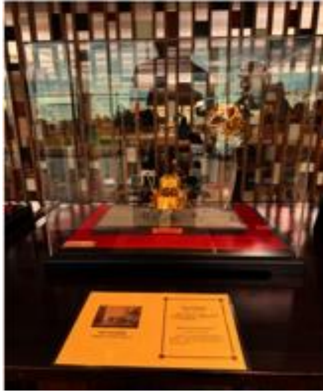
Figura 4: Miniatura da Sonda Chang'e-5

simbólicos permitem à China projetar uma imagem amistosa e respeitosa das diferentes culturas, desvinculada da retórica comunista, facilitando a comunicação e aproximação entre povos e governos.