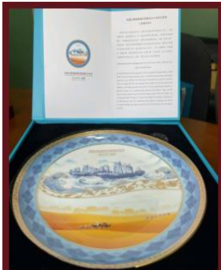
Figura 5: Prato Ornamental Rota da Seda

A partir desta exposição, foi elaborado um inventário disponibilizado pela Diretoria de Assuntos Internacionais, que registra os presentes recebidos ao longo dos anos. O acervo inclui pratos comemorativos, selos, pingentes, telas, souvenirs, broches, leques, calendários e, principalmente, objetos de decoração utilizados em festividades tradicionais, como o Ano-Novo Chinês.