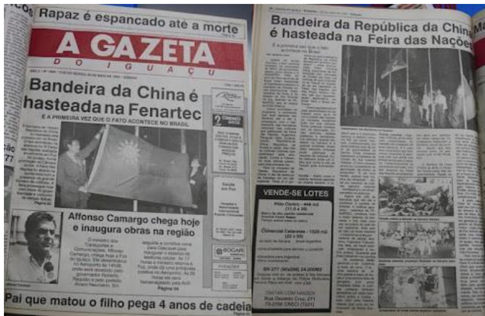
Figura 7: Jornal “A Gazeta”

De acordo com relatos não oficiais, a embaixada da China no Brasil teria impedido o hasteamento da bandeira de Taiwan. Após esse incidente, a influência da China na região aumentou, e a comunidade taiwanesa começou a se tornar mais discreta, dificultando encontrar alguém que se identifique como taiwanês. Outro ponto a ser considerado é que muitos imigrantes chineses de Taiwan que chegaram à região nas décadas de 1970 e 1980 estabeleceram-se em Ciudad del Este, no Paraguai, mas transitavam por Foz do Iguazu. Como aponta Machado (2010, p. 469), a migração taiwanesa para Ciudad del Este foi impulsionada pela busca por oportunidades comerciais, especialmente nas importações de produtos fabricados em Taiwan.