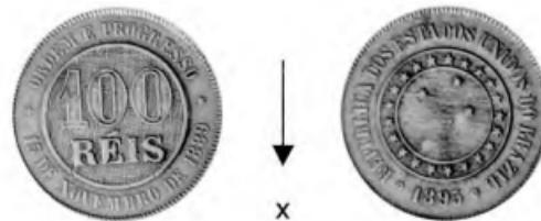
Imagem 5 - 100 réis da série MCM I em (CAFFARELLI, 2002 p. 127)

100 réis Ø 27 mm - Peso: 10,00 g Espessura: 2,00 mm Bordo: liso