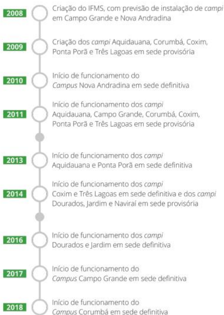
Figura 5 – Linha do tempo sobre o funcionamento dos campi dos IFMS

A figura 5 sintetiza o funcionamento dos campi dos IFMS