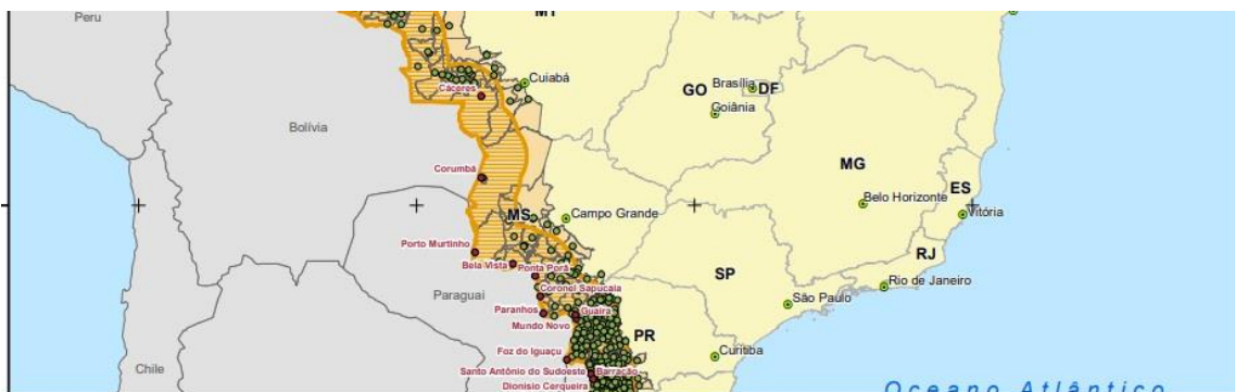
Figura 1 – área de fronteira de Mato Grosso do Sul com Paraguai e Bolívia

Ao tratarmos da região de fronteira é nítido observar que o território é do estado na faixa de fronteira é significativo. Veja a figura 1: