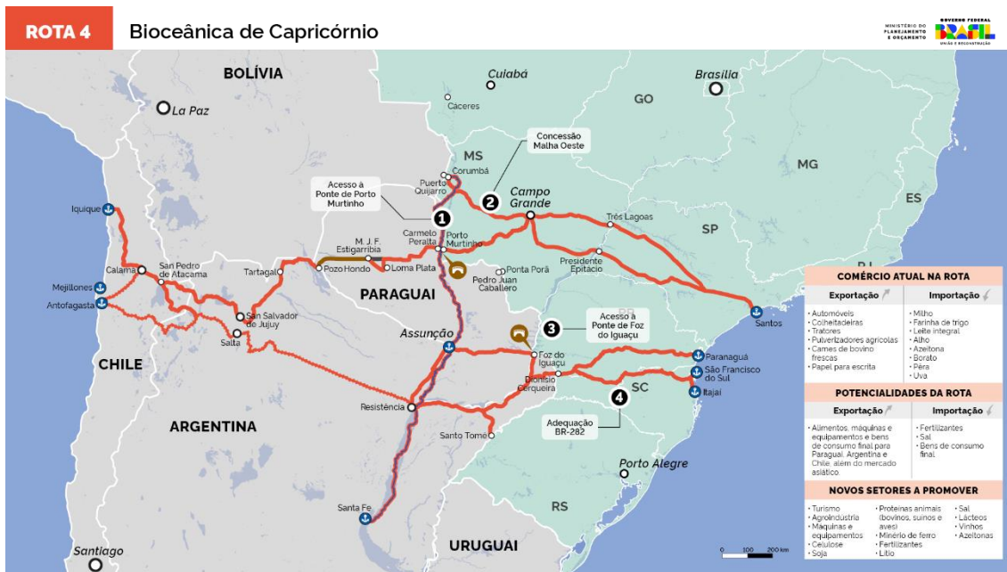
Figura 4 – Bioceânica de Capricórnio