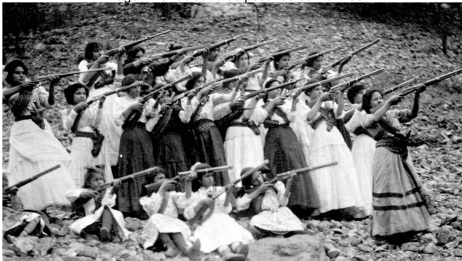
Imagem 10: Soldaderas posando com armas.