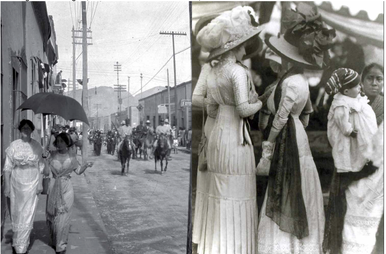
Imagem 3: Montagem, moda nos anos 1910 no México, entrada do exército revolucionário na cidade.