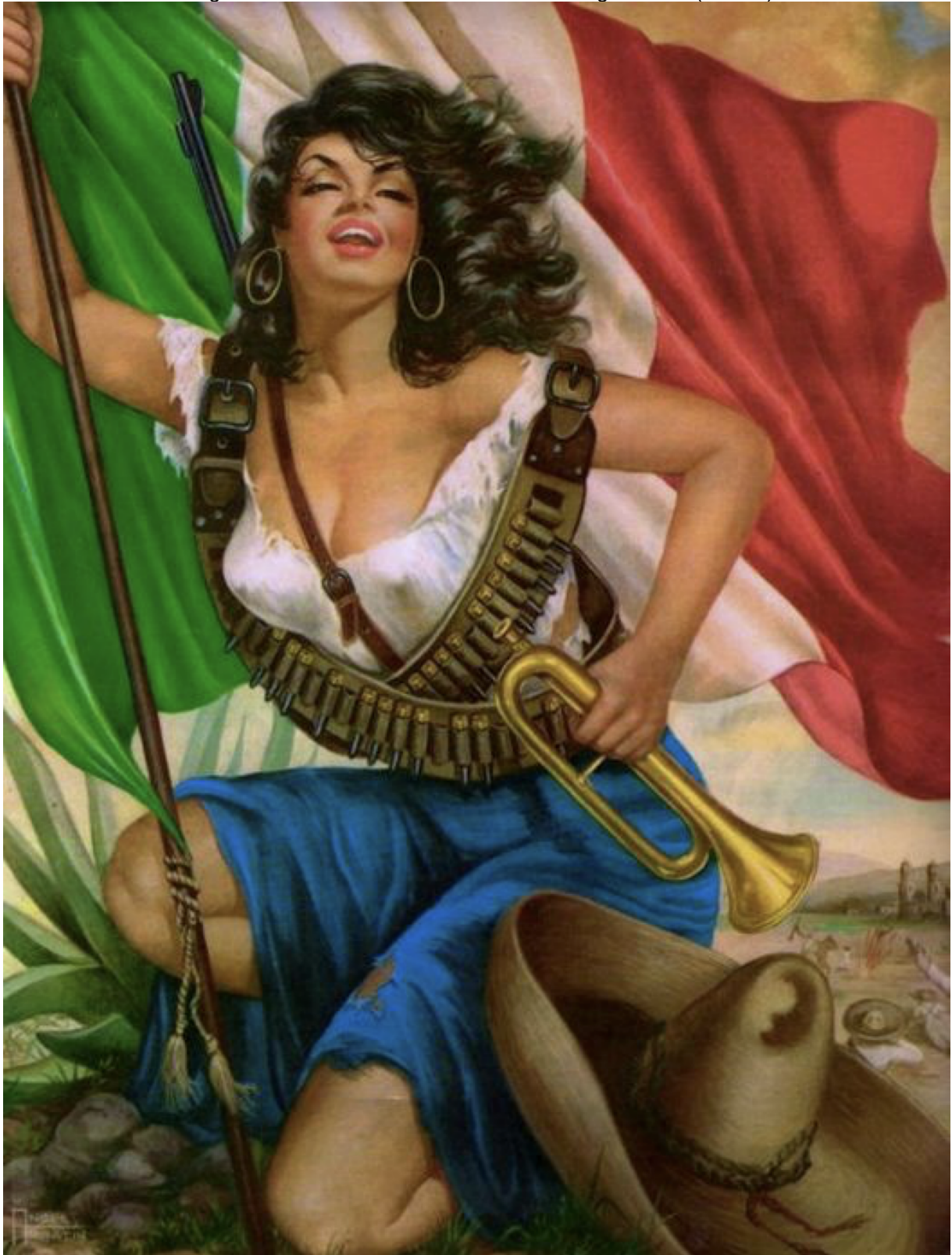
Imagem 8: “La Adelita” dos calendários de Ángel Martín (1932 –).