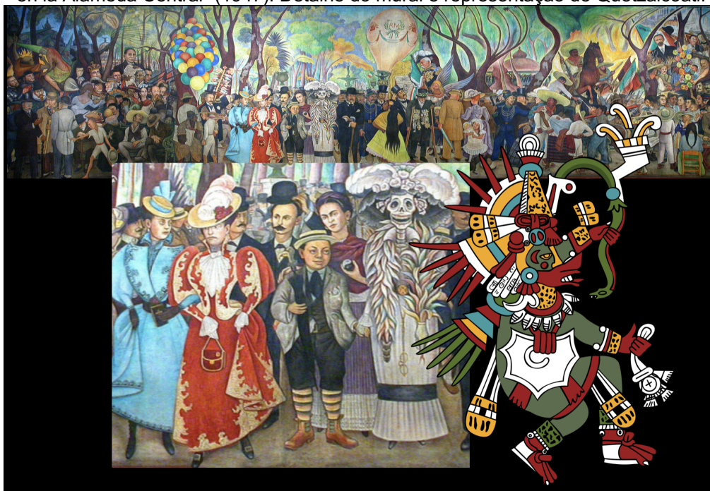
Imagem 5: Montagem, Mural de Diego Rivera, “Sueño de un tarde dominical en la Alameda Central” (1947). Detalhe do mural e representação de Quetzalcóatl.

entre artistas, políticos e escritores, mas também notamos as miscigenações, a negação cultural ancestral e a desigualdade social que foram decisivas na eclosão da Revolução.