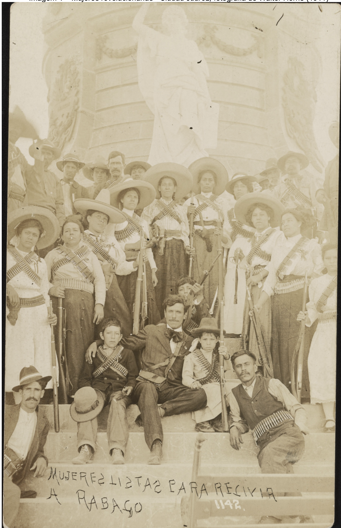
Imagem 1 – Mujeres revolucionarias - Ciudad Juarez, fotografia de Walter Horne (1911)

Fonte: Reprodução - https://es.wikipedia.org/wiki/Lázaro_Gutiérrez_de_Lara