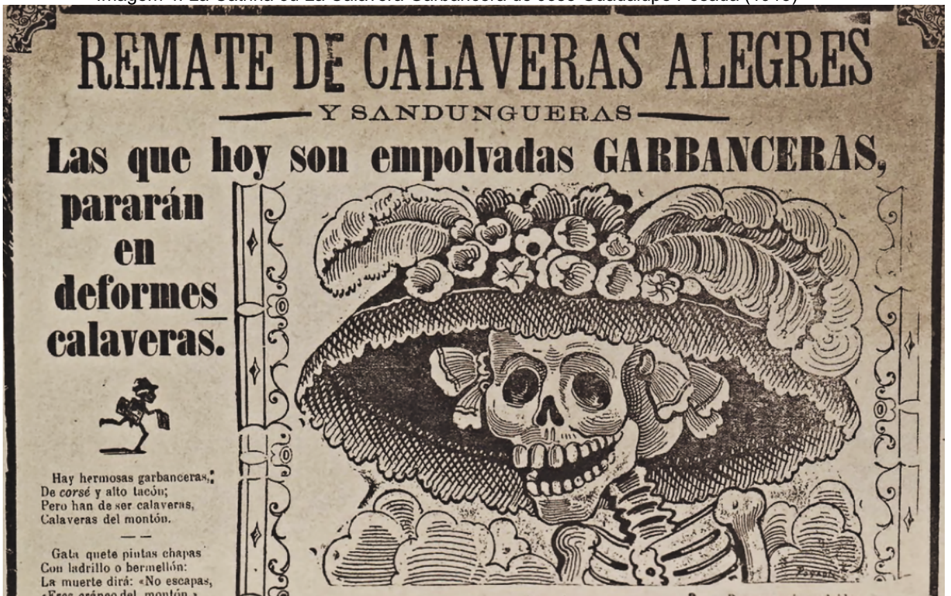
Imagem 4: La Catrina ou La Calavera Garbancera de José Guadalupe Posada (1913)