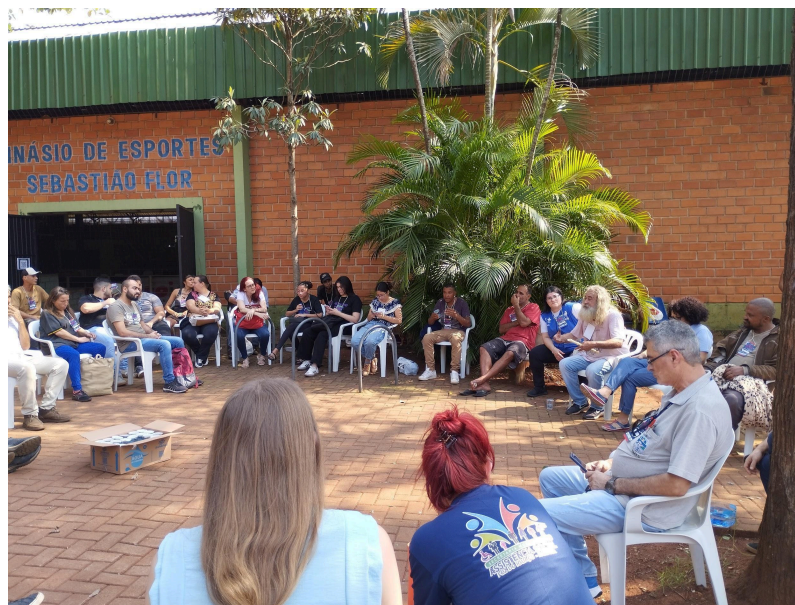
Imagem 4 - Roda de conversa entre pessoas em situação de rua, estudantes e diversas instituições

Para adensar a análise das contradições que permeiam o Programa de Residência Multiprofissional em Saúde da Família (PRMSF), é imperativo confrontar a realidade prática vivenciada com o horizonte ético-político que, teoricamente, deveria orientar sua estrutura. Segundo o Projeto Pedagógico Curricular (PPC) do PRMSF, o perfil do egresso preconiza uma formação de caráter crítico-reflexivo, ancorada nos pilares da Atenção Primária à Saúde (APS) e, por extensão, nas diretrizes fundamentais do Sistema Único de Saúde (SUS):