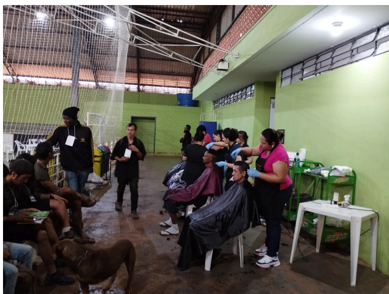
Imagem 3 - Corte de cabelo pela Escola e Salão de Cabeleiros Mutari

A terceira imagem, mostra a seção onde todas as pessoas em situação de rua (PSR) podiam cortar seus cabelos gratuitamente, serviço oferecido em parceria com a Escola e Salão de Cabeleiros Mutari. A necessidade da presença deste serviço no evento foi fortemente indicada pela pessoa que representava essa população nas reuniões e que foi fundamental para organização de um evento que de fato buscasse atender as necessidades do público alvo.