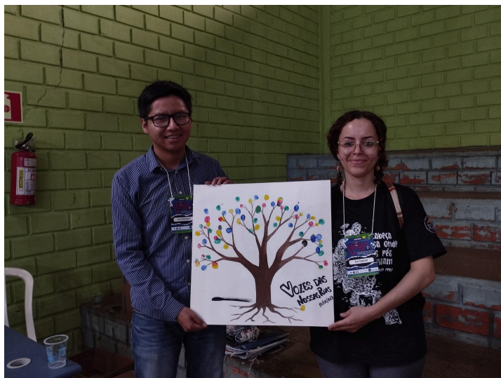
Imagem 2 - Árvore feita por arte educadora do Foz Fazendo Arte, com as digitais das pessoas que iam chegando no evento

A terceira imagem, mostra a seção onde todas as pessoas em situação de rua (PSR) podiam cortar seus cabelos gratuitamente, serviço oferecido em parceria com a Escola e Salão de Cabeleiros Mutari. A necessidade da presença deste serviço no evento foi fortemente indicada pela pessoa que representava essa população nas reuniões e que foi fundamental para organização de um evento que de fato buscasse atender as necessidades do público alvo.