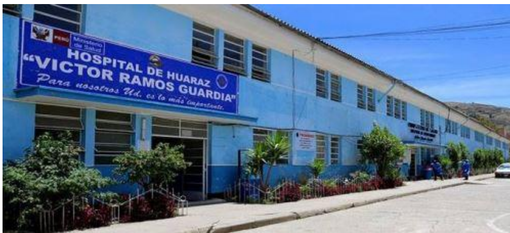
IMAGEN 5 - Hospital Victor Ramoz Guardia