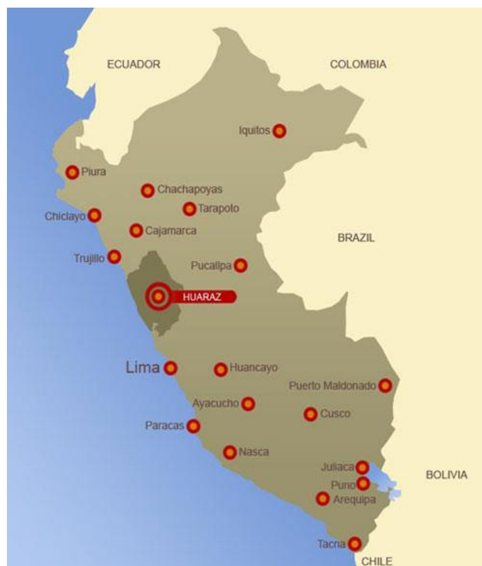
IMAGEN 1 - Mapa de la ciudad de Huarás