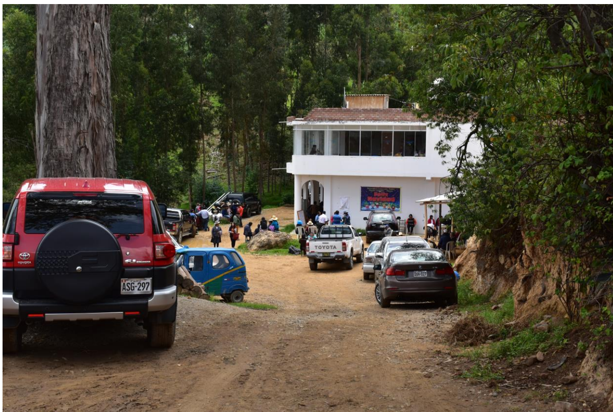
IMAGEN 8 - Edificio principal - Hermandad CAACSGA

Nuestra conversación terminó momentos antes de la llegada del médium y sus colaboradores, cuando nos dirigíamos al edificio principal (Imagen 8) donde suceden las actividades rituales de cura; este edificio posee dos pisos, en el primero se encuentra la sala de operaciones, la sección de farmacia donde son proporcionadas las medicinas naturales, un tóxico, dos baños (femenino y masculino), y en el segundo, el cuarto de descanso del médium y sus colaboradores, además de dos comedores abastecidos por una cocina principal, una reservada sólo para la hermandad y la otra para el público general. Estos actores, que suman poco más de 10 personas, llegan en una minivan trayendo consigo medicinas y materiales 26 a ser utilizados en los ritos de cura. Sus tareas son divididas al llegar, un grupo ordena los materiales traídos, otro supervisa si todos los espacios están listos para ser utilizados, en tanto que otro se alimenta para poder trabajar durante la mañana.