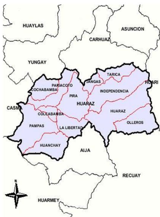
IMAGEN 3 - Mapa de la aproximación entre los distritos de Huarás e Independencia