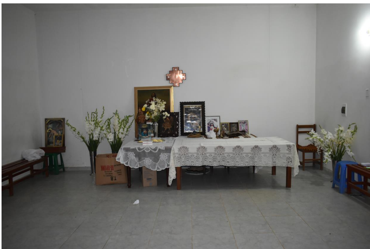
IMAGEN 10 - Sala - Hermandad CAACSGA

tener certeza de no haber entrado con algún aparato electrónico, no extender los brazos una vez sea apagada la luz, seguir a los colaboradores que están preparados para llevar a las personas hasta la mesa en medio de la oscuridad, rezar en conjunto cuando inicie el ritual, y saludar a los “papas” con respeto usando un “Ave María” o un “Buenos días, papitos”. Al mismo tiempo que las indicaciones eran dadas, el Pongo ordenaba los cuarzos transparentes y rociaba sobre ellas un poco de agua florida. Colaboradores cierran las puertas y la luz es apagada en la sala por el Médiu. La ausencia de visualización hizo más sensitivos mis sentidos, el olor a palo santo y agua florida parecían intensificarse más mientras se escuchaba personas nerviosas rezando, susurrando, o suspirando.