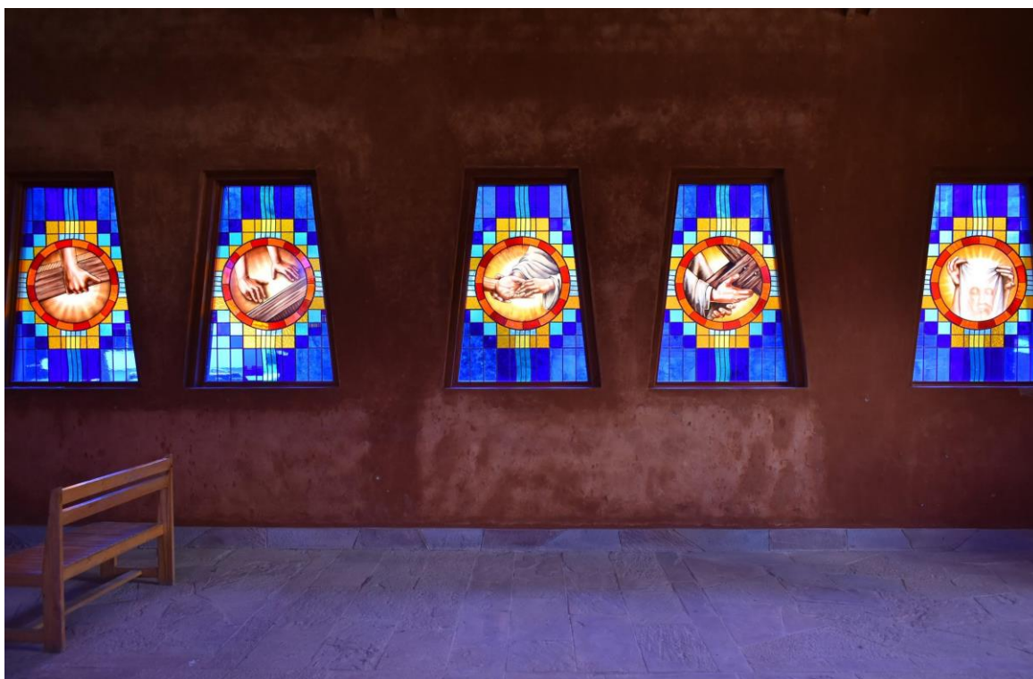
IMAGEN 11 - Estaciones de la pasión de Cristo

En estas fotografías puede apreciarse las representaciones gráficas de la pasión de Cristo fabricadas en piezas de vidrio e instaladas en una ventana trapezoidal.