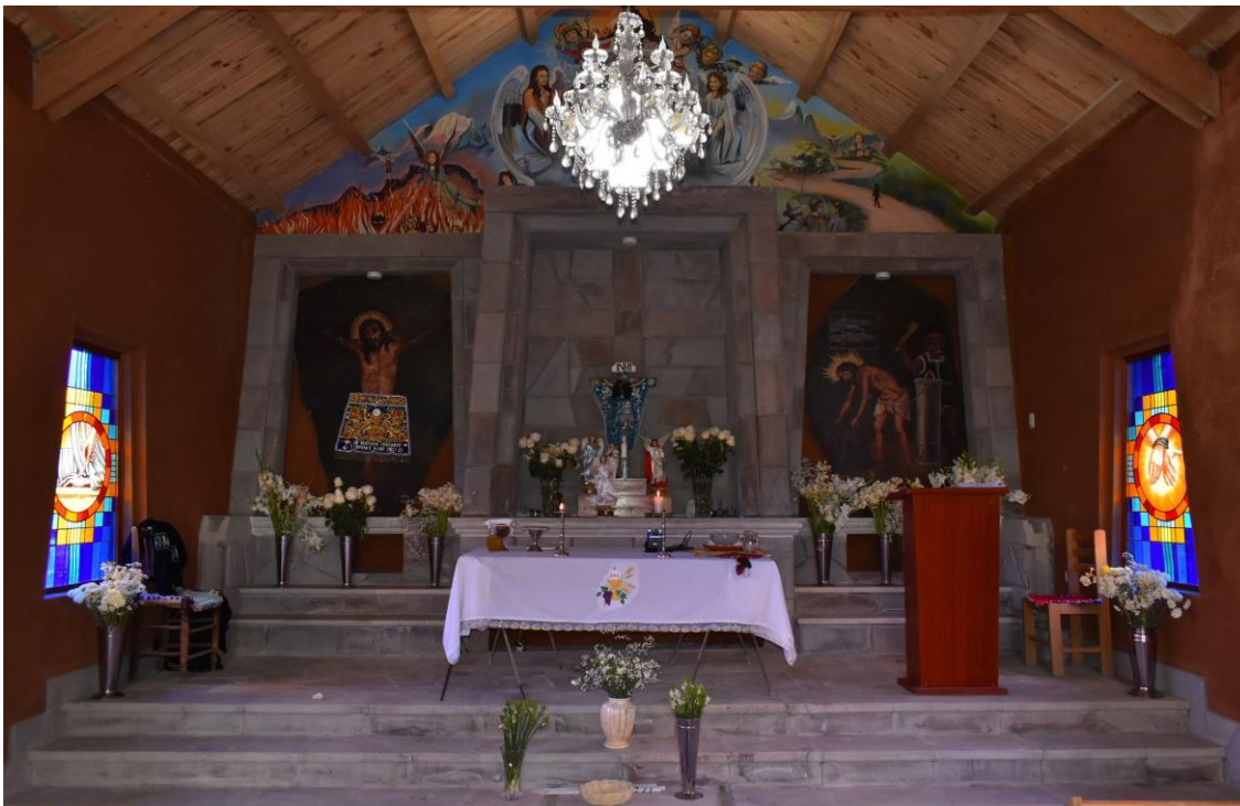
IMAGEN 13 - Imagen de la parte frontal dentro del santuario