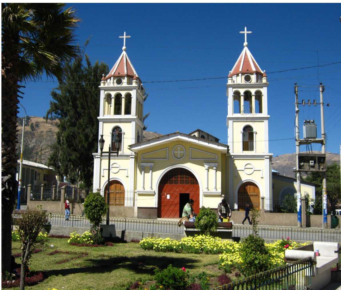
IMAGEN 4 - Iglesia de Belén