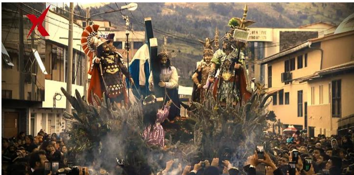
IMAGEN 2 - Semana santa huaracina