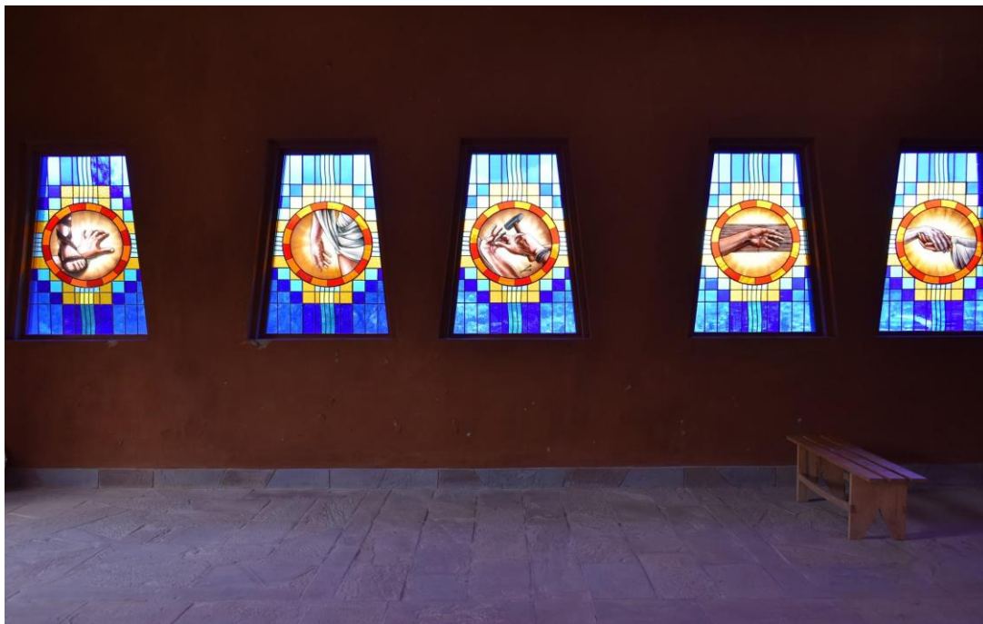
IMAGEN 12 - Estaciones de la pasión de Cristo