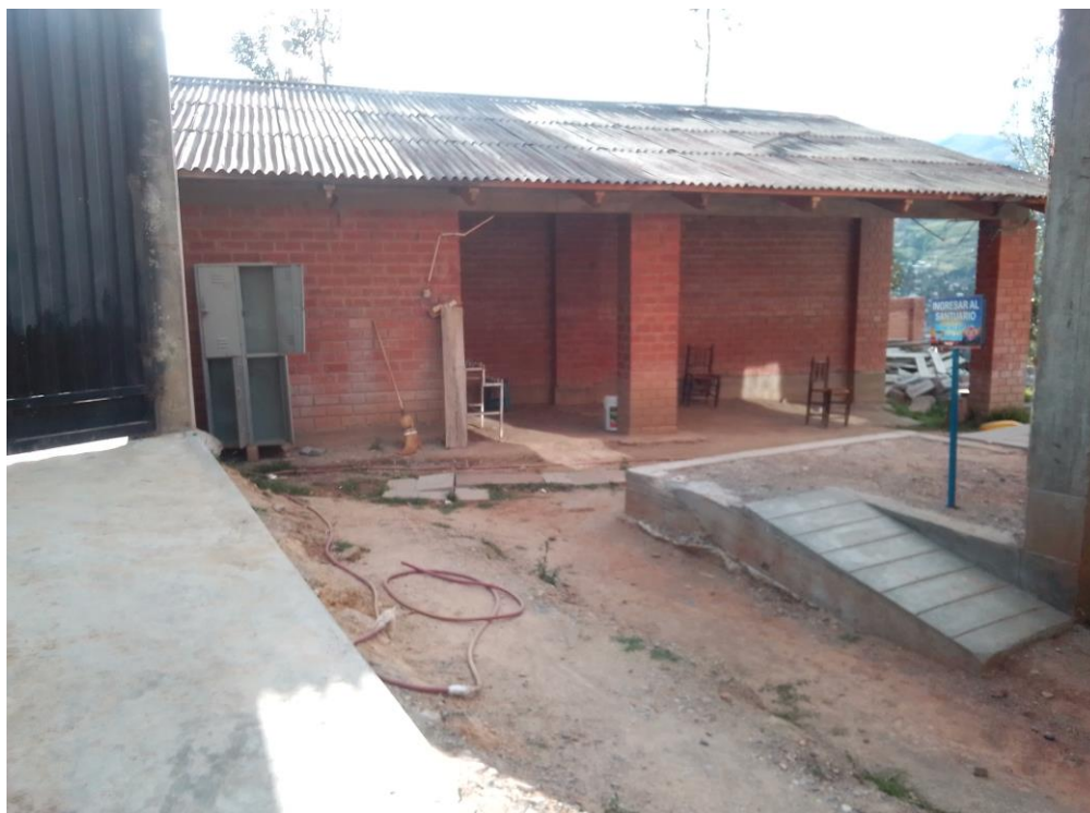
IMAGEN 6 - Cuarto de oración - Hermandad CAACSGA

del local, el padre me dirige algunas palabras; él tenía una vaga idea de mi presencia ahí, había escuchado de mi familiar los motivos de mi presencia, por lo que después de una presentación sincera se ofreció a brindar su ayuda desde el comienzo; siempre mencionaba que era estudiante de ciencias sociales, resultaba menos complejo y menos explicativo que mencionar antropología, ya enseguida argumentaba que mi llegada era para conocer las experiencias personales de asistentes curados de enfermedades diversas, y no para hacer una demostración científica de los hechos sucedidos en ese lugar.