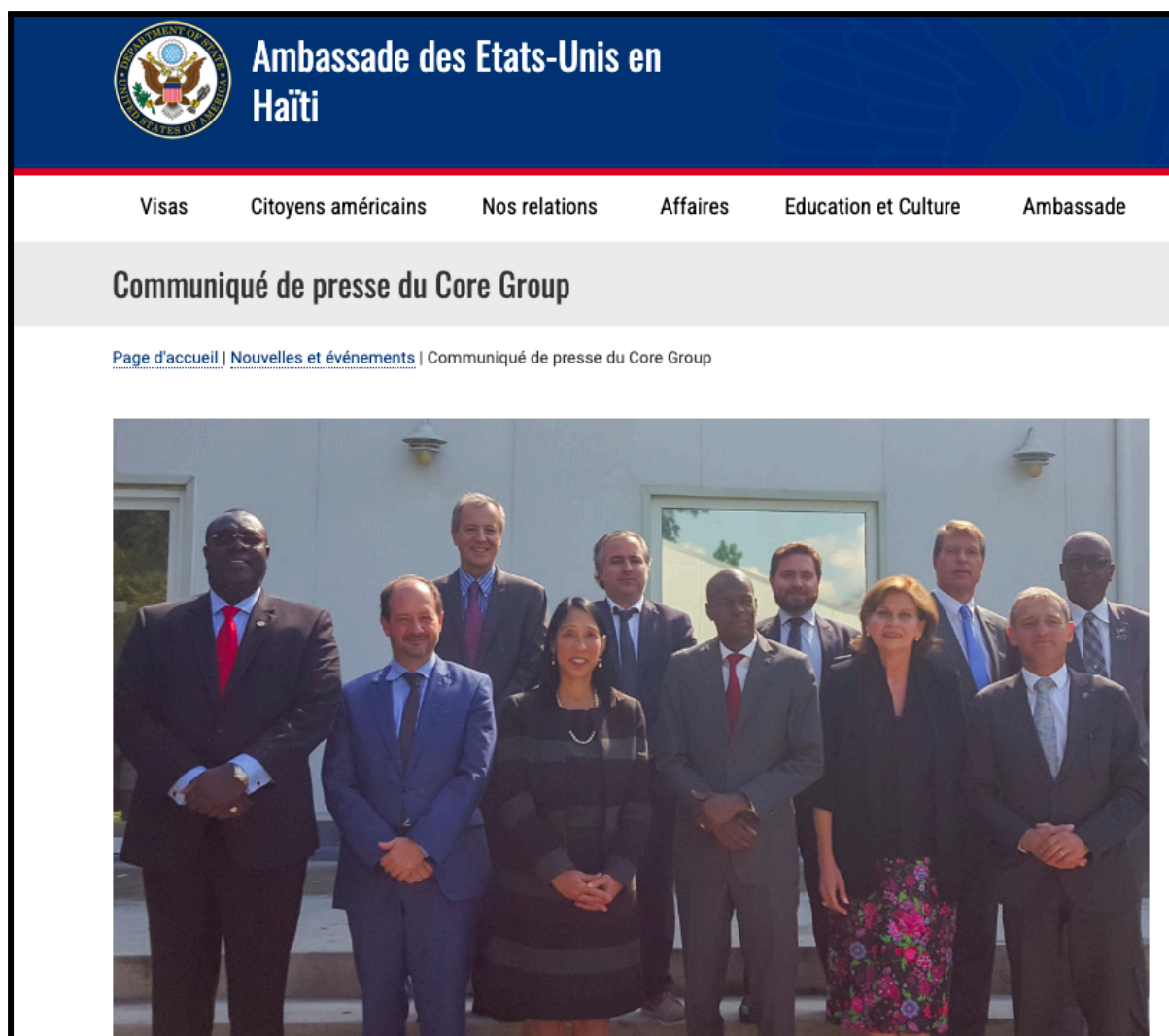
Figura 5: O presidente Jovenel Moïse em foto no site da embaixada dos EUA com os principais embaixadores/as do CORE GROUP após um encontro sobre a crise de 2018.