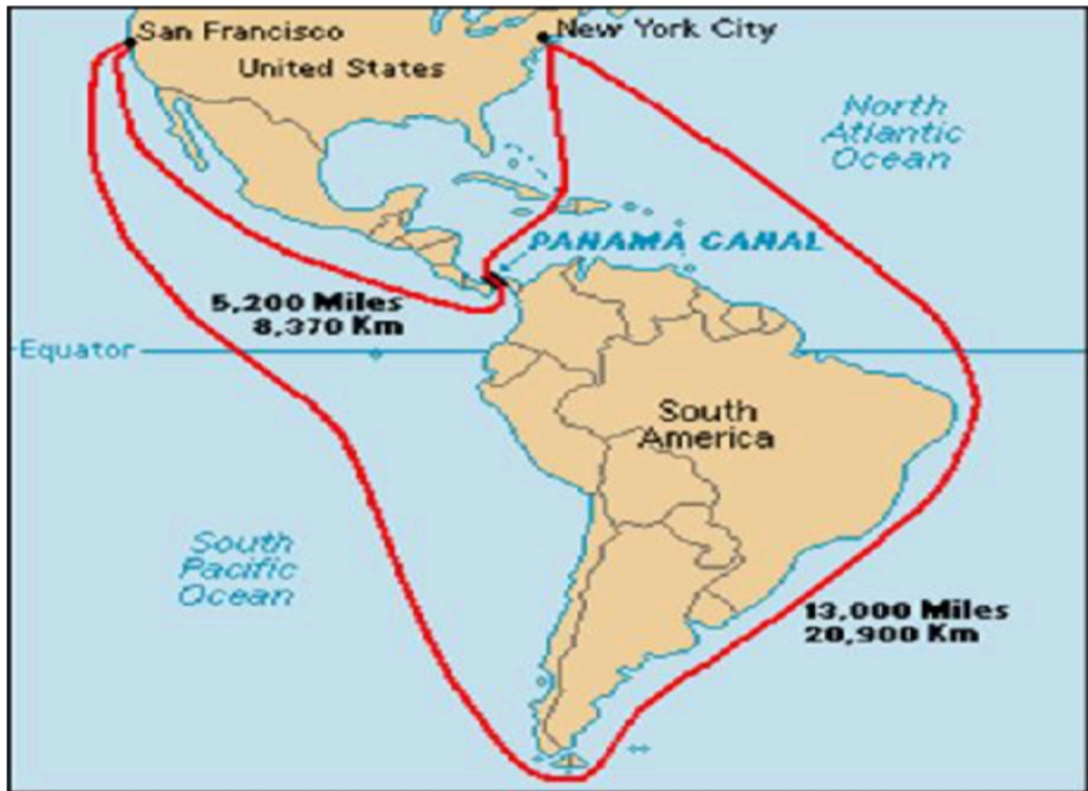
Figura 3: Mapa mostrando a rota comercial ligando o Pacífico com o Atlântico pelo Canal de Panamá passando pelo “Môle Saint Nicolas” do Haiti.