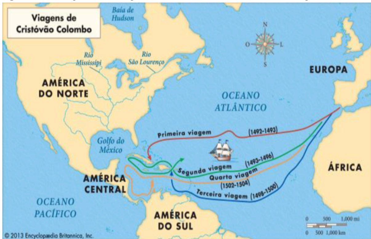
Figura 1: Mapa das viagens de Cristóvão Colombo na região caribenha