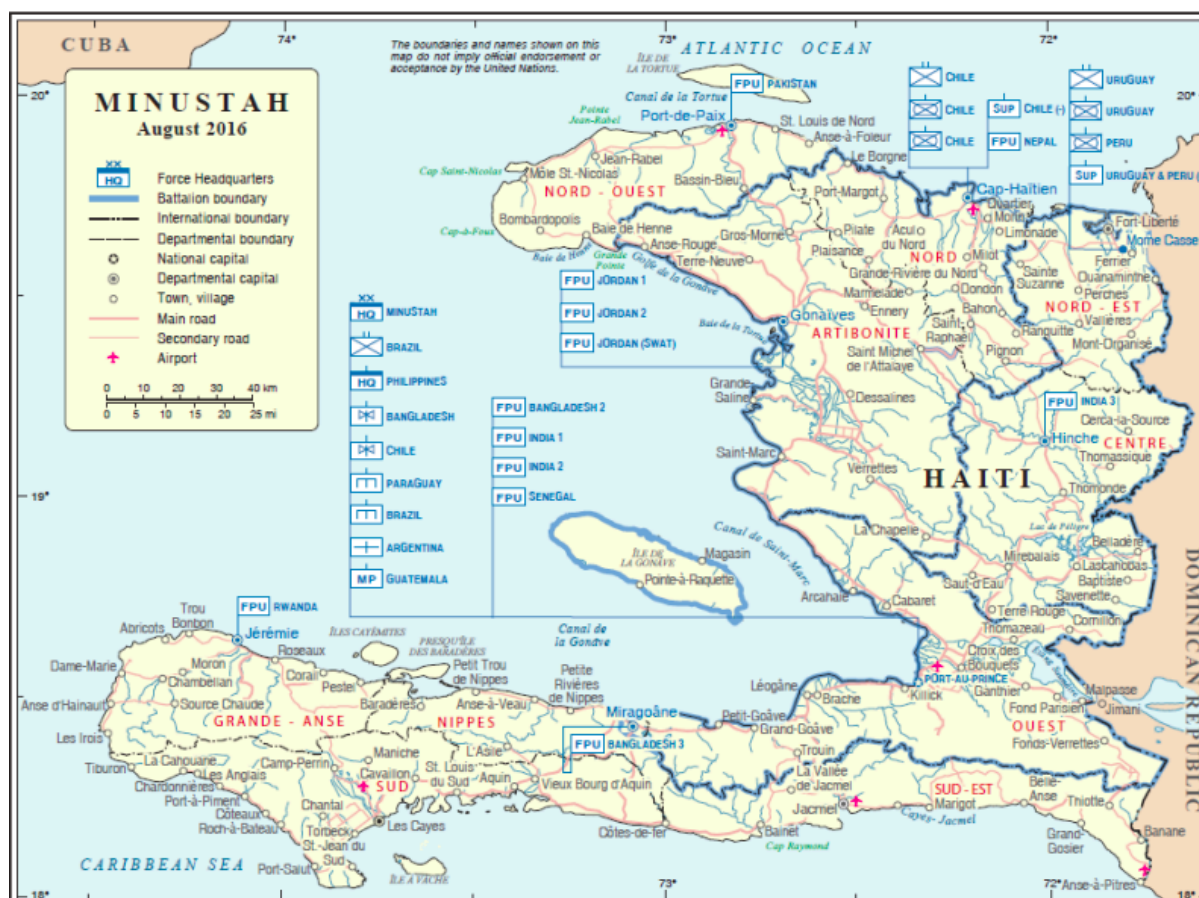
Figura 4: Distribuição das tropas da MINUSTAH no território haitiano por países