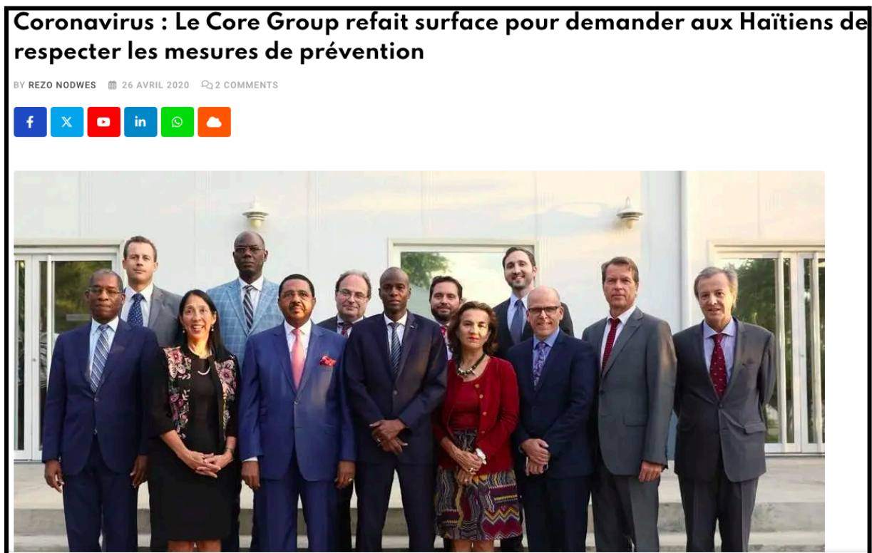
Figura 9 : Uma outra foto do presidente Jovenel Moïse postado com os embaixadores do Core Group depois de um encontro em meio à crise 2018-2021.

Fonte: Rezo Nòdwès. Publicado em 26 de abril de 2020. Disponível em: https://reznodwes.com/?p=169279& . Acesso em 28 de agosto de 2024