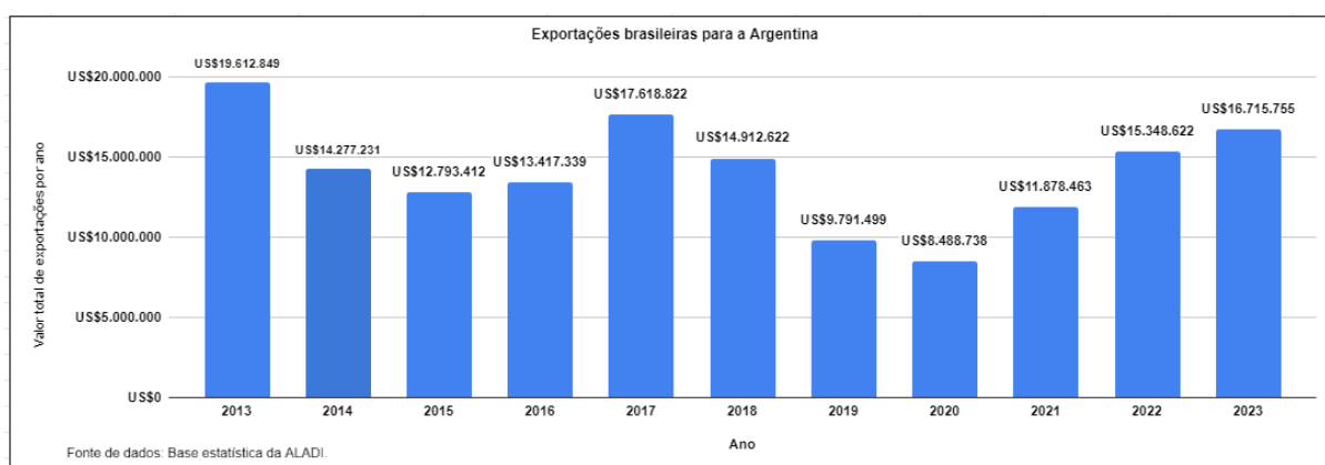
Gráfico 2 - Exportações brasileiras para a Argentina nos últimos 10 anos

Ao analisar especificamente o período do governo Bolsonaro, que esteve no poder desde o início de 2019 até final de 2022, o valor total de exportações brasileiras para a Argentina aumentou significativamente. No primeiro ano de governo as exportações totalizaram US$ 9 bilhões, e no último ano dessa gestão (2022) atingiram US$ 15 bilhões, representando o aumento de 56,7% da quota de exportações brasileiras para a Argentina ao decorrer desses quatro anos. Dados verificados no gráfico abaixo: