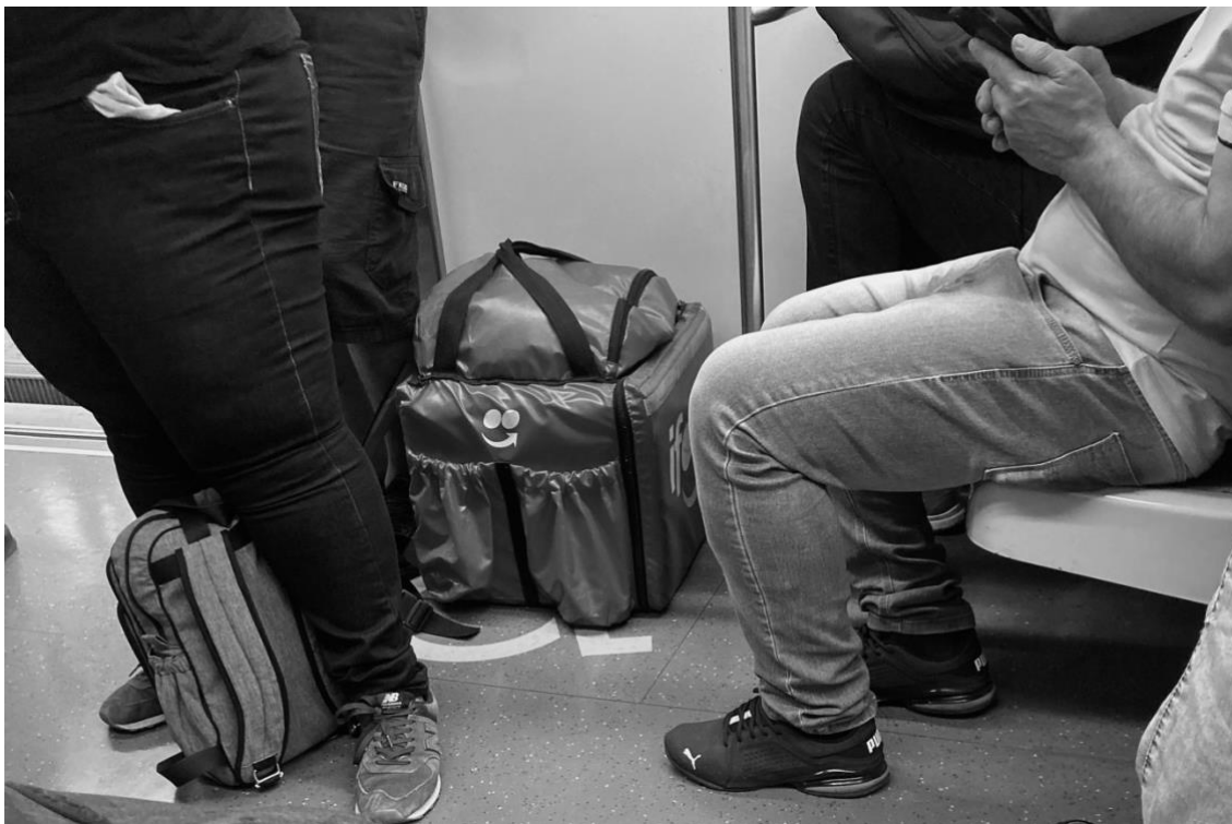
Fotografia 1: Do outro lado: a travessia da periferia ao “centro”