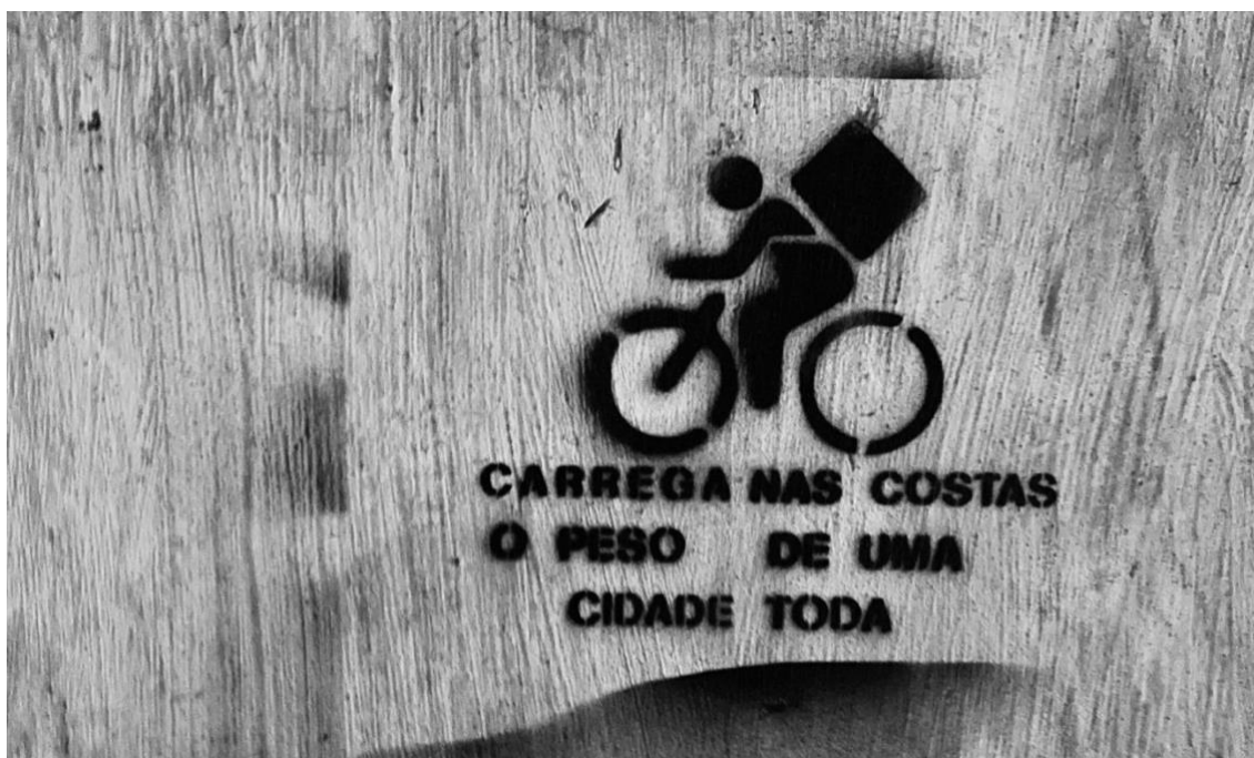
Fotografia 4: Spencil feito por Lola (instagram: @lola_giroporai)

Ainda hoje, o trabalho da população negra e pobre é marcada pela exploração, precarização e espoliação, tendo seus direitos marginalizados, enquanto são inseridos em dinâmicas de trabalho precárias.