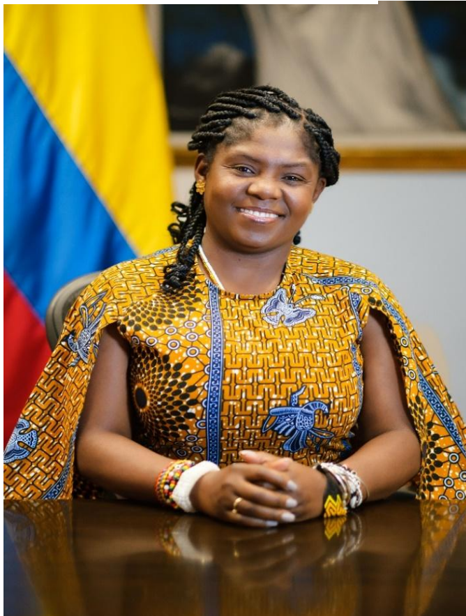
Figura 2 – Francia Márquez