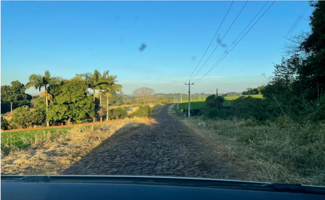
Imagem 4: estrada de chegada a comunidade.