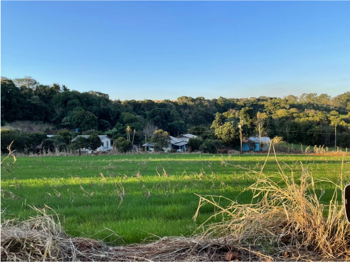
Imagem 3: Comunidade Quilombola, casas relativamente próximas.