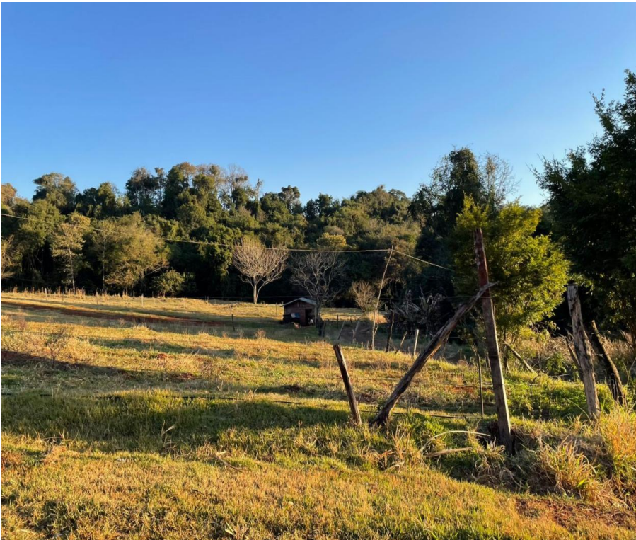
Imagem 6: pedaços de terras usadas para criação de animais.