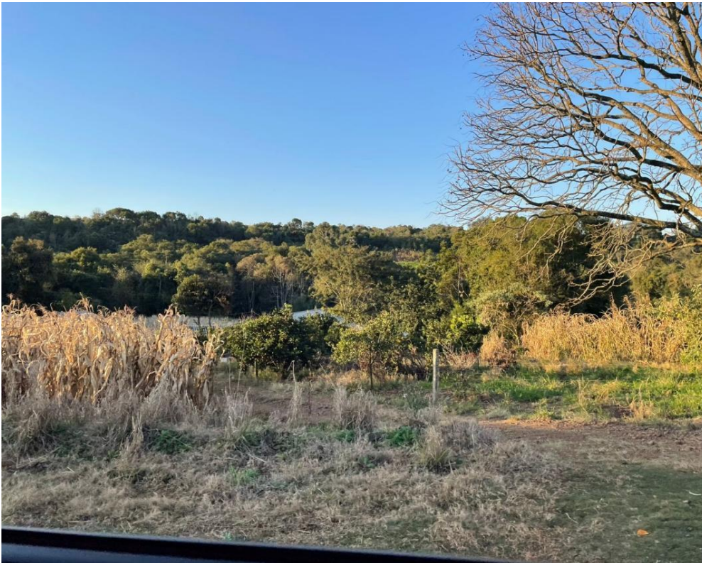
Imagem 7: pedaços de terras usadas para plantio familiar