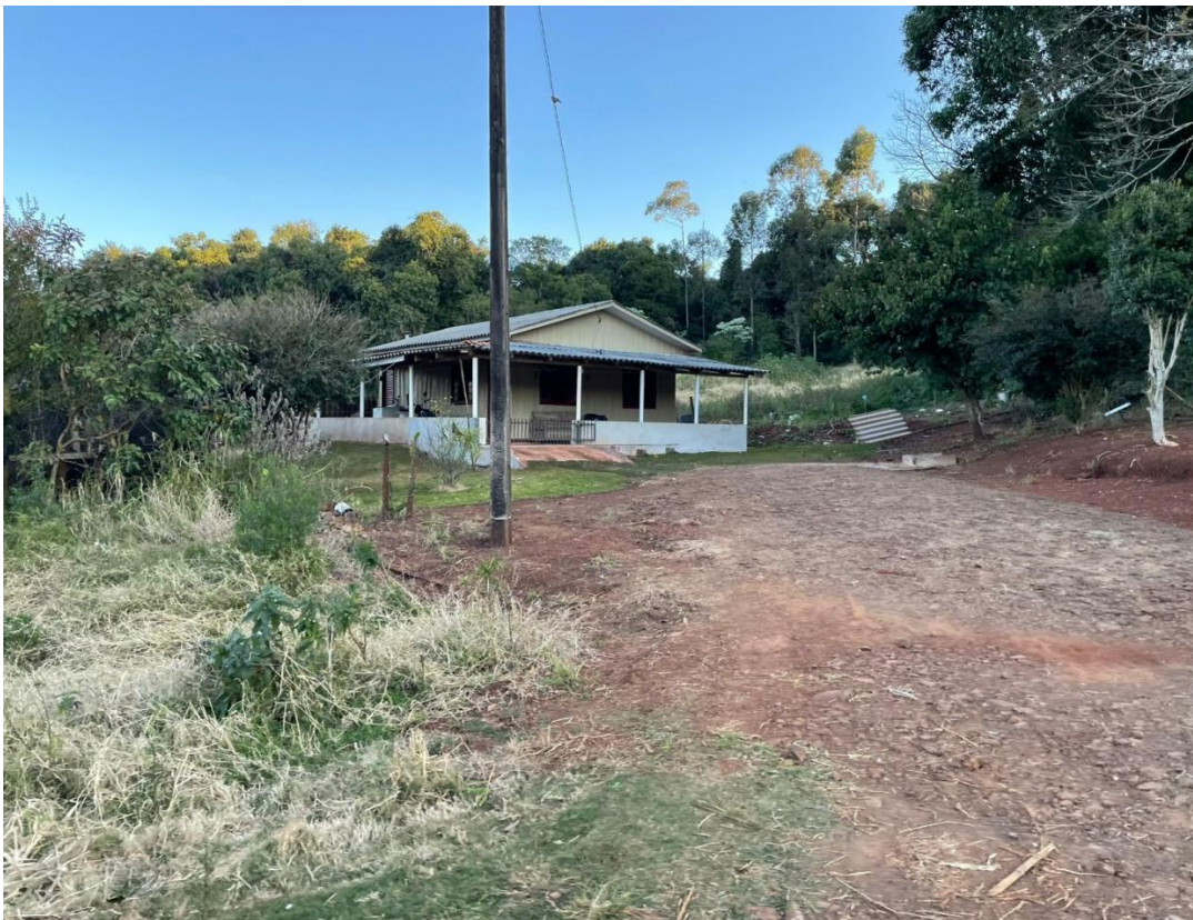
Imagem 5: de uma residência