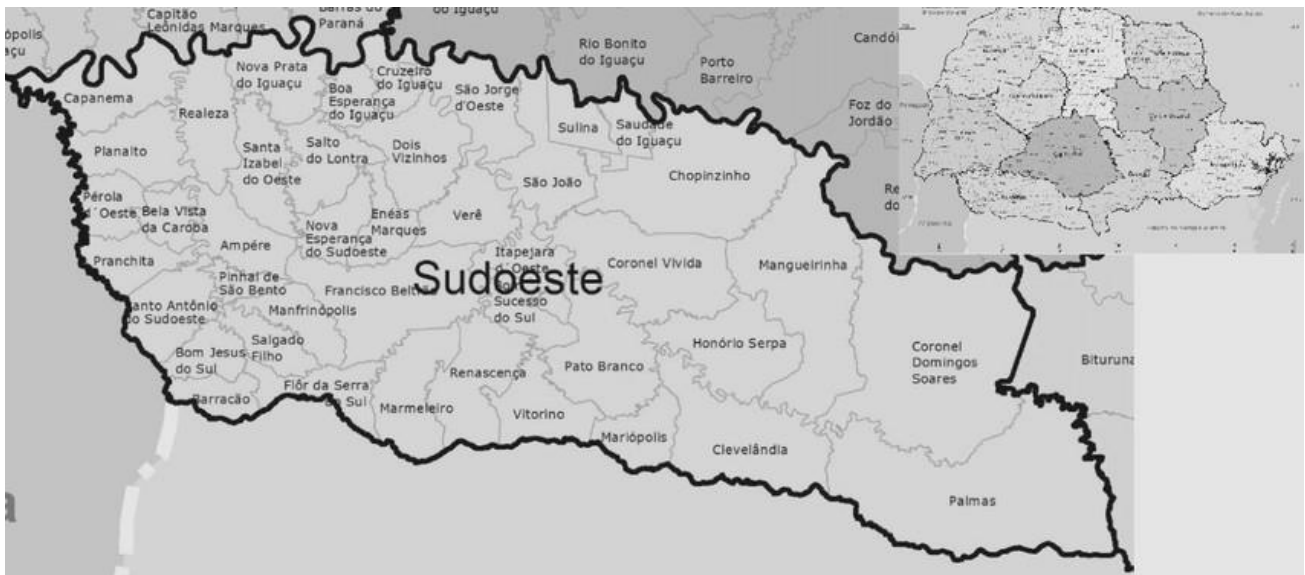
Imagem número 1: Mapa da região sudoeste do estado do Paraná