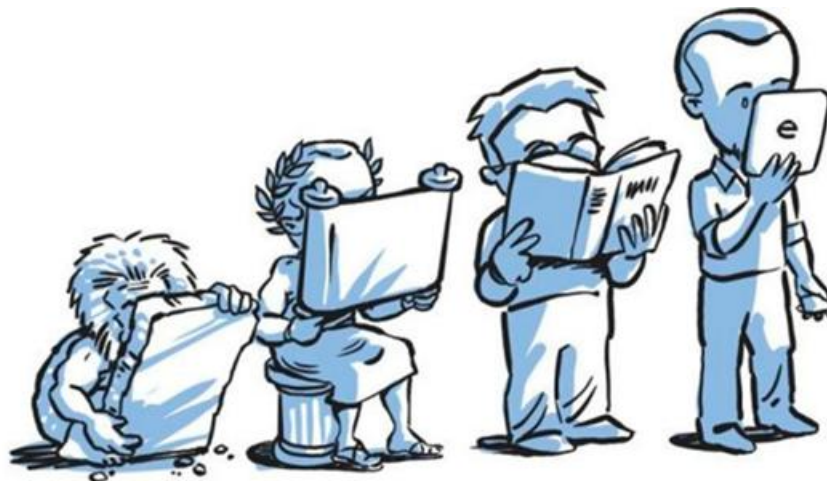
Figura 1 –Evolução tecnológica

Essa relação entre o desenvolvimento dessas técnicas e a organização dos instrumentos é de suma importância para conseguir entender como foi que a sociedade contemporânea chegou ao mundo moderno.