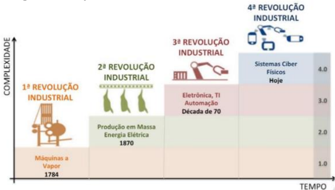
Figura 3: Revoluções Industriais