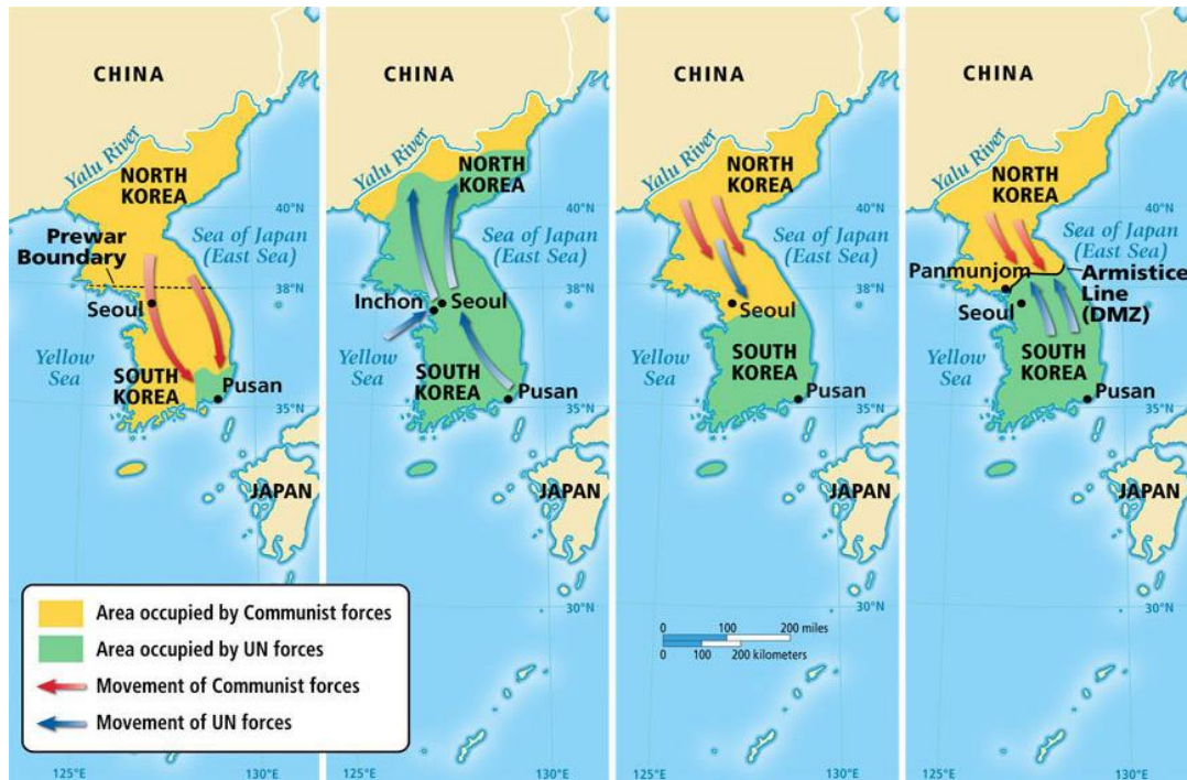
Figura 10 - O teatro da guerra. Autoria: McDougal Littell

marca uma paisagem de fronteira conflituosa e cruel; um retrato dos períodos desta guerra com os avanços e recuos dos exércitos do Norte e do Sul até a conformação da zona desmilitarizada pode ser visto na figura 10.