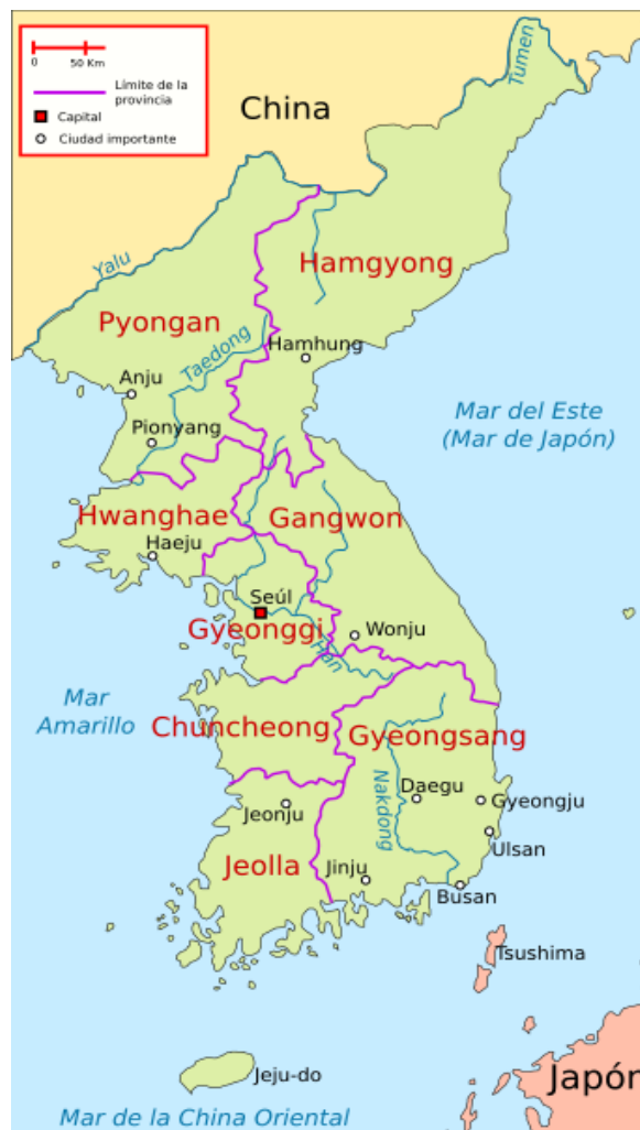
Figura 12 - Mapa das oito províncias antigas da Coreia onde existem 9 dialetos (das oito províncias e o da ilha de Jeju).