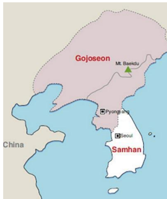
Figura 2 - Localização do reino de Gojoseon