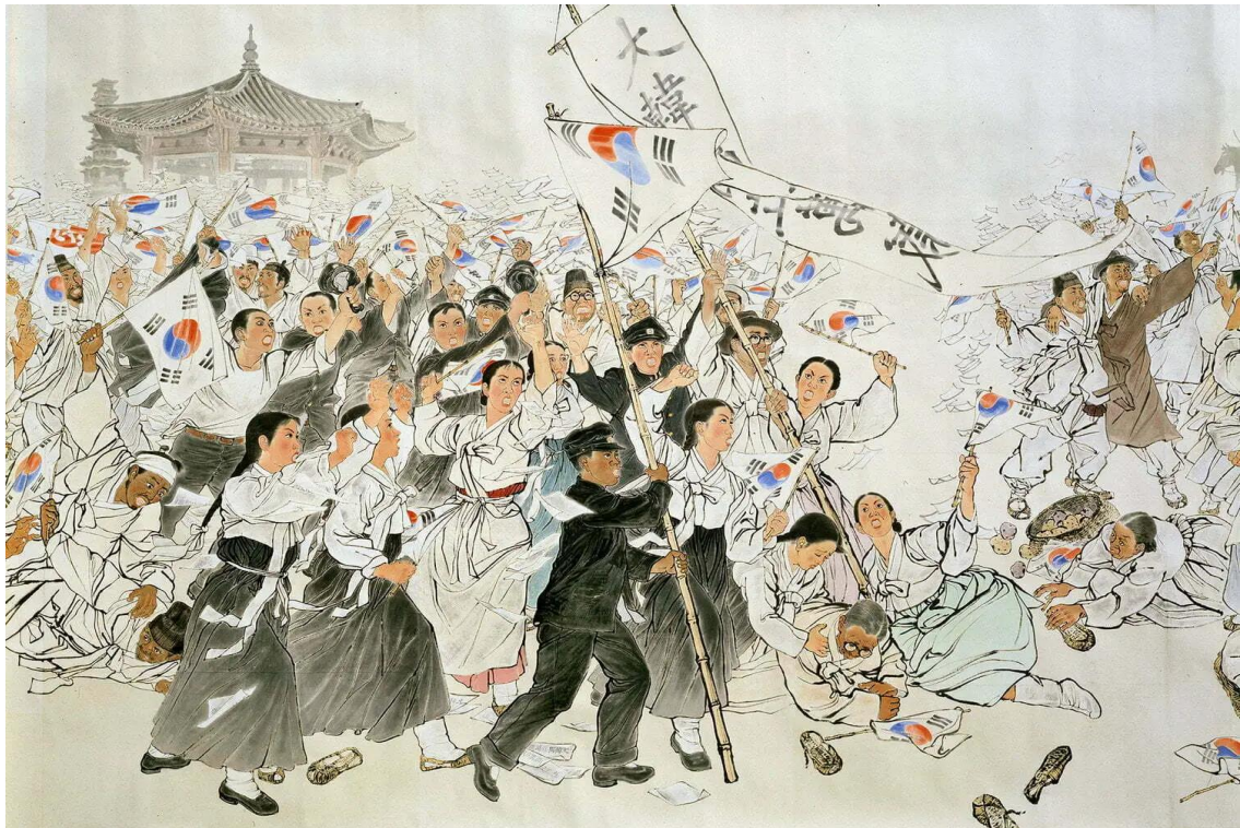
Figura 9 - The March 1st Independence Movement . Gravura de: Suh Se-ok. Retratando o movimento de independência coreano no dia 1 de março de 1919