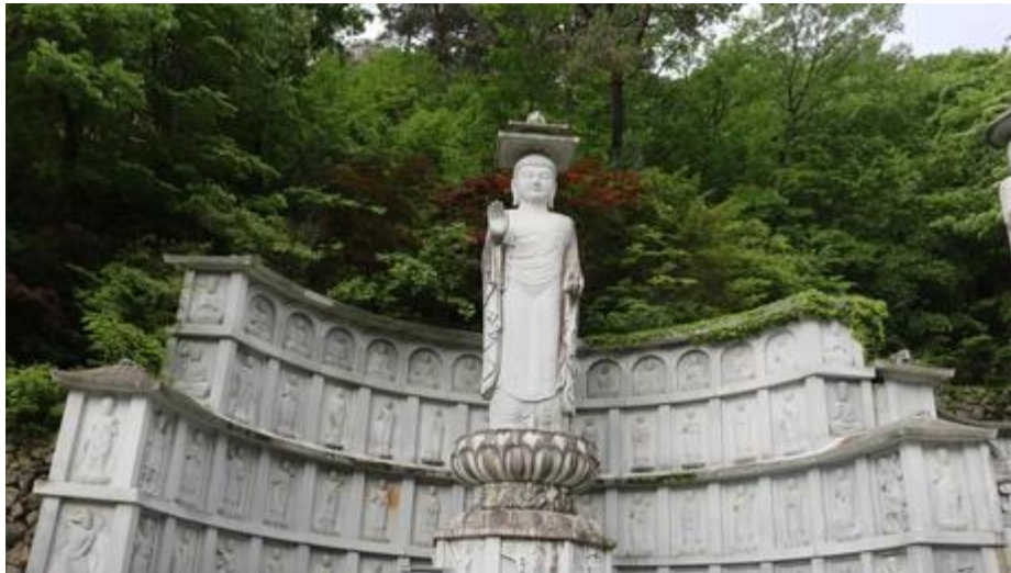
Figura 4 - Estátua de Buda no Templo de Haeinsa