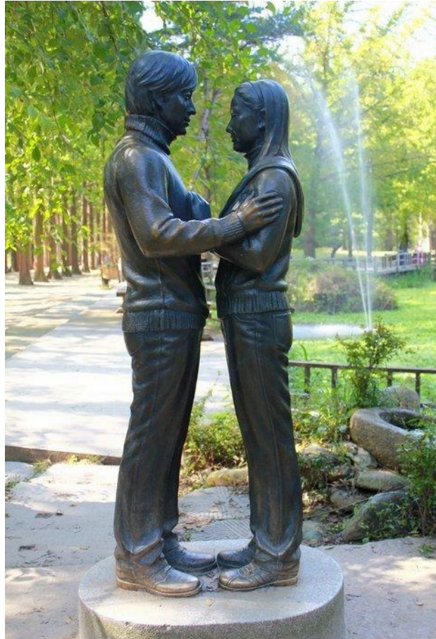
Figura 13 - Estátua dos Personagens do drama Winter Sonata na ilha de Nami na Coreia do Sul, local onde o drama foi gravado.