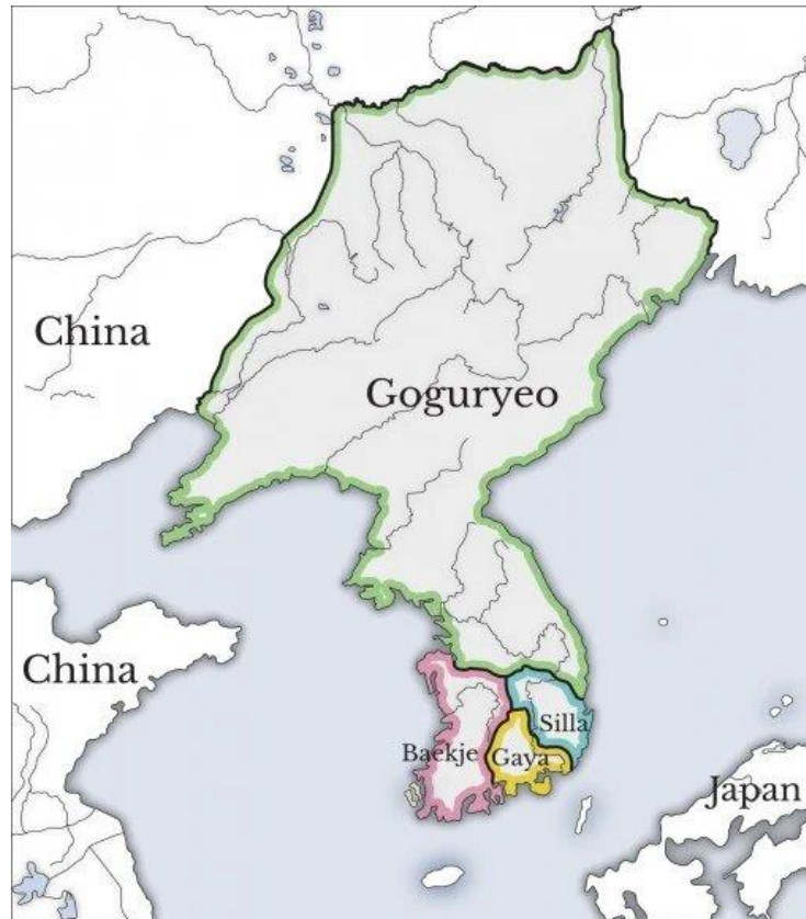
Figura 3 - Os Três Reinos e a Dinastia Goguryeo