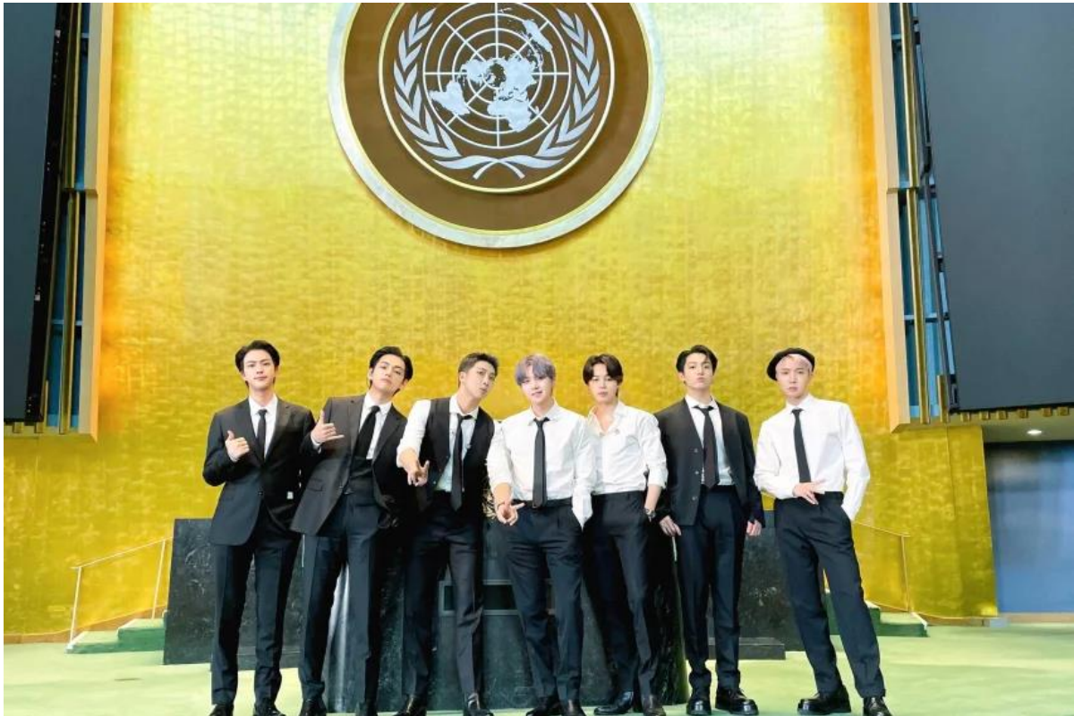
Figura 14 - O grupo BTS, por ocasião de seu discurso da ONU