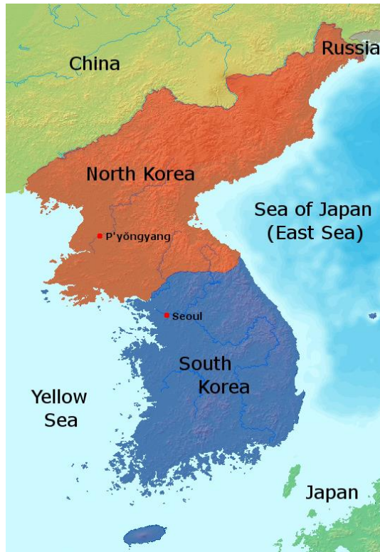
Figura 1- Mapa da Disposição Atual da Península Coreana