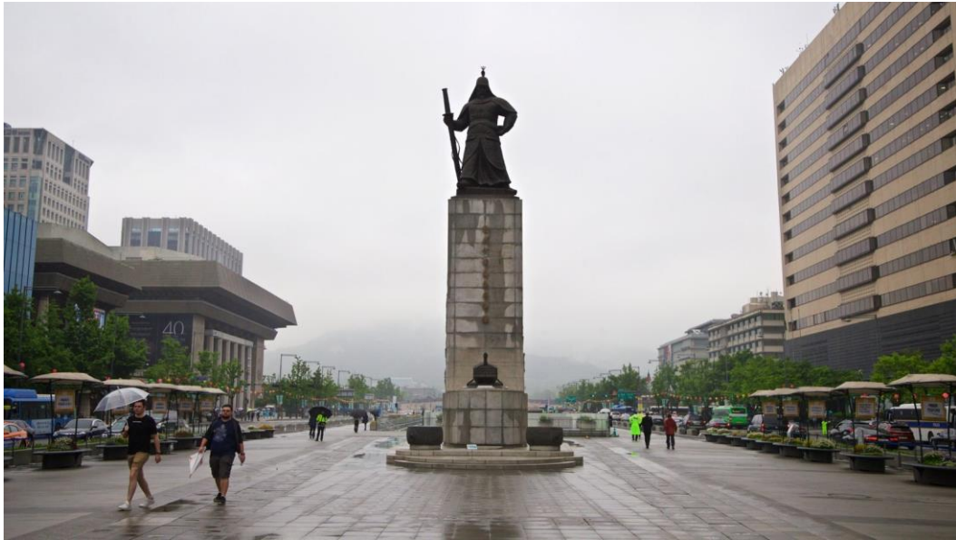
Figura 7 - Estátua do almirante Yi Sun-shin, em Seoul.

tornando assim um dos ícones nacionais, bem como o grande rei Sejong.