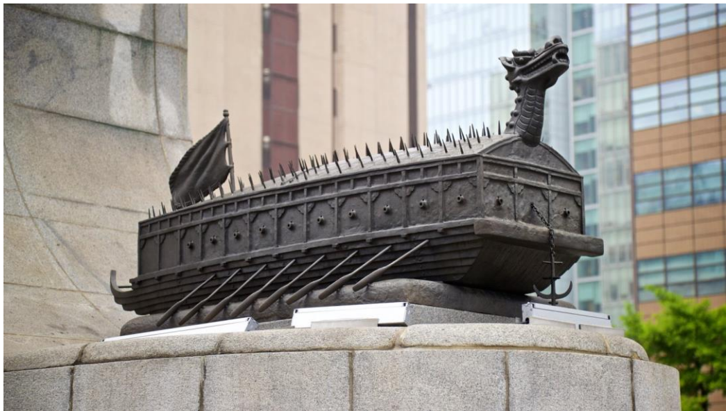
Figura 8 - Estátua do Navio Tartaruga, em Seoul