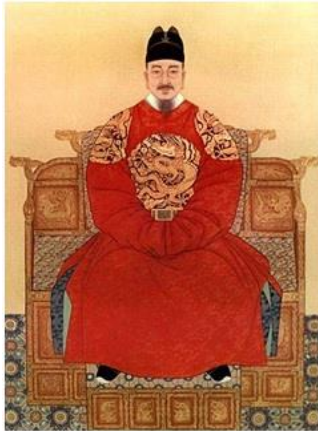
Figura 6 - Rei Sejong

Fonte: Embaixada da República da Coreia na República Federativa do Brasil, 2012.