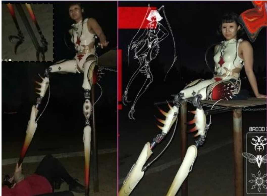
Figura 9 - Arte protética “New Bones”.