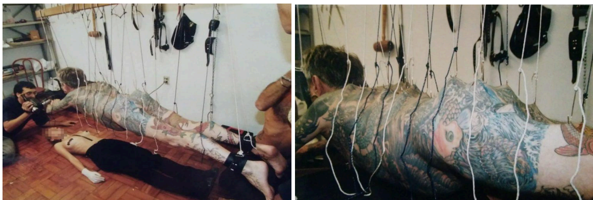
Figura 15 - A primeira suspensão corporal no Brasil.

FRRRK Guys, 2020). Vista na Figura 15. Seu depoimento revela as dificuldades materiais e de comunicação enfrentadas no início, onde precisaram adaptar equipamentos e criar redes de conhecimento em um ambiente ainda recente para tais práticas.