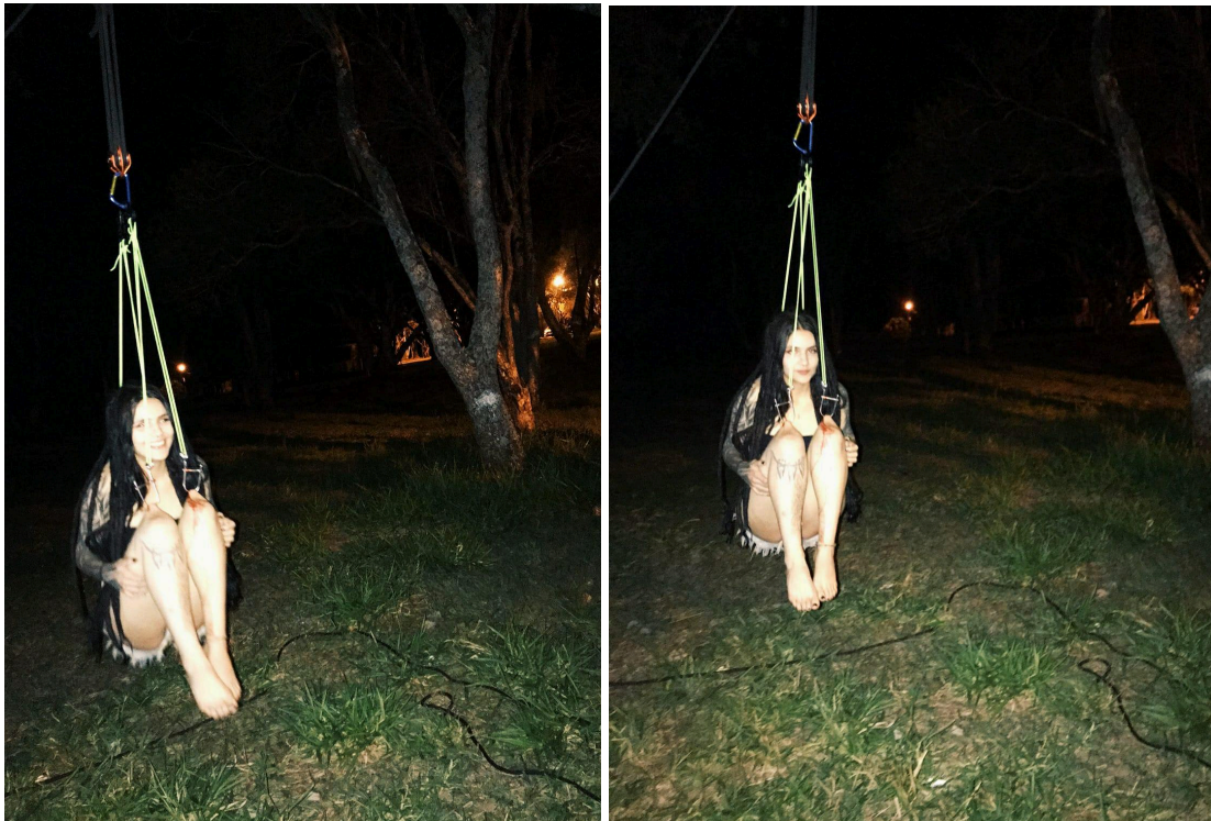
Figura 18 - Suspensão pelos joelhos e costas, em posição de “cadeirinha”.

E dessa maneira, vou descobrindo o que pode um corpo em seu devir-monstro. Aprendo a soltar o controle, respirar compassadamente, a sentir às coisas como elas são e como chegam até a mim, para aí então, fazer transmutar. Quase como numa meditação ativa aprendo a voar e, ao revelar tal força interior, até então desconhecida, os limites da corporalidade são também redefinidos e aplicados à vida. Como traduzido por T. Angel (2025, p. 26), “Fazendo a travessia. Sem temer a treva da noite. Sendo também a treva da noite”, ou até mesmo, a própria noite. Bailando com o caos para criar coisas raras, estranhas e extraordinárias.