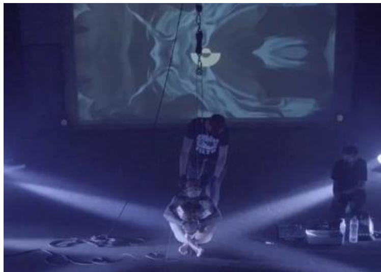
Figura 8 - Performance Danse NeurAle (Lukas Zpira).