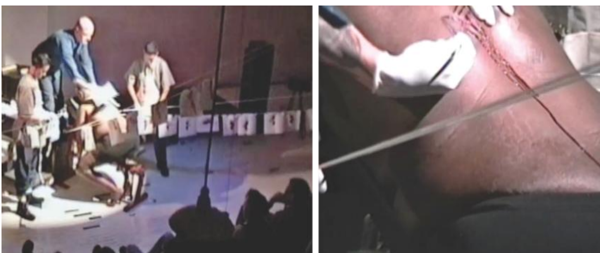
Figura 4 - Cena da "Prensa de Impressão Humana" na performance de Ron Athey (1994).

Uma cena marcante dessa obra é a da "Prensa de Impressão Humana" (Figura 4), onde com um bisturi, são feitos cortes nas costas de seu colaborador, entre as marcas está a representação simbólica do "triângulo rosa". Os cortes eram carimbados como impressões em papel e pendurados em um varal sob a plateia. O ato representou uma escrita coletiva do luto e, ironicamente, um bode expiatório nas guerras culturais norte-americanas, precipitando cortes de financiamento à arte. No entanto, Athey insiste que sua obra transcende a ficção teatral, afirmando: "É mais uma experiência controlada do que teatro. O sangue, a dor e a exaustão são reais" (ATHEY apud JOHNSON, 2013, p. 17).