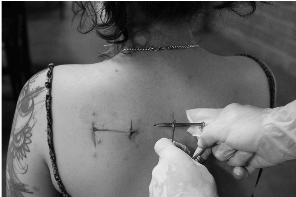
Figura 27 - Retirada de ganchos pós performance.

A fase final, ou pós-produção, é tão crucial quanto as anteriores, pois é quando a experiência se dissolve no espaço mas se inscreve no corpo, integrando-se à memória. Compreende a remoção cuidadosa dos instrumentos, a limpeza imediata das perfurações, a aplicação de curativos adequados e, sobretudo, o tempo necessário para sentir e acolher o corpo em seu processo singular de cicatrização. Esta etapa é de interiorização e escuta, na qual os sinais físicos são observados com respeito.