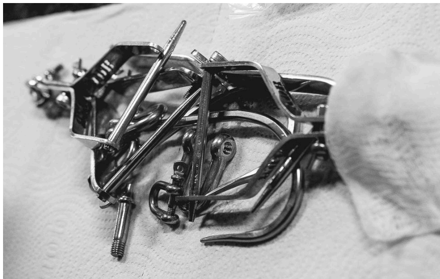
Figura 25 - Ganchos utilizados em performance de suspensão corporal