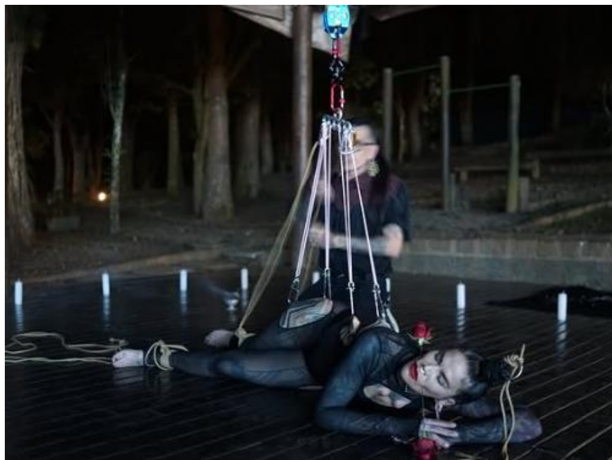
Figura 13 - La Pomba Negra em cena.