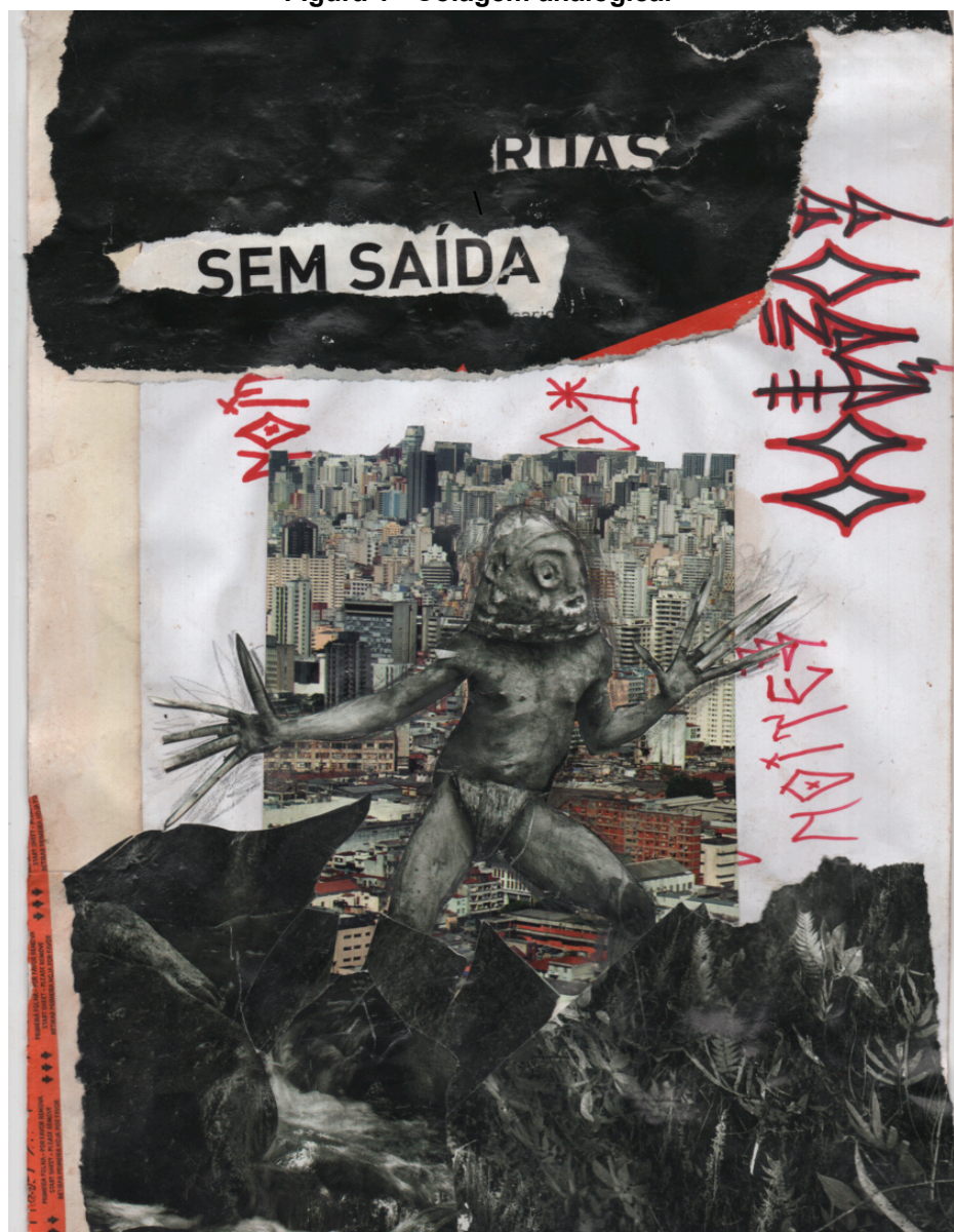
Figura 1 - Colagem analógica.

Fardos, o meu tenho que carregar, olhar para trás e projetar à frente. Semente (e semeia) que cresce até no concreto.