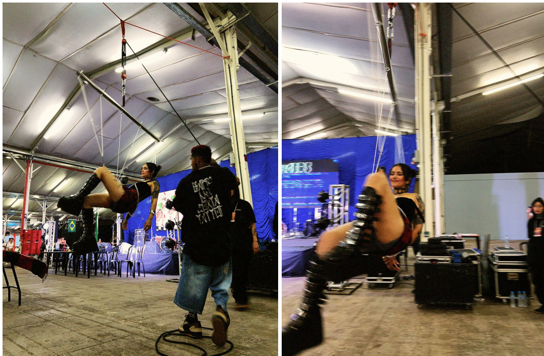
Figura 22 - Registros da suspensão corporal apresentada durante convenção de tatuagem.