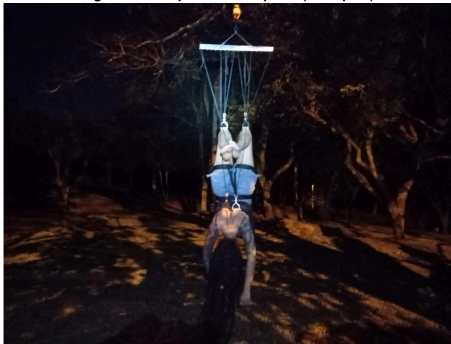
Figura 19 - Suspensão “scorpion” (escorpião).

olhe para dentro e respeite o processo de cura. As dores musculares que, acompanham durante os dias seguintes, lembram de maneira afetuosa a colisão corpo-mundo. Um conforto no desconforto. Afinal, estamos vivos!