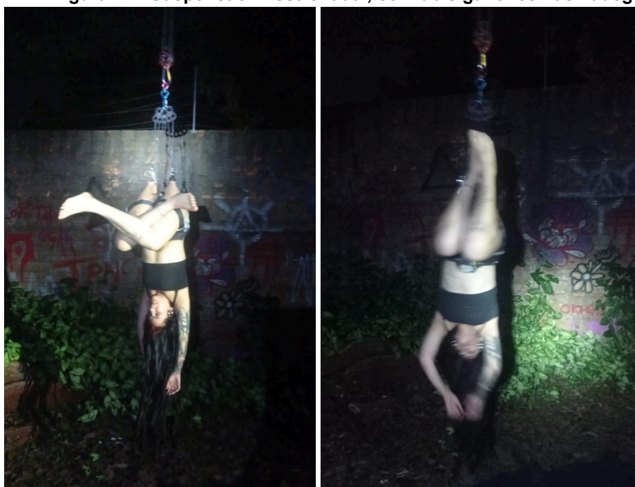
Figura 17 - Suspensão "Asstronaut", com dois ganchos nas nádegas.

Essa libertação, toma diferentes formas a cada suspensão. Na "Asstronaut" (Figura 17), com dois ganchos nas nádegas, experimentei uma leveza paradoxal, onde a gravidade não existia. Meu corpo, como um peão-caleidoscópico, é capaz de acessar diversas dimensões do espaço, enquanto o tempo é suspenso e sutil, e o movimento gera novas perspectivas. Para enxergar e refletir sobre a vida, com leveza, audácia e sagacidade.