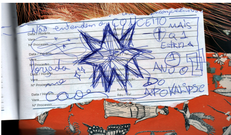
Figura 2 - Anotações e colagem analógica.

Tive o privilégio, dentre tantos, de crescer em um núcleo familiar muito acolhedor. Portanto, minha identificação enquanto pessoa LGBTQIAPN+, nunca foi uma questão, sempre foi algo muito natural, tanto pessoalmente quanto à família. — Devo muito disso a quem veio antes, abrindo a porta do armário para todas as gerações seguintes e tornando esse ambiente, um lugar seguro para existir, não só para mim. — Ainda que fosse algo para se lidar com o mundo externo. Ter o respeito e a segurança para expressar minha identidade, enquanto mulher queer bissexual — exagerada, esquisita, insubordinada, mulher viado — sempre foi algo muito fortalecedor. Permitindo que pudesse criar e viver de acordo com minha própria autenticidade de sentir-pensar.