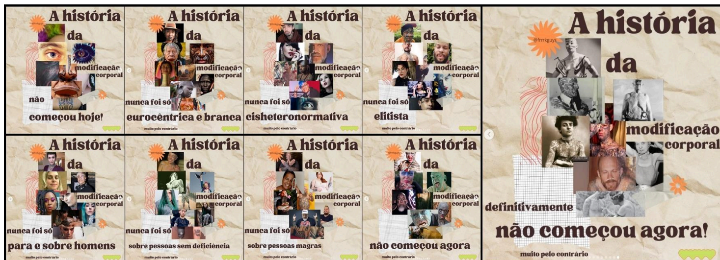
Figura 10 - Carrossel de fotos informativo sobre a história da modificação corporal.