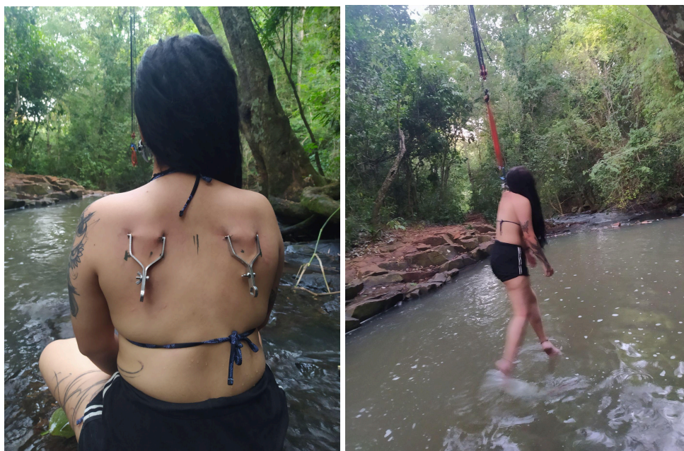
Figura 16 - Minha primeira suspensão corporal: a iniciação.

Minha iniciação nos ganchos (Figura 16), como já dito, vem da urgência de um corpo em luto, pandêmico e sobrecarregado. Nasce da urgência de se sentir vivo, de olhar para dentro, mediar as sensações ou, simplesmente aceitá-las na completude. Assim, meu primeiro vôo ocorre em 2021, quatro anos após ter visto, ao vivo pela primeira vez, alguém suspenso. Mesmo que atravessada pela dor, essa experiência é conscientemente motivada pela arte e fortalecida pela ancestralidade, num processo de canalização do potencial de cura que nelas se encontram. E foi assim, num ritual privado e acolhido pela força da natureza, que fiz minha primeira travessia. Ainda mais especial, por ter sido realizada em Foz do Iguaçu, nas terras de tríplice fronteira. A partir de então, nada mais foi como antes.