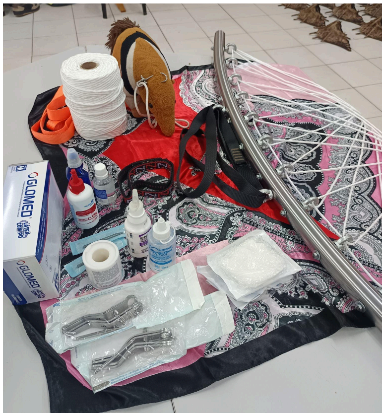
Figura 26 - Bancada utilizada para perfuração de costas

atividade. Procede-se então à antissepsia (limpeza) meticulosa da pele, seguida de marcações anatômicas que guiarão as perfurações.