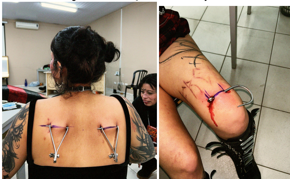
Figura 21 - Perfurações nas costas e joelho.

Nesse sentido, quando fui me apresentar no evento, já haviam passado cerca de dois anos desde minha última suspensão. Portanto, foi também momento de lembrar sensações do repertório à partir das novas colisões, de confiar no processo e na vontade de viver-arte. Toda tensão que pudesse existir entre eu e os ganchos, sumiram após as perfurações, duas delas que ocorreram simultaneamente. — Graças à uma equipe maravilhosa, vide Figura 23, gracias Unificarte (T. Dark + Veikko) — E mais uma vez, o processo se mostrou muito mais divertido, tranquilo e gentil do que todo medo projetado mentalmente. À vontade para voar e apenas ser.