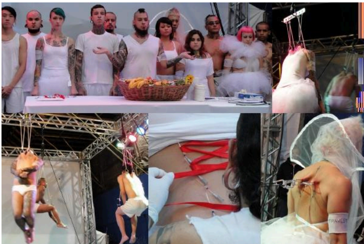
Figura 12 - “O Peso do Cinza e as Memórias de Nós” apresentado na Virada Cultural/SP.