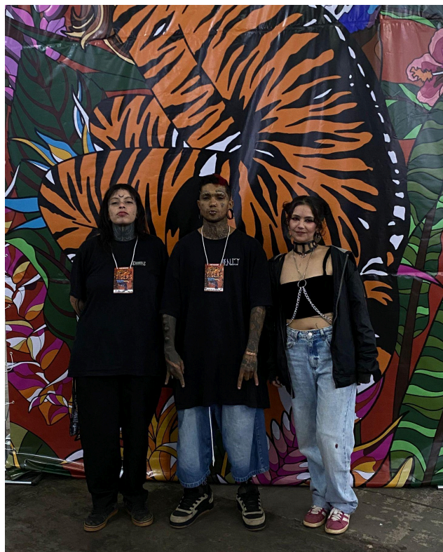
Figura 23 - Unificarte na convenção de tatuagem.